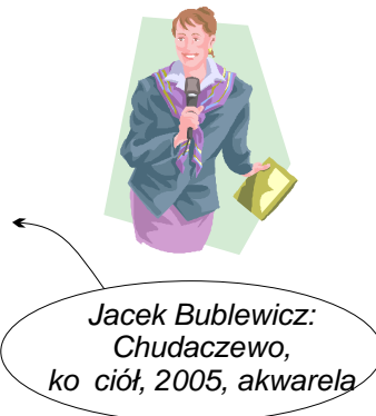
Jacek Bublewicz: Chudaczewo, ko ciót, 2005, akwarela

... i przyznała dla Sołectwa Chudaczewo dotacj w wysoko ci 1963 zł na realizacj ciekawych zaj dla dzieci i młodzie y w trakcie zimowych ferii szkolnych w 2008 roku. Apetyt ro nie w miar jedzenia- to przystawie doskonale sprawdza si w ród mieszka ców Chudaczewa.