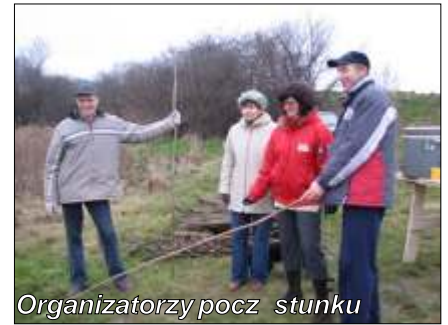
Organizatorzy pocz stunku