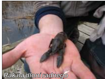
Rak na dłoni radnego