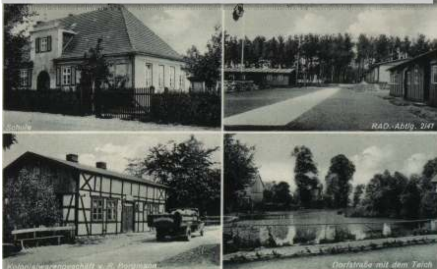
Korlino ok 1941. - Szkoła, baraki obozu słu by pracy Rzeszy, sklep kolonialny. "Dawny Powiat Sławie ski".