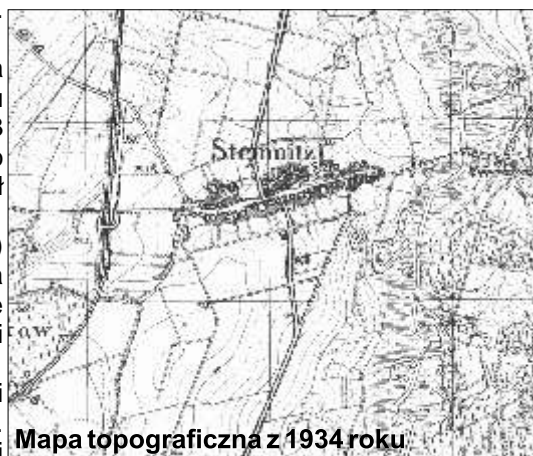
Mapa topograficzna z 1934 roku