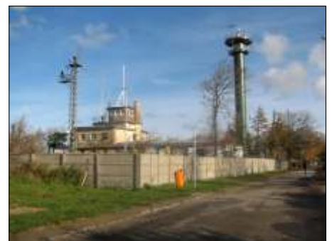
Prezentujemy now budowl , o której pisali my w poprzednim numerze SZEPTu.