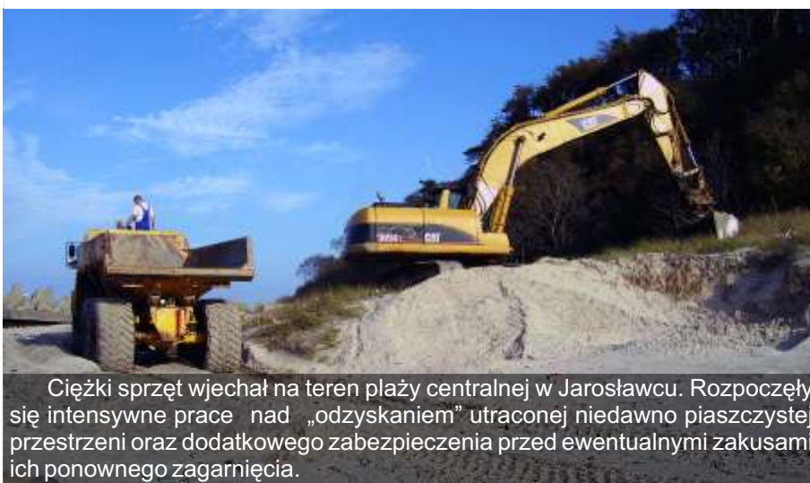
Ciężki sprzęt wjechał na teren plaży centralnej w Jarosławcu. Rozpoczęły się intensywne prace nad „odzyskaniem” utraconej niedawno piaszczystej przestrzeni oraz dodatkowego zabezpieczenia przed ewentualnymi zakusami ich ponownego zagarnięcia.