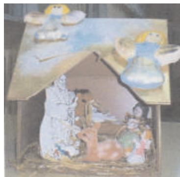
Paulina Porożyńska i Ryszard Grzelak

wykonywane według własnego pomysłu i z różnych ogólnie dostępnych materiałów. Proszę ocenić; wytwory młodych serc i umysłów przeszły najśmielsze oczekiwania.