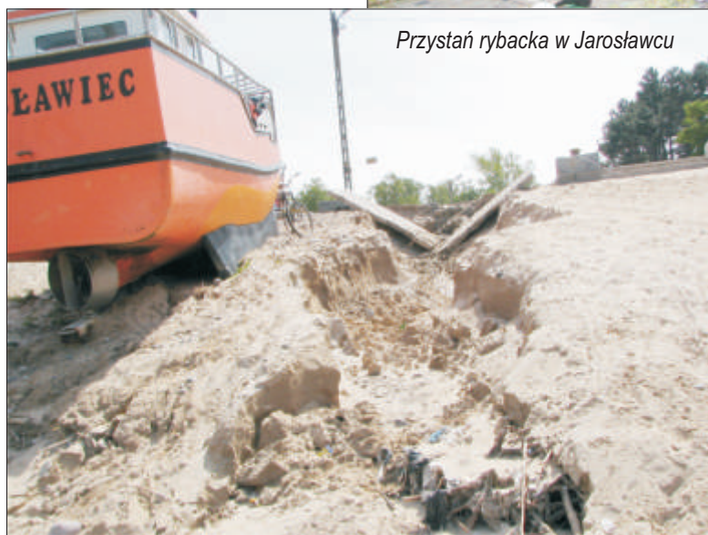
Przystań rybacka w Jarosławcu