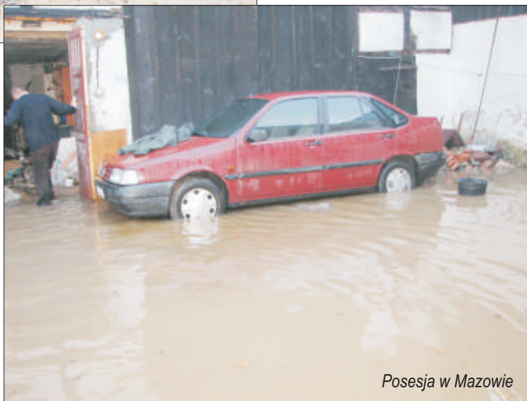
Posesja w Mazowie