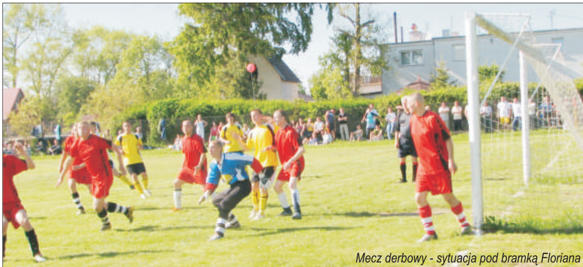
Mecz derbowy - sytuacja pod bramką Floriana