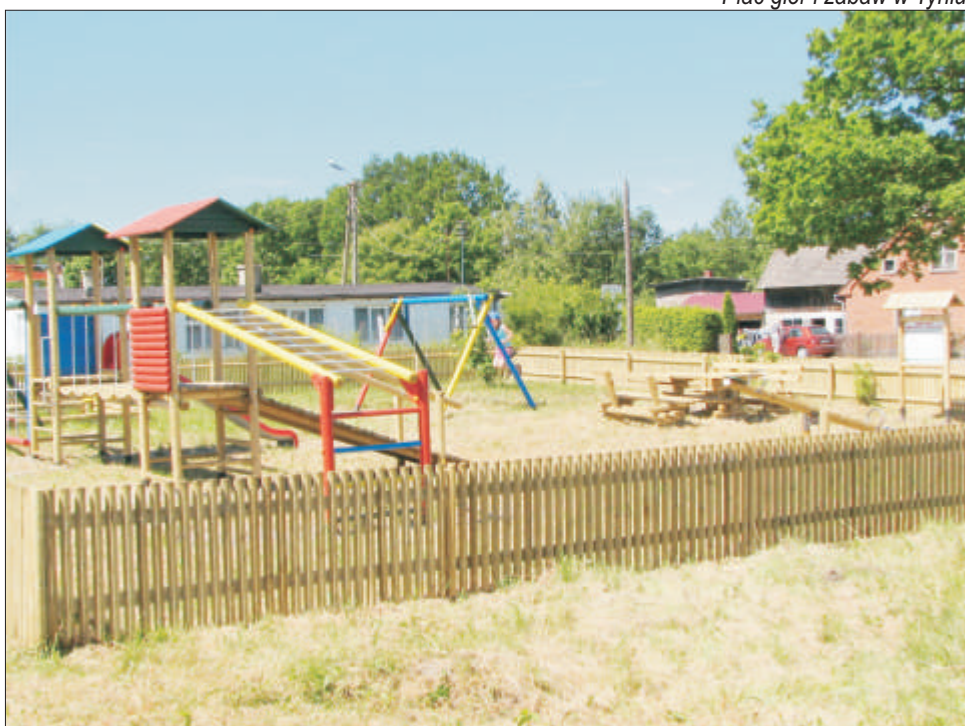
Plac gier i zabaw w Tyniu