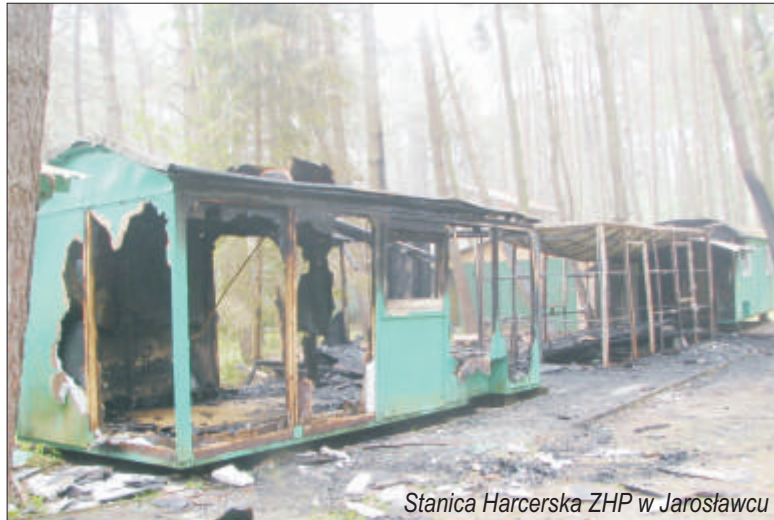
Stacja Harcerska ZHP w Jarosławcu