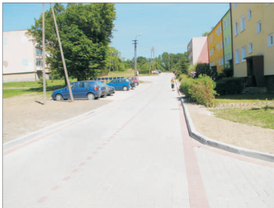
Nowa nawierzchnia ulicy w Pieńkowie