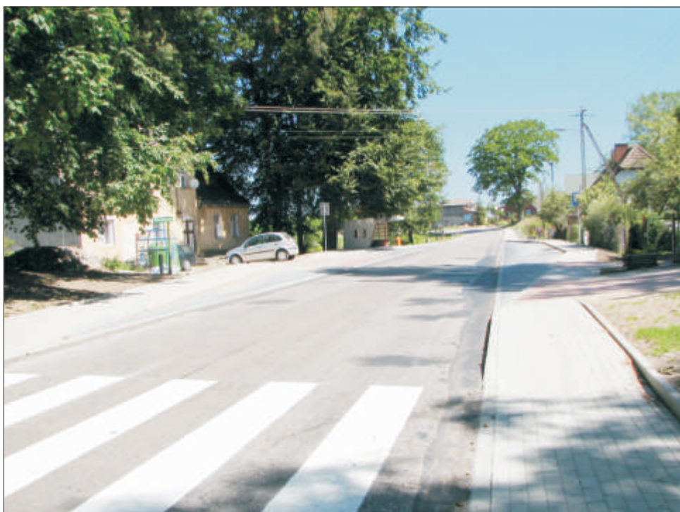
Chodnikiem po Wszedzeniu