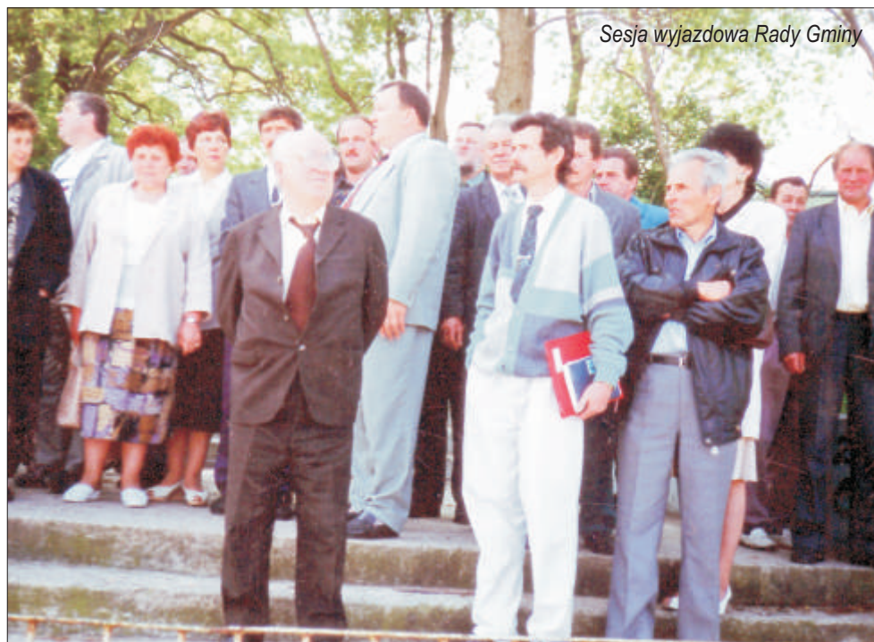
Sesja wyjazdowa Rady Gminy