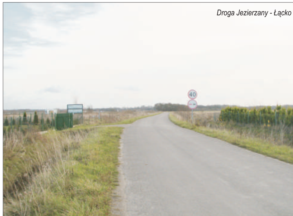
Droga Jezierzany - Łącko