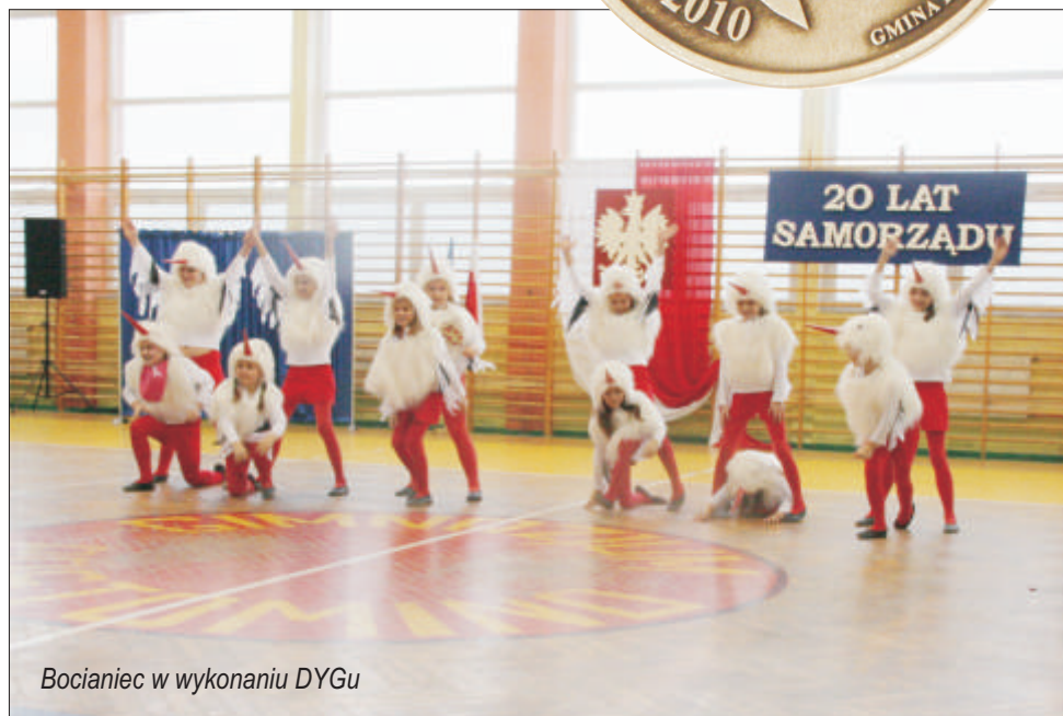
Bocianiec w wykonaniu DYGU