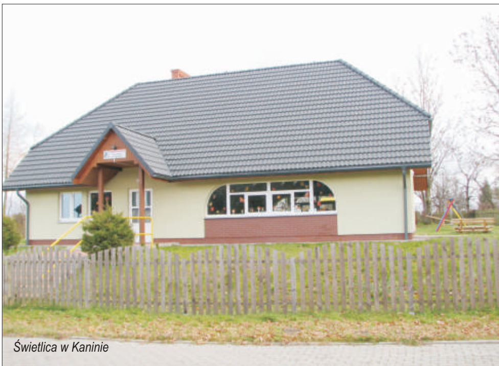
Świetlica w Kaninie

w Jarosławcu, modernizacja świetlicy w Królewie oraz urządzenie placu gier i zabaw w Staniewicach. Zamontowano 20 dodatkowych punktów oświetlenia ulicznego w 8 kolejnych miejscowościach. Na koniec 2005 roku działalność gospodarczą prowadziły 504 podmioty gospodarcze, w większości z zakresu handlu i usług.