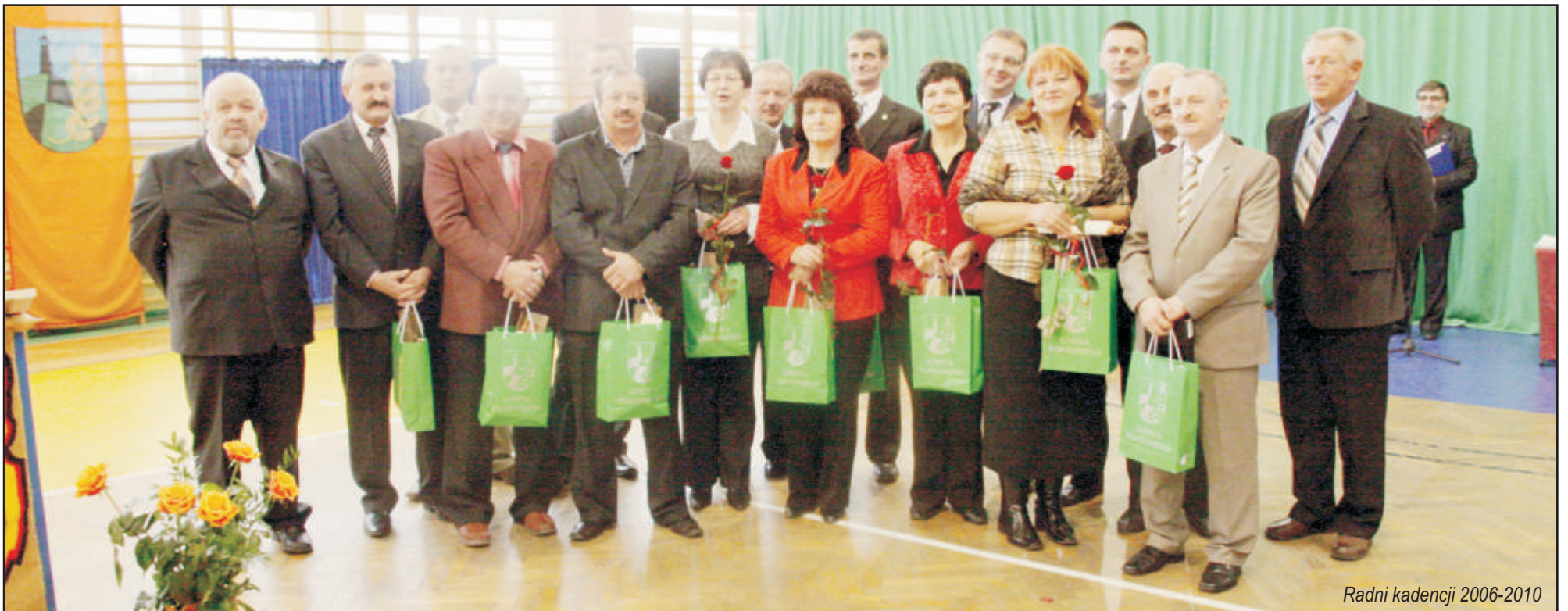
Radni kadencji 2006-2010