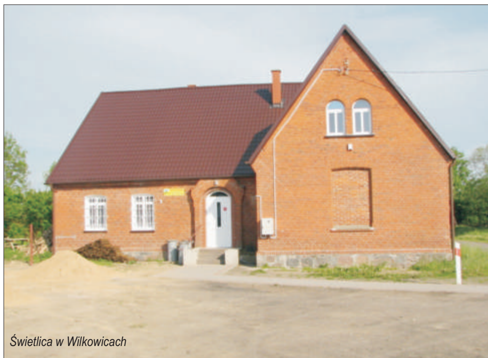
Świetlica w Wilkowicach