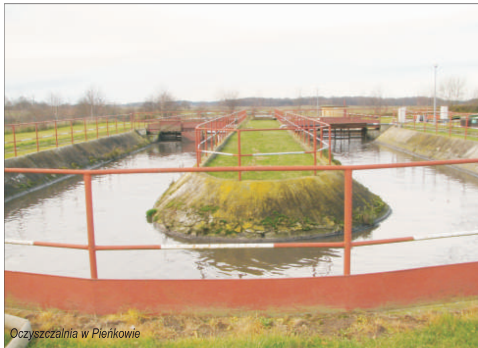
Oczyszczalnia w Pieńkowie

Bezrobocie na koniec 2001 roku wynosiło 1129 osób, w tym 282 z prawem do zasiłku. Większość bezrobotnych (około 70%) to byli pracownicy upadłych państwowych gospodarstw rolnych z wykształceniem zawodowym lub podstawowym, którzy mieli znikome szanse znalezienia pracy na terenie gminy. Osoby bezrobotne zatrudniane były w ramach tzw. prac interwencyjnych i robót publicznych.