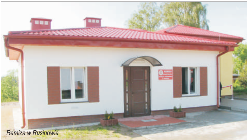
Remiza w Rusinowie