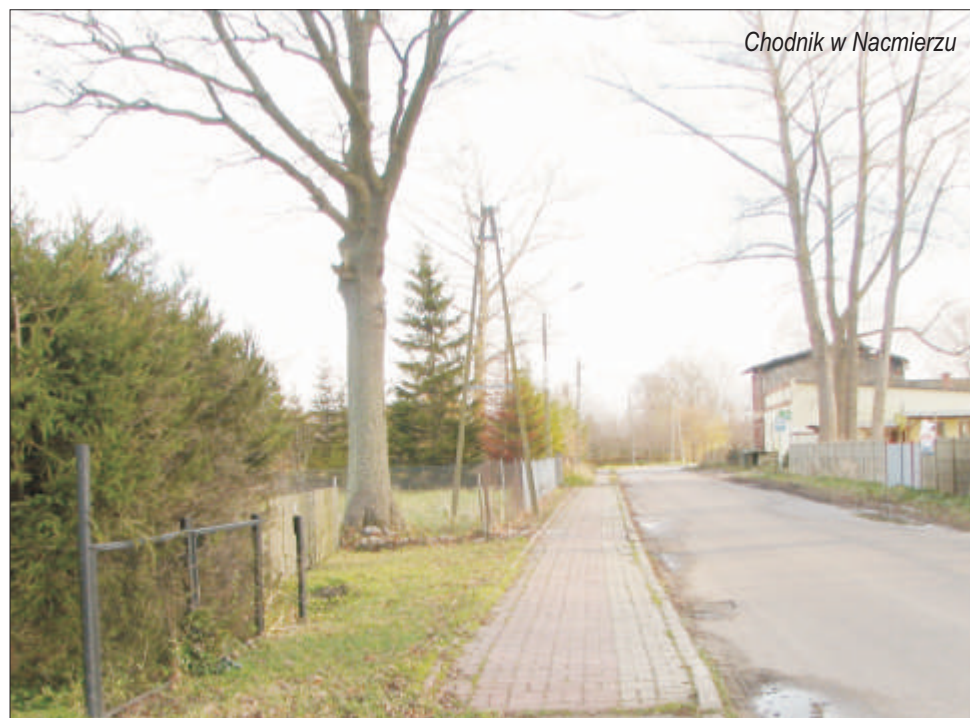
Chodnik w Nacmierzu

Opracowano m.in. plan zagospodarowania przestrzennego terenu stacji bazowej telefonii komórkowej