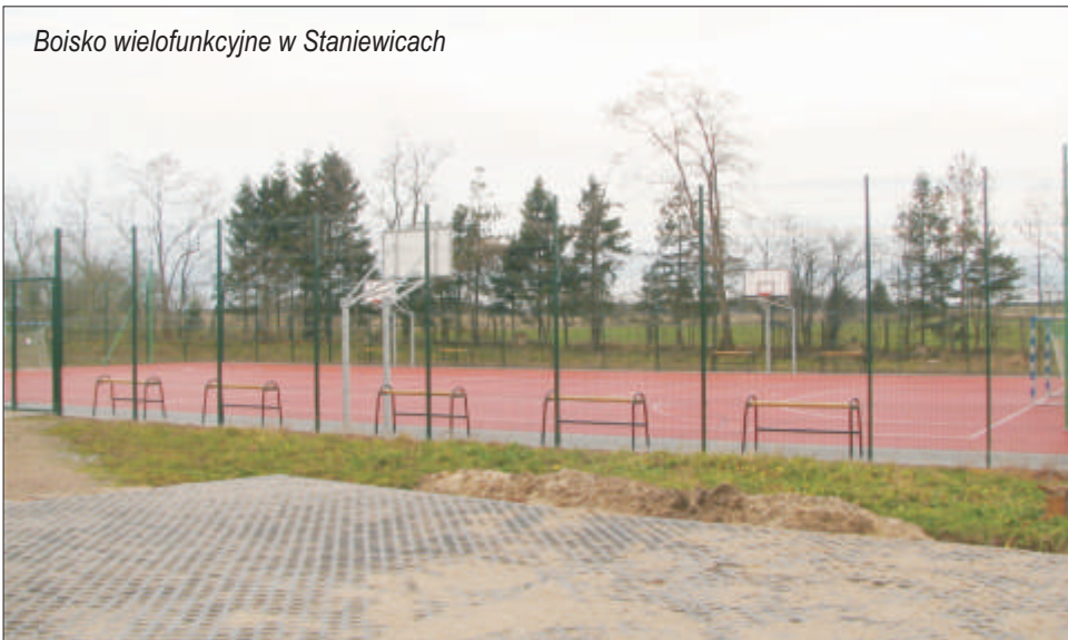
Boisko wielofunkcyjne w Staniewicach