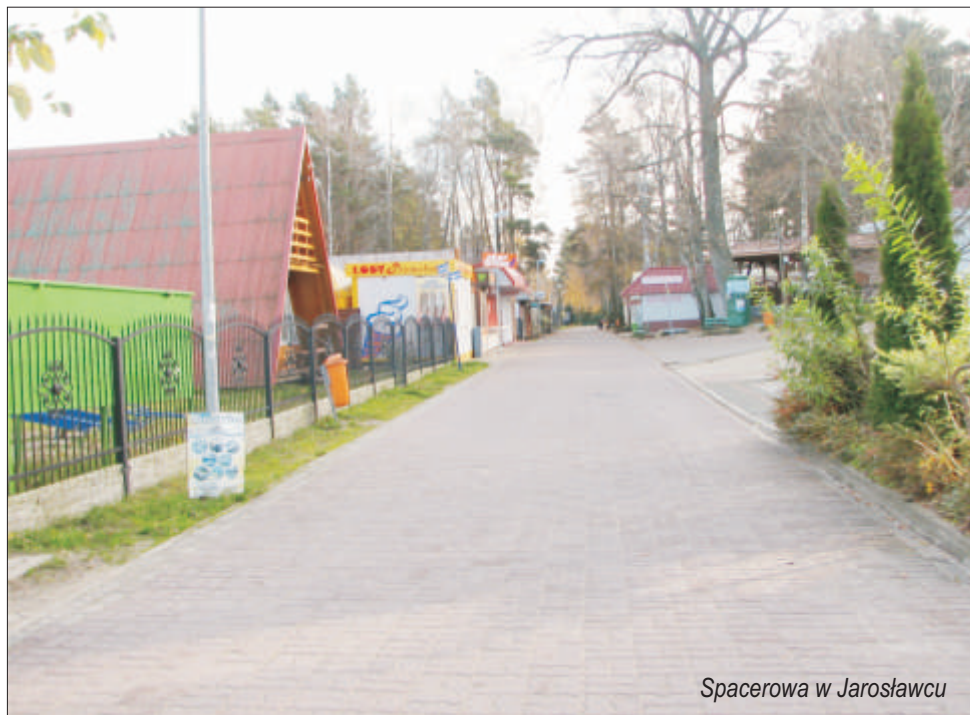
Spacerowa w Jarosławcu

Na koniec 1997 roku było 876 zarejestrowanych bezrobotnych, w tym 551 kobiet. Ludzi bezrobotnych zatrudniano do prac użytecznie społecznych w ramach tzw. prac interwencyjnych i robót publicznych (prace remontowe, porządkowe,