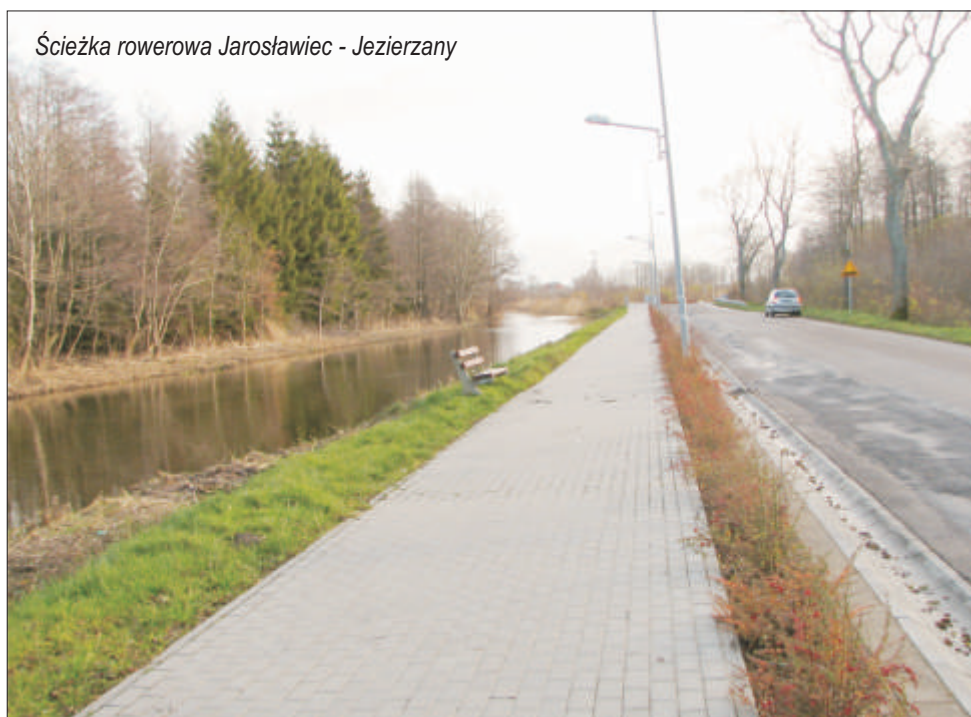
Ścieżka rowerowa Jarosławiec - Jezierzany

w Staniewicach. Powstało nowe boisko sportowe w Pałowie i Chudaczewie, rozpoczęły się prace przy budowie boiska w Pałótku. Utworzonych zostało 11 nowych placów gier i zabaw dla dzieci. Ulica Uzdrawiskowa w Jarosławcu zyskała nową nawierzchnię i stanowi naturalne, najkrótsze połączenie tej miejscowości z agroturystycznym Nacmierzem. Oddano do użytku obiekt Centrum Kultury i Sportu w Postominie (w budynku po szkole zawodowej), wyremontowano świetlicę i remizę w Nacmierzu i Centrum Aktywności Społecznej w Postominie (koncentracja działalności klubów i stowarzyszeń itp.). Utworzono cztery punkty przedszkolne w Postominie, Kaninie, Wilkowicach i Pałowie. Gmina przystąpiła do „Słowińskiej Grupy Rybackiej”. Opracowano szereg dokumentacji na budowę i modernizację kolejnych obiektów użyteczności publicznej.