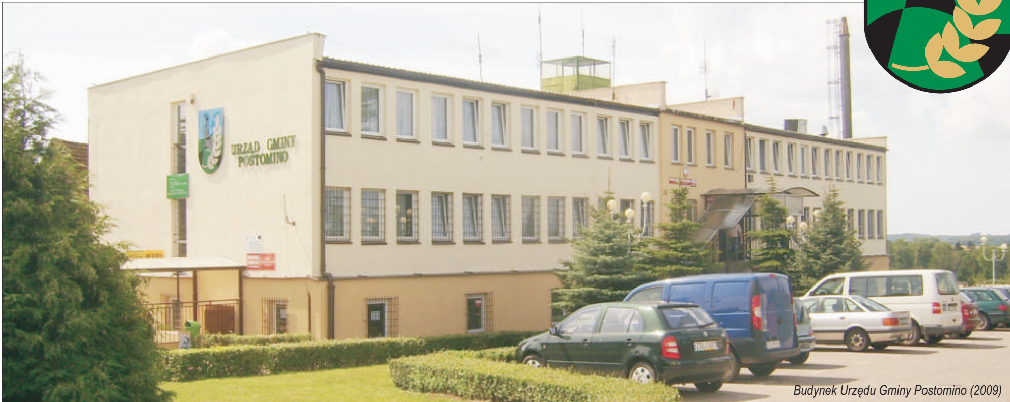
Budynek Urzędu Gminy Postomino (2009)