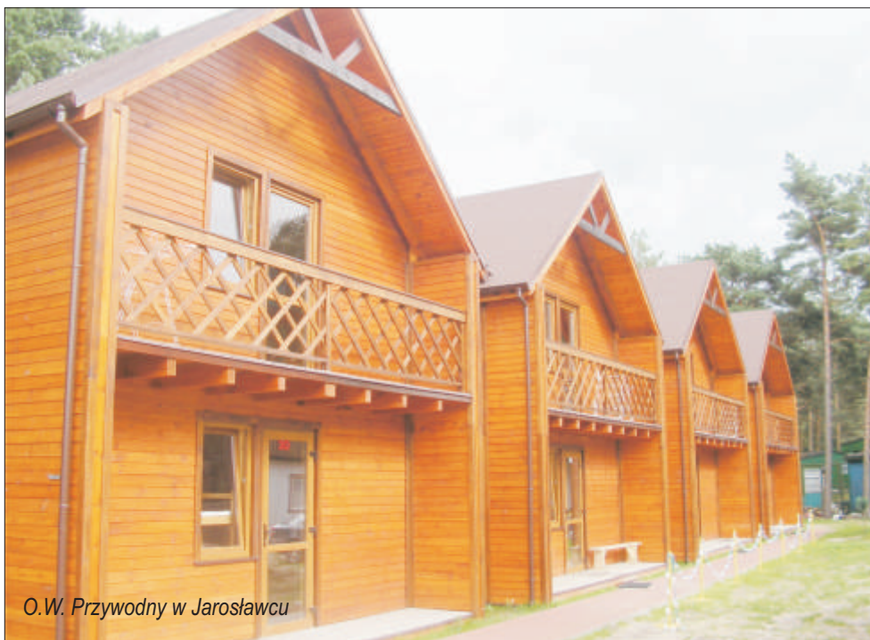
O.W. Przywodny w Jarosławcu

przepompownia) i w Jarosławcu (osiedle Bałtycka – 3 012 mb), budowę drogi w Korlinie i Rusinowie, dróg Królew-Marszewo oraz Karsino-Dzierżęcina, likwidację wysypisk w Pałowie i Marszewie, przebudowę i modernizację ulicy Parkowej i odcinka ul. Rybackiej w Jarosławcu, budowę pętli autobusowej wraz z oświetleniem i wiatą autobusową w Postominiu, budowę domu pogrzebowego - kaplicy w Pieszczu,