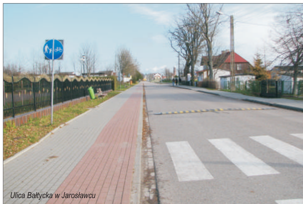
Ulica Bałtycka w Jarosławcu

drogi Łącko – Jezierzany, budowa stadionu sportowego w Postominiu, budowa ścieżki rowerowej i przebudowa ulicy Bałtyckiej w Jarosławcu, budowa świetlicy w Kaninie i remont świetlicy w Wilkowicach, ogrodzenie cmentarza komunalnego w Postominiu, budowa chodnika i zatoki autobusowej w Pieńkowie, budowa placu apelowego przy Zespole Szkół w Postominiu, przebudowa wysypiska śmieci w Bylicy, budowa studni pomiarowej ścieków