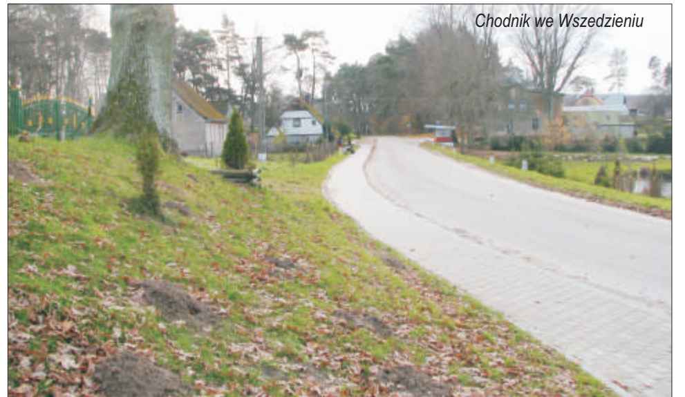
Chodnik we Wszedzieniu