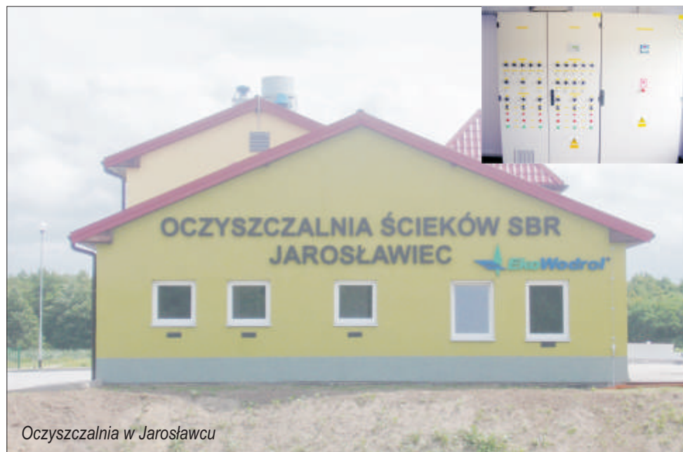
Oczyszczalnia w Jarosławcu

Rok 2006 to m.in. pełna modernizacja oczyszczalni ścieków w Jarosławcu, budowa