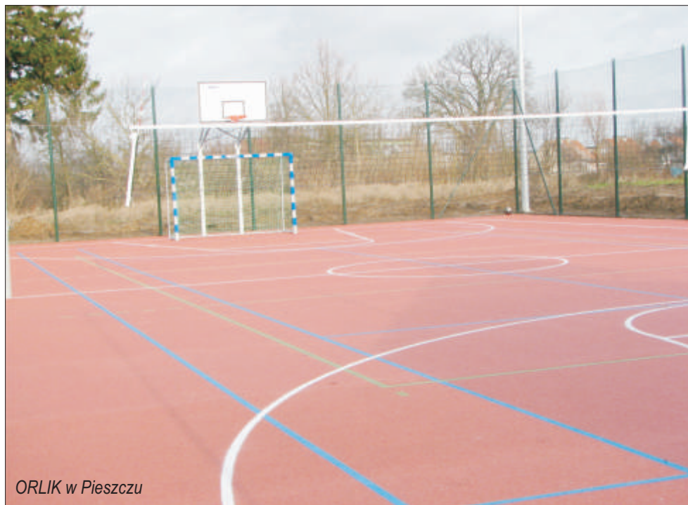
ORLIK w Pieszczu

W 2009 roku wydatki inwestycyjne stanowiły 30,1 % ogółu wydatków. Zbudowana została stacja uzdatniania wody w Staniewicach i Chudaczewku oraz sieć wodociągowa Chudaczewko – Mazów. Powstały dwa nowoczesne obiekty sportowe – kompleks boisk sportowych ORLIK w Pieszczu i boisko wielofunkcyjne