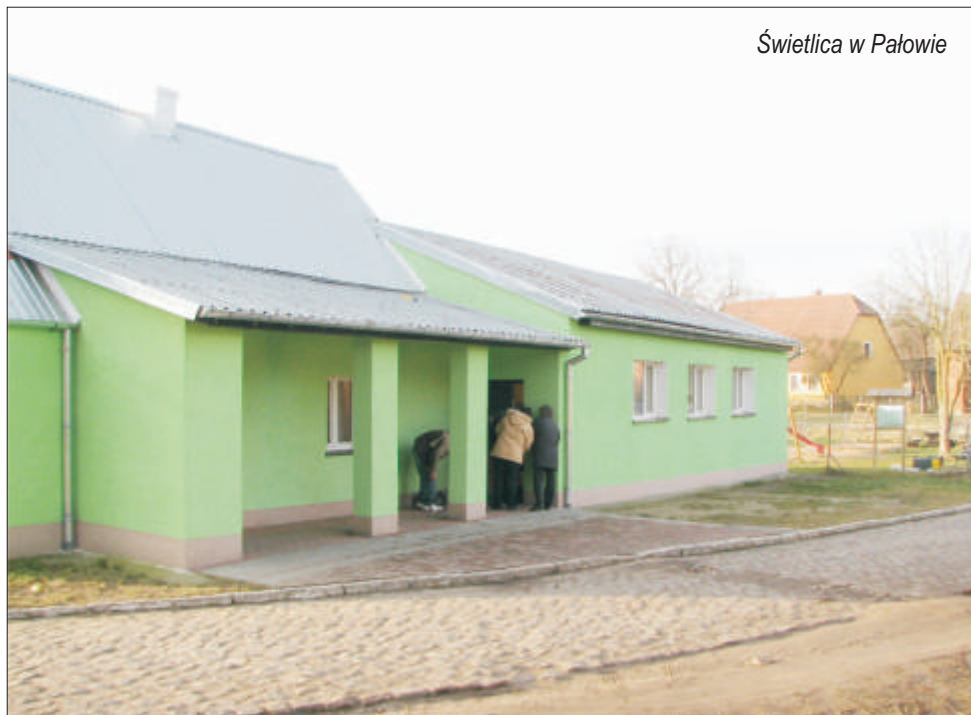
Świetlica w Pałowie