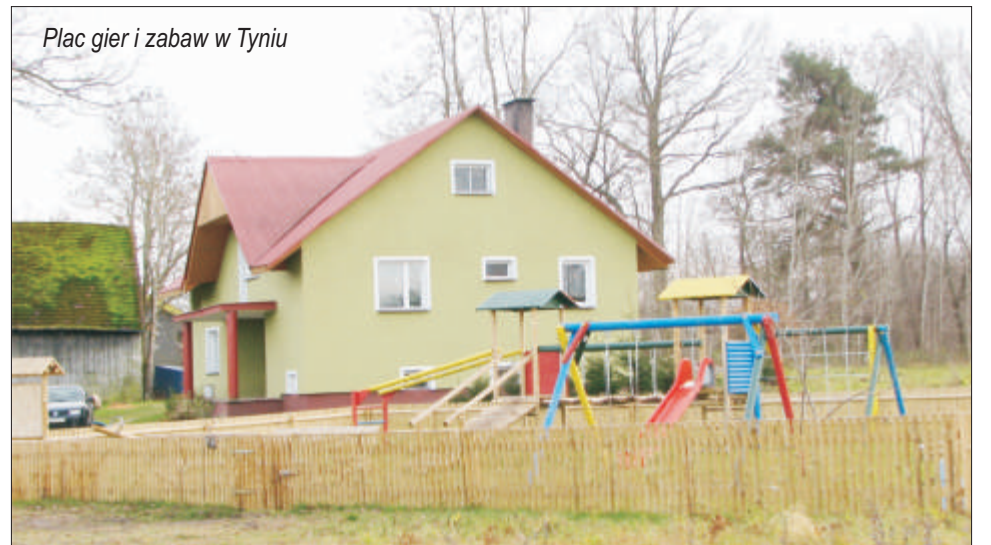
Plac gier i zabaw w Tyniu