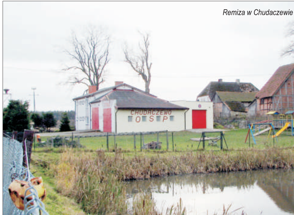
Remiza w Chudaczewie

Rok 1992 to rozbudowa szkoły w Postominie i budowa sali gimnastycznej w Piezszcu, sieci wodociągowej Żłakowo-Górsko-Marszewo, w Jarosławcu i Chudaczewie, na osiedlu w Pieńkowie; zejścia na plażę, zbiornika ppoż. w Rusinowie, oczyszczalni ścieków w Jarosławcu, modernizacji oczyszczalni w Pieńkowie. Opracowano plan zagospodarowania przestrzennego zespołu