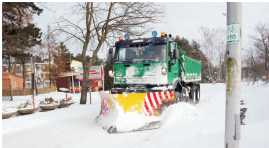
Na ulicach Jarosławca