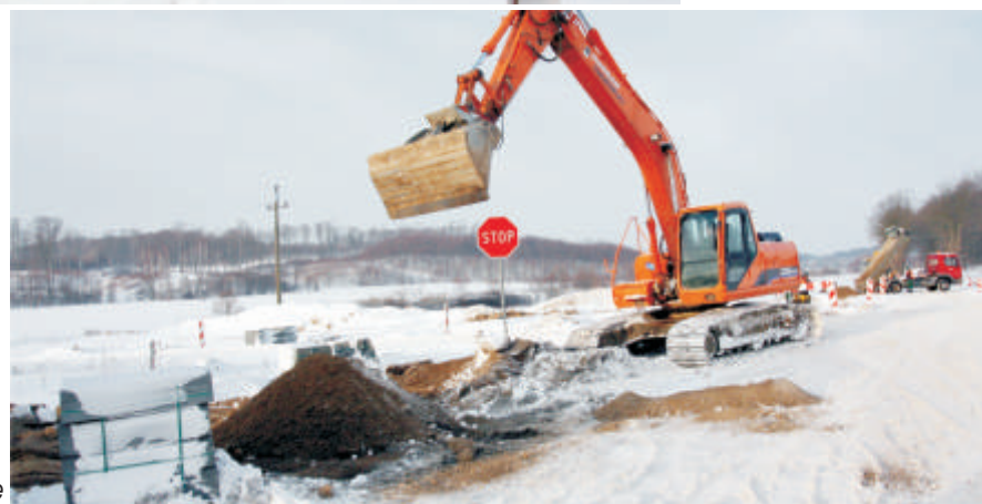
Na budowie ronda w Kaninie