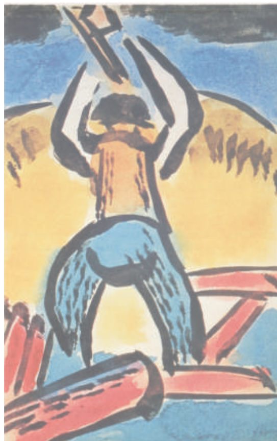
Mężczyzna przy obróbce drewna, akwarela i tusz, 155x105 mm. Pocztówka adresowana do dr R. Schapire. Stempel poczty w Jarosławcu: 16 lipca 1920 roku