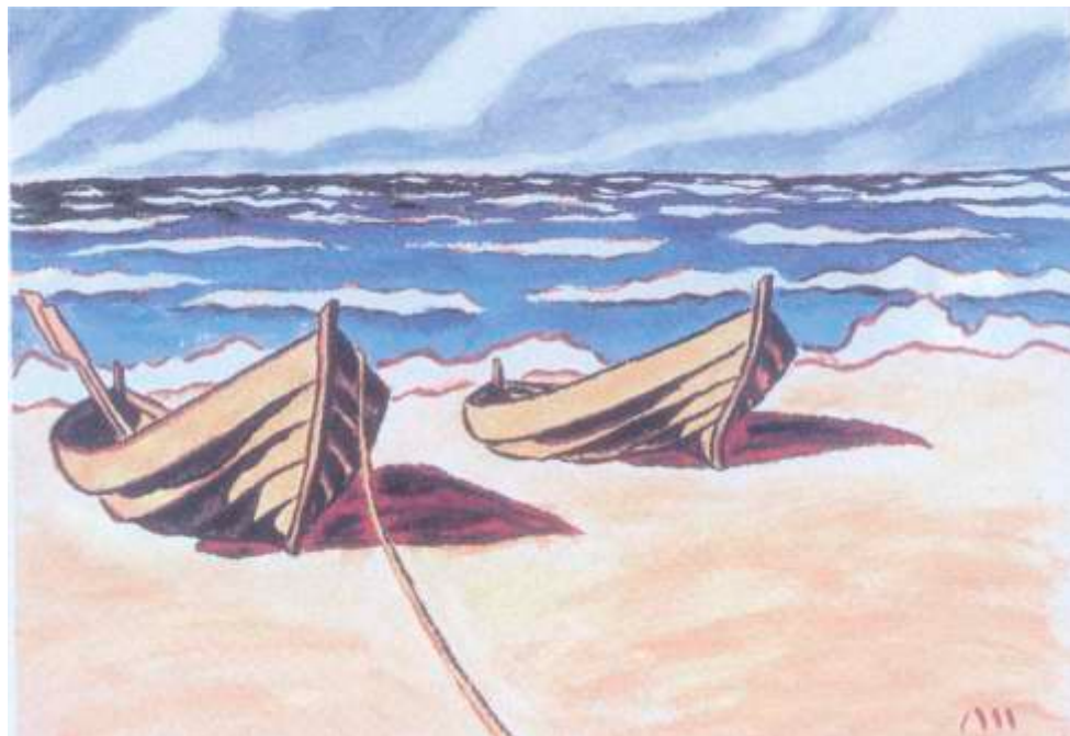
Łodzie na brzegu, akwarela, 1941, 76x56 cm