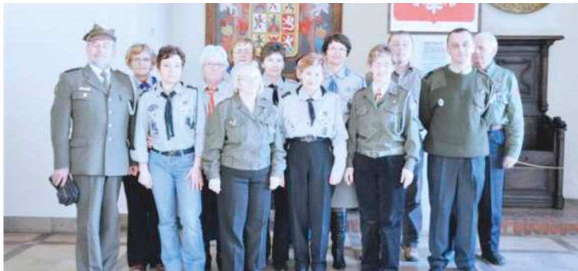
Uroczysta zbiórka na zamku Książąt Pomorskich w Darłowie