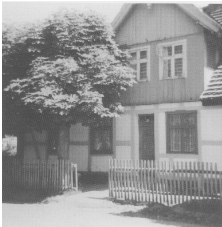
W tym domu w Jarosławcu mieściła się pracownia artysty w latach 1933-1936