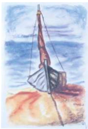
Łódź na plaży, akwarela, 1934, 56x76 cm