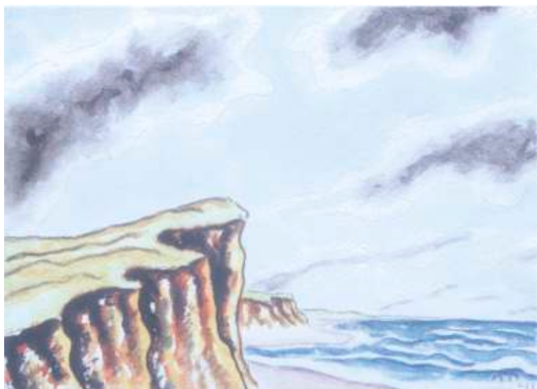
Klif, akwarela, 1941, 76x52 cm