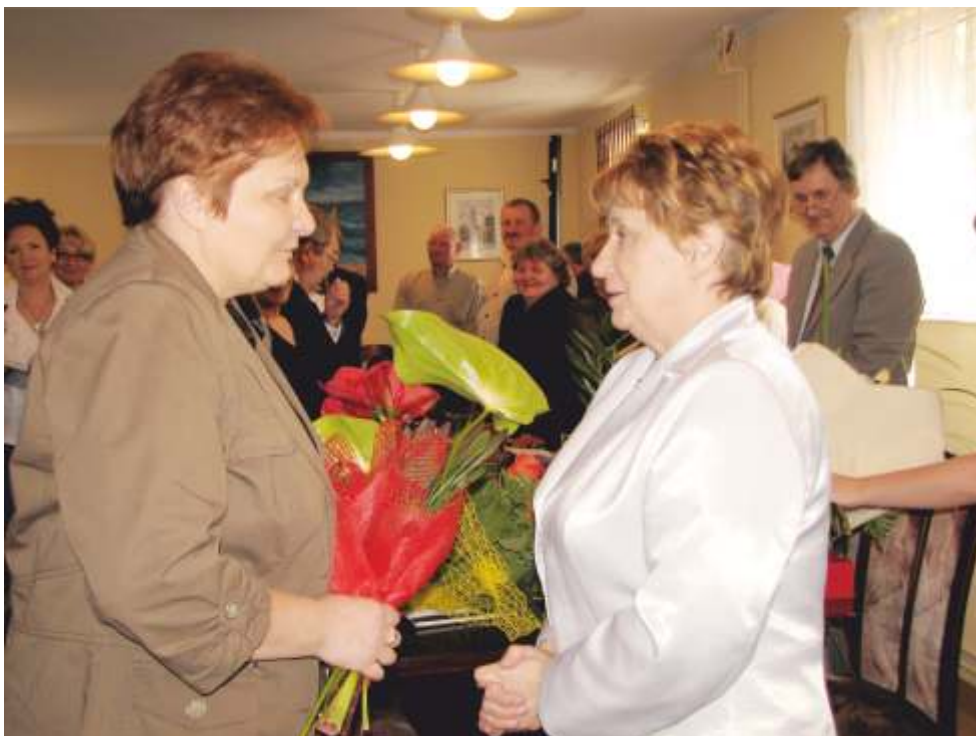
... oraz dyrektorki i wiele, wiele innych osób.