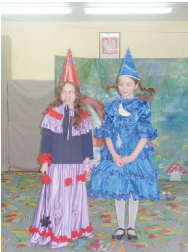
Smyk ze SP w Postominie