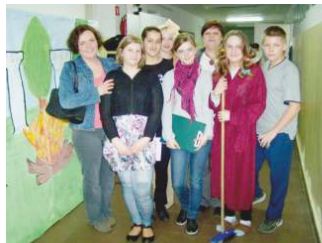
Zespół teatralny z Pieszcza