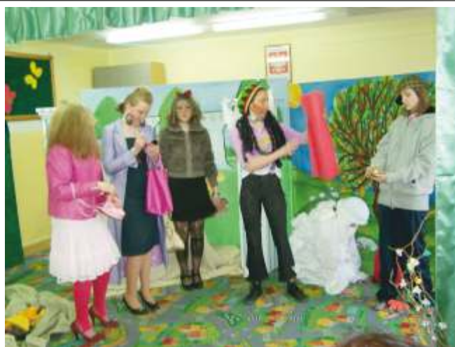
Teatr Młodzieżowy Arlekin z ZSS w Korlinie