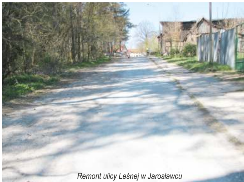
Remont ulicy Leśnej w Jarosławcu