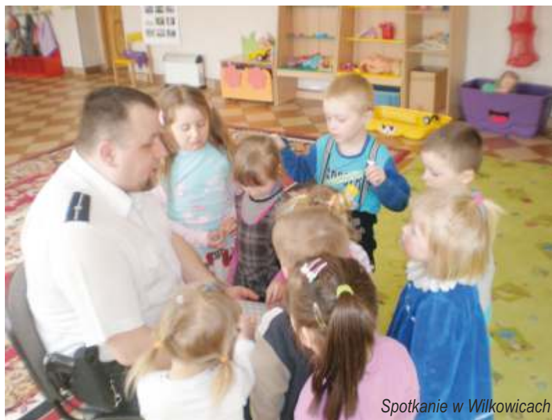
Spotkanie w Wilkowicach