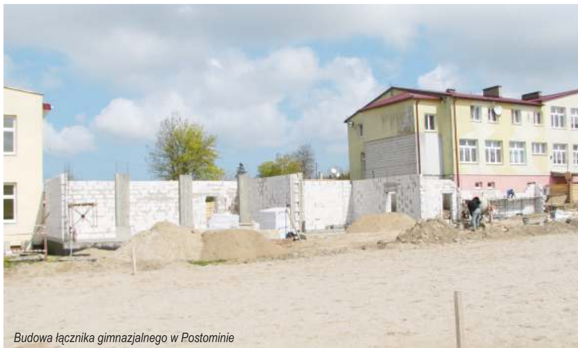
Budowa łącznika gimnazjalnego w Postominie