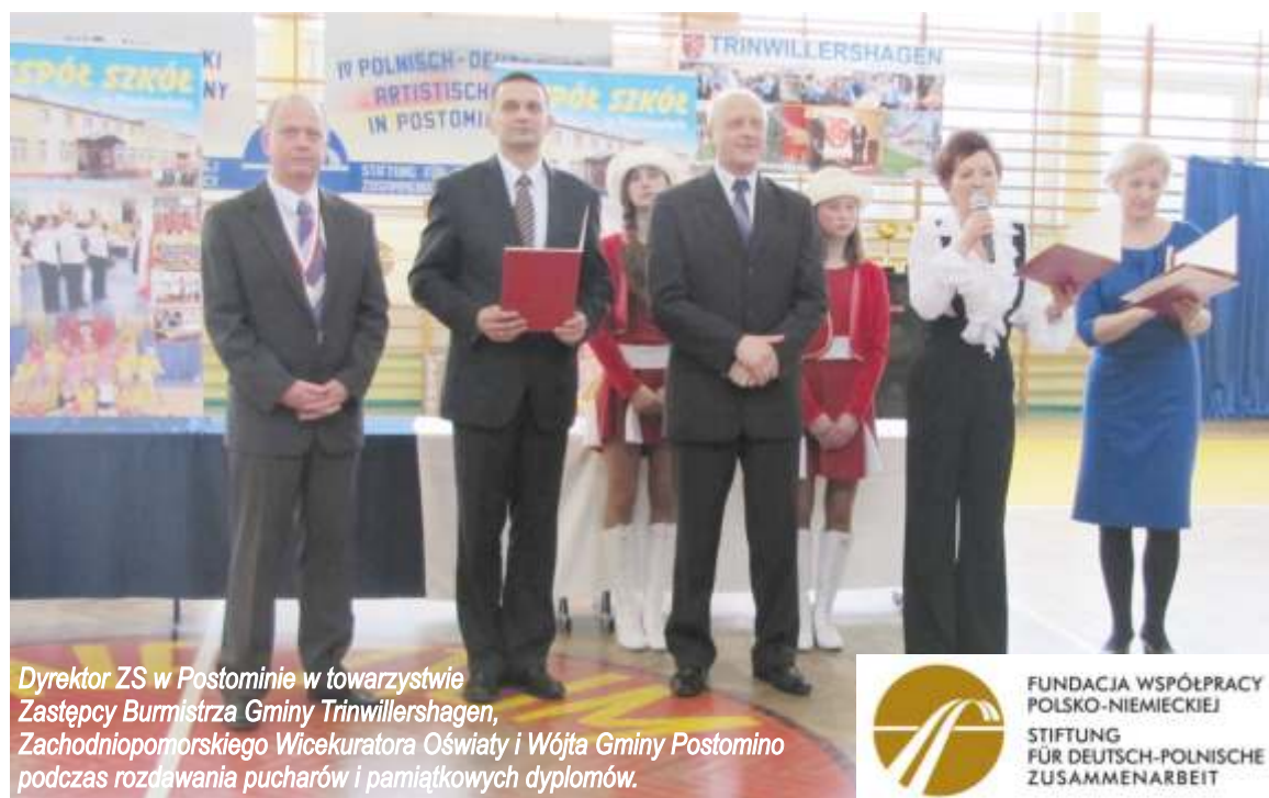
Dyrektor ZS w Postominie w towarzystwie Zastępcy Burmistrza Gminy Trinwillershagen, Zachodniopomorskiego Wicekuratora Oświaty i Wójta Gminy Postomino podczas rozdawania pucharów i pamiątkowych dyplomów.

i słowa wsparcia w trudach przygotowań do tak ogromnego przedsięwzięcia. Pani Dyrektor skierowała także słowa uznania do przybyłych licznie sympatyków tego dorocznego festiwalu. Podziękowała za ich obecność, a wszystkim opiekunom za dbałość o wysoki poziom prezentowanych przez uczniów umiejętności w wybranych konkurencjach artystycznych. Specjalne podziękowania skierowała także do swojego wspaniałego Grona Pedagogicznego oraz Pracowników Obsługi i Administracji Zespołu Szkół w Postominie, gdyż bez ich zaangażowania i wielkiego serca nie byłaby możliwa organizacja tak wielkiego przedsięwzięcia jakim jest Polsko – Niemiecki Festiwal Artystyczny.