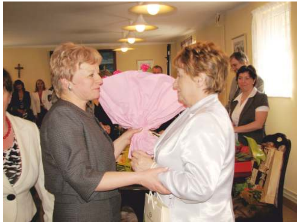
... prezesi banków...