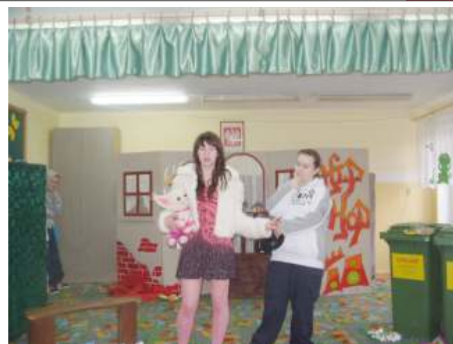
Zespół teatralny z Gimnazjum w Postominie