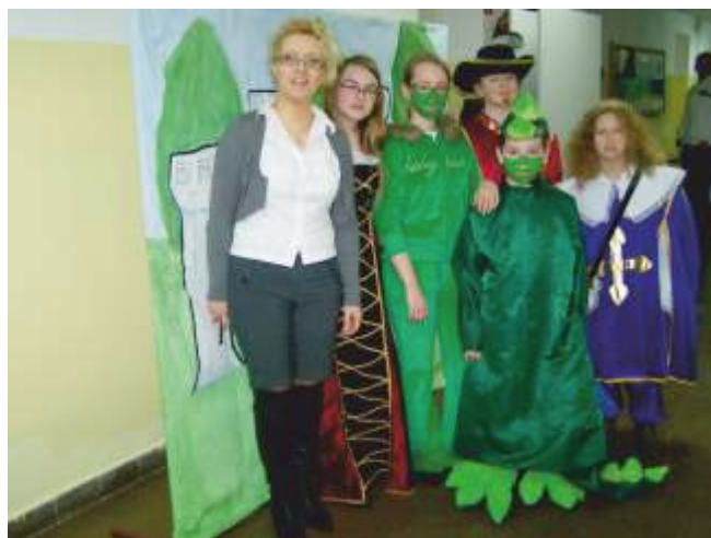
Teatr Kwadracik ze SP w Jarosławcu