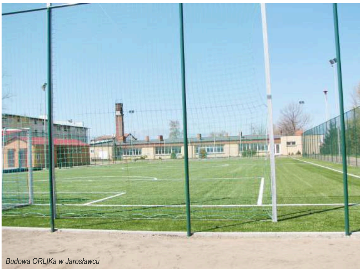
Budowa ORLIka w Jarosławcu