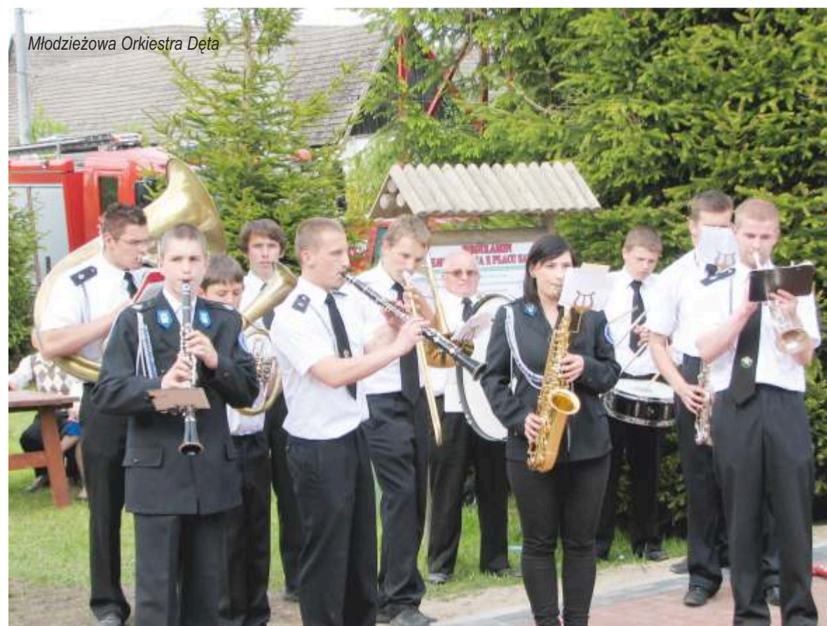
Młodzieżowa Orkiestra Dęta