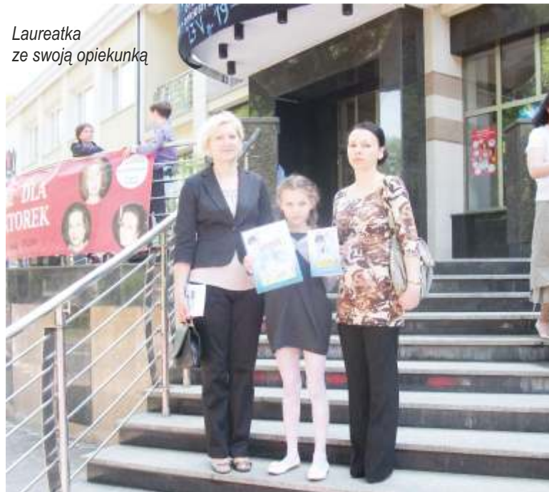
Laureatka ze swoją opiekunką