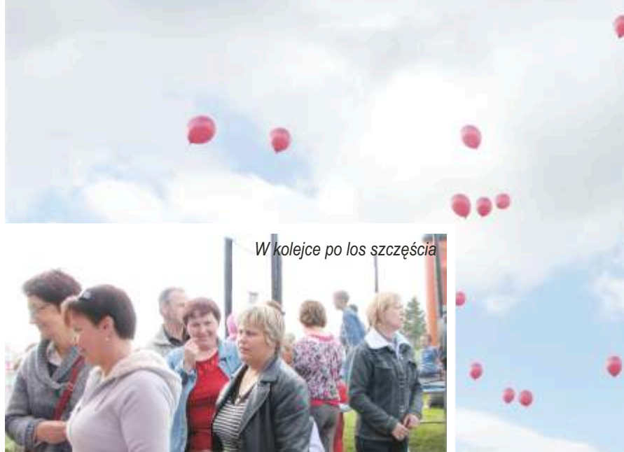
W kolejce po los szczęścia