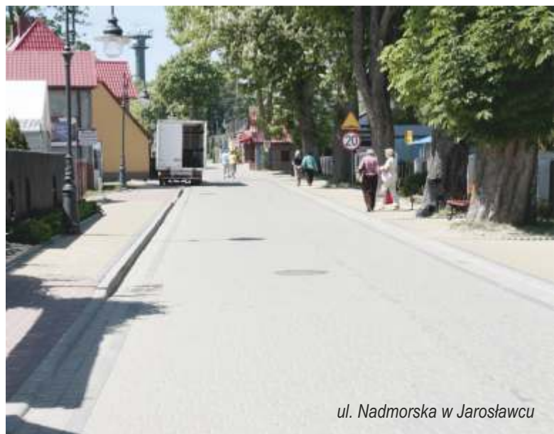
ul. Nadmorska w Jarosławcu

Investycja pod nazwą „Przebudowa ul. Nadmorskiej i Jantarowej oraz budowa ulic: Szkolnej, Krokusowej i Bzowej