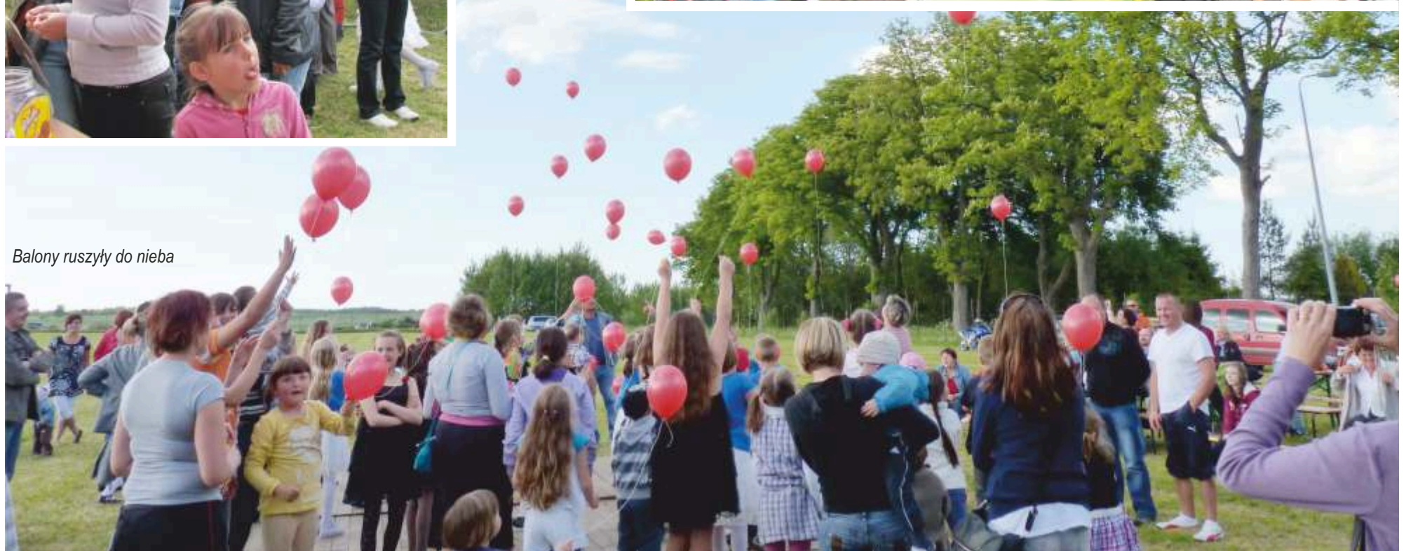
Balony ruszyły do nieba