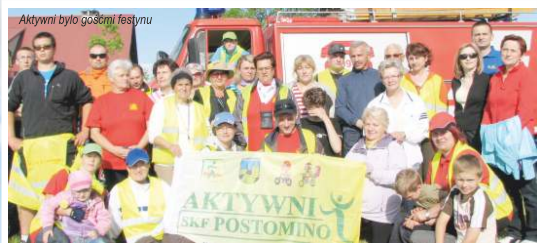
Aktywni było gośćmi festynu