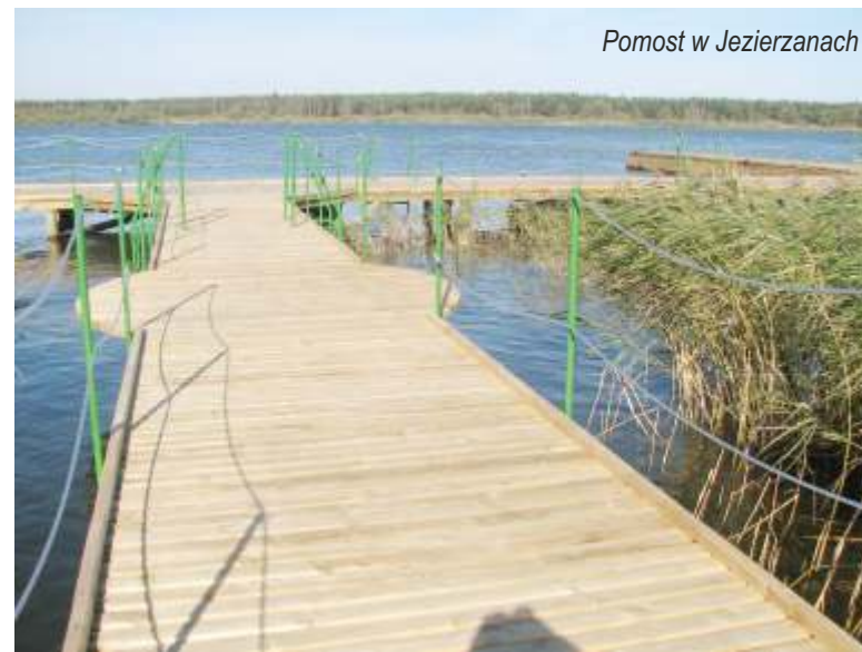
Pomost w Jezierzanach

c) dwiema oczyszczalniami ścieków wraz z przepompowniami, terenami izolacyjnymi, które zajmują teren o łącznej powierzchni 10,8214