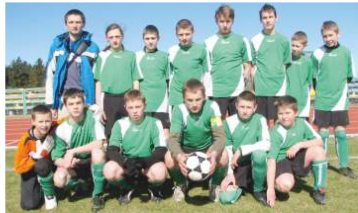
Trampkarze UKS „Wieża”