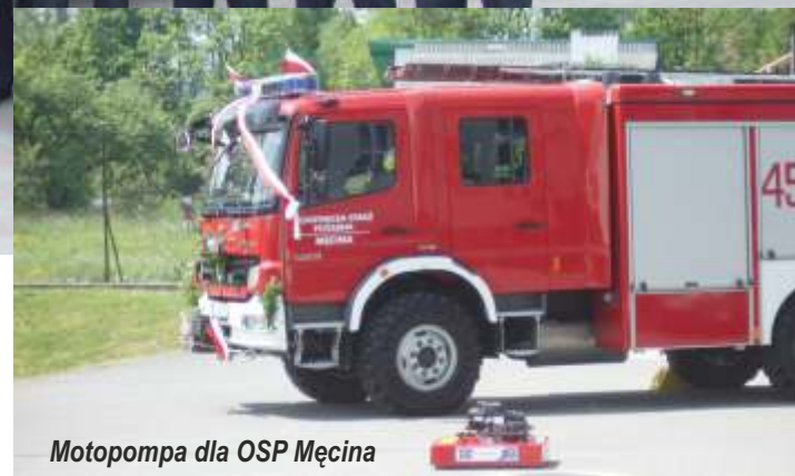
Motopompa dla OSP Męcina