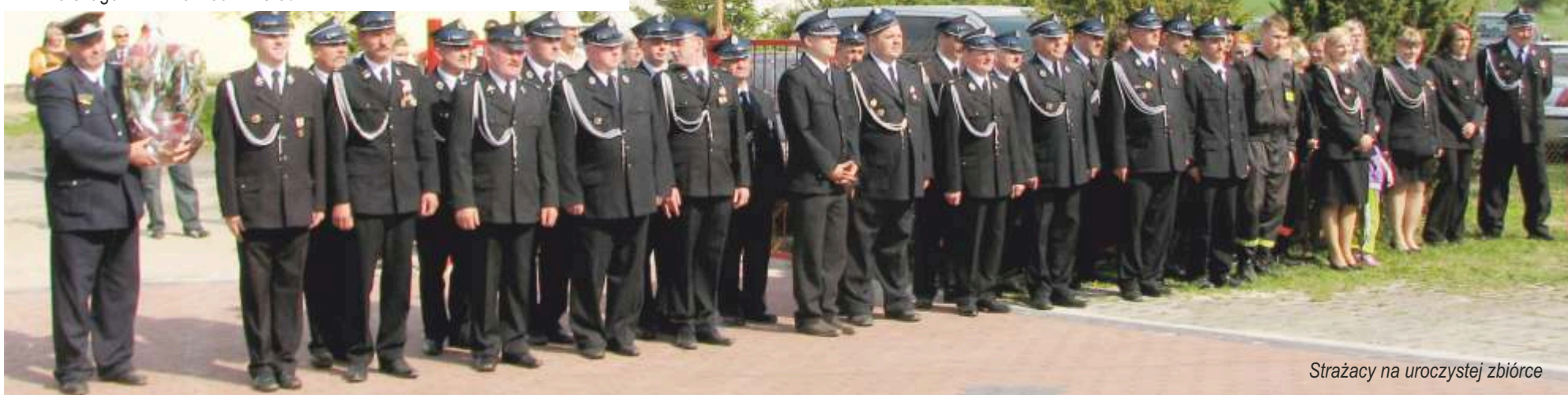
Strażacy na uroczystej zbiórce