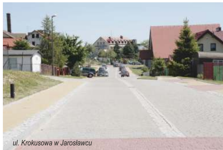
ul. Krokusowa w Jarosławcu

4) Budowę sieci kanalizacji sanitarnej z przyłączami na terenie istniejącej zabudowy w m. Łącko i modernizację stacji uzdatniania wody w m. Postomino 668 503,25 zł (została zmodernizowana stacja uzdatniania wody w m. Postomino, natomiast budowa sieci kanalizacji sanitarnej w Łącku zostanie, zgodnie z harmonogramem zakończona