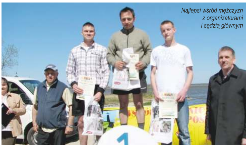
Najlepsi wśród mężczyzn z organizatorami i sędzią głównym