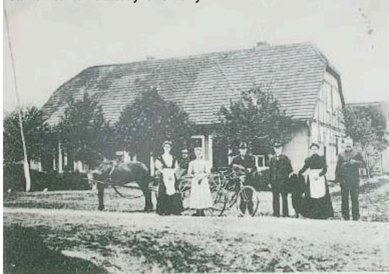
Grüß aus Sternitz