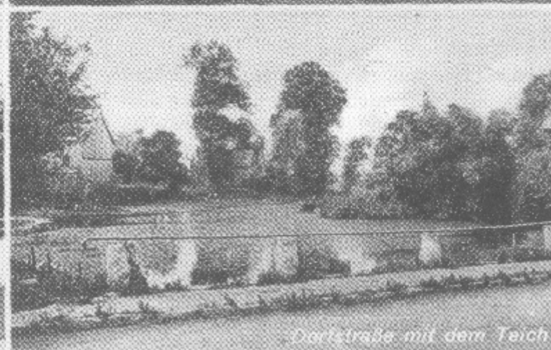
Dorfstraße mit dem Teich