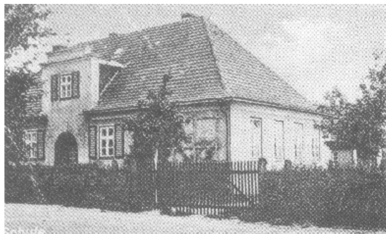
Korlino - budynek szkolny w lewej, górnej części pocztówki

W XIX wieku szkoła na wsi nie cieszyła się dużym szacunkiem. Budynek szkolny i utrzymanie nauczyciela obciążało mieszkańców wsi, dopiero w końcu wieku obowiązek