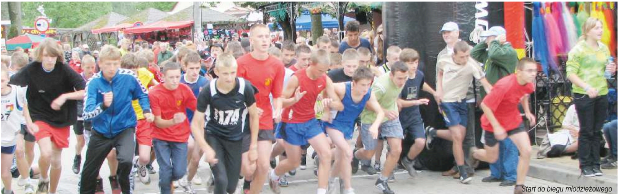
Start do biegu młodzieżowego

XXI Międzynarodowy Bieg po Plaży „Jarosławiec 2011” wraz z imprezami towarzyszącymi odbył się w dniu 3 lipca 2011 r. w Jarosławcu. W ramach imprezy rozegrano: