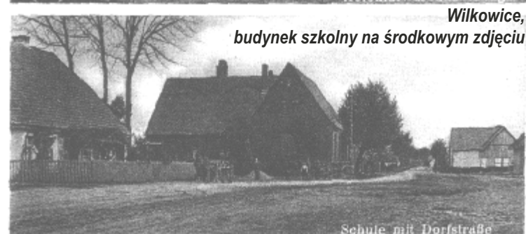
Wilkowice, budynek szkolny na środkowym zdjęciu