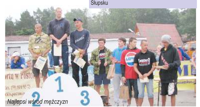
Najlepsi wśród mężczyzn

Wyniki klasyfikacji indywidualnej mężczyzn w kategorii open (1.500 m):