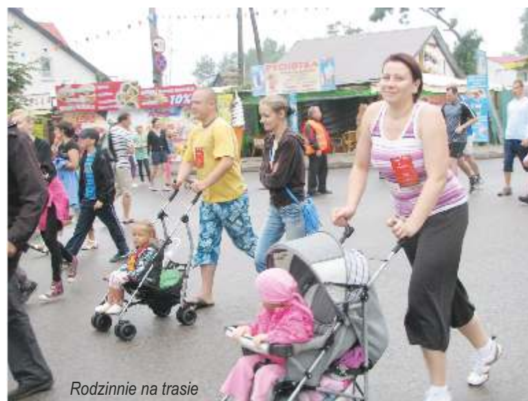
Rodzinnie na trasie