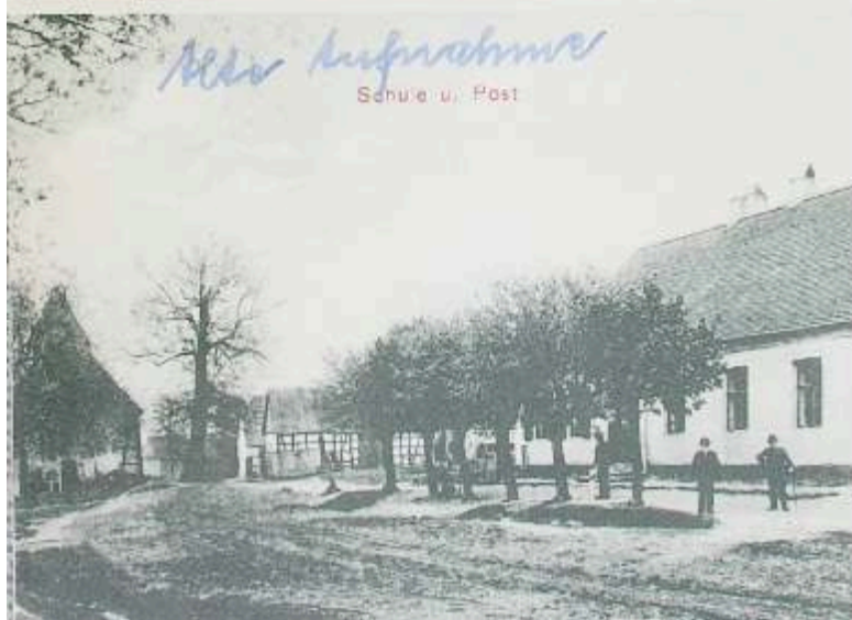
Alte Aufnahme Schule u. Post