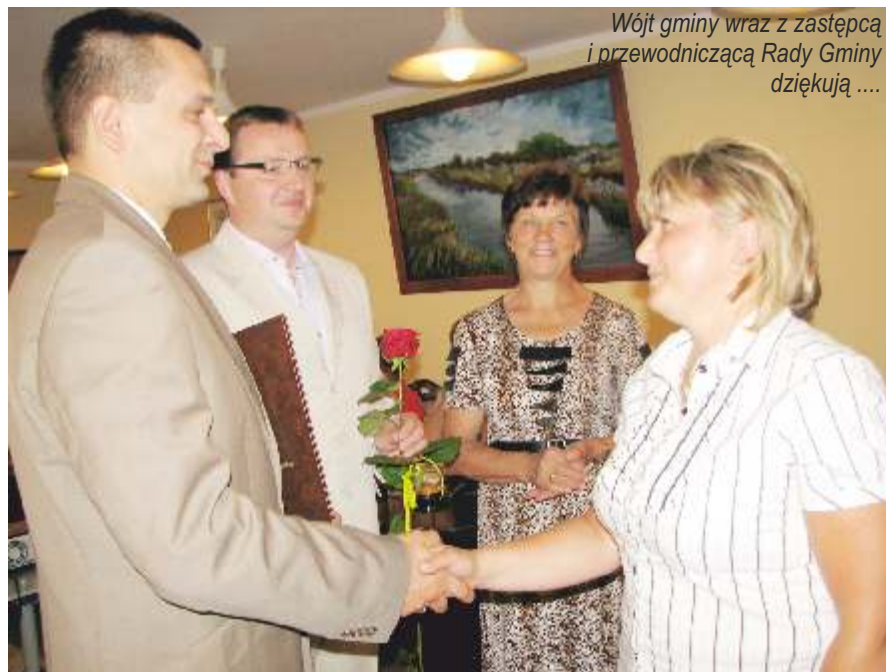
Wójt gminy wraz z zastępcą i przewodniczącą Rady Gminy dziękują ....

Projekt skierowany był do najmłodszych mieszkańców gminy i ich rodziców. Zakładał m. in. uruchomienie punktów przedszkolnych w miejscowościach Kanin, Wilkowice, Pałowie i Postomino oraz organizację cyklu warsztatów szkoleniowych dla rodziców dzieci w wieku