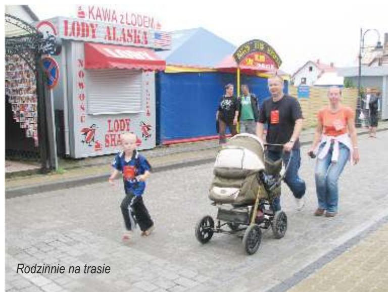
Rodzinnie na trasie