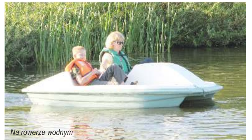
Na rowerze wodnym