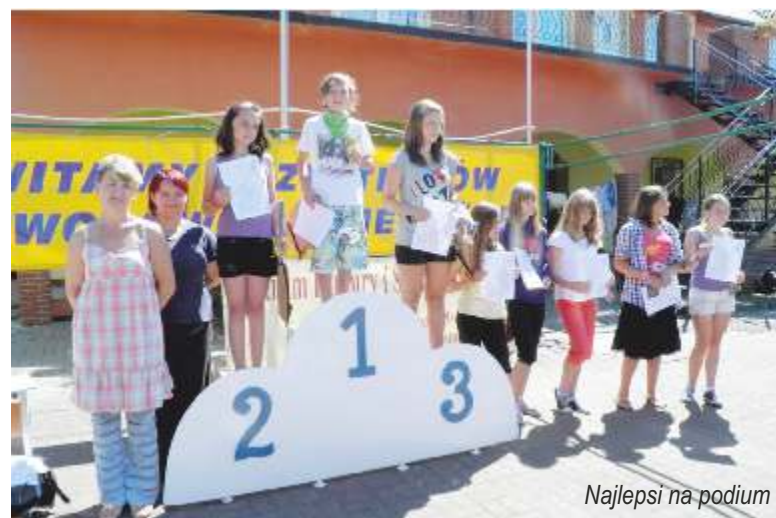
Najlepsi na podium

Na letniej scenie przy Punkcie Informacji Turystycznej po południu zostały rozdane Puchary Wójta Gminy Postomino, nagrody oraz dyplomy najlepszym uczestnikom.