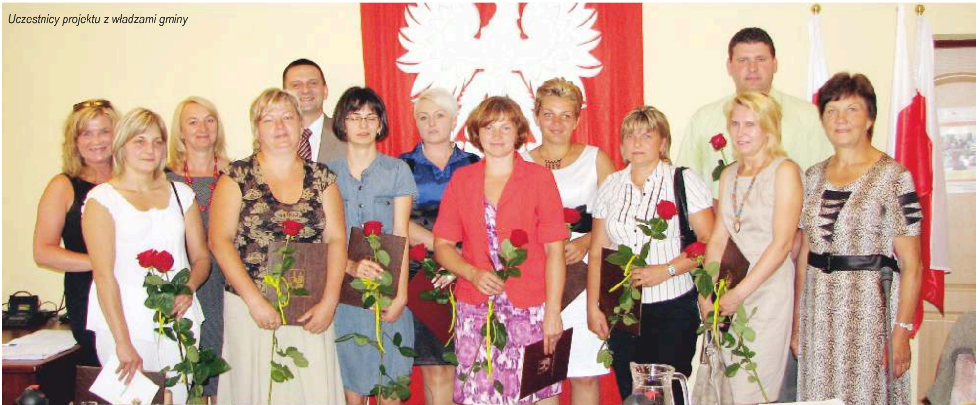
Uczestnicy projektu z władzami gminy