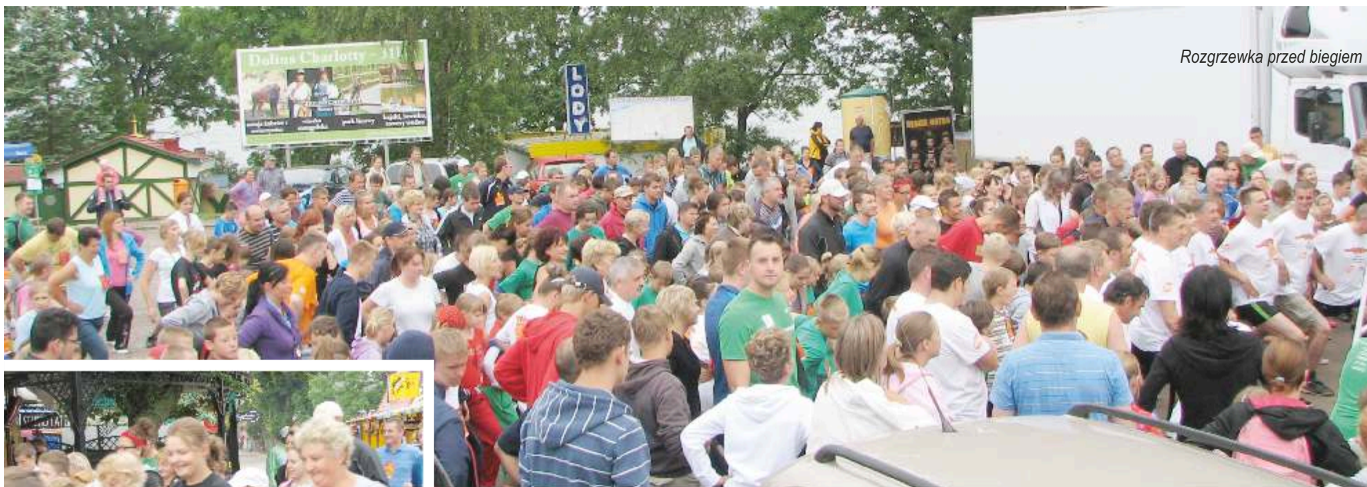
Rozgrzewka przed biegiem