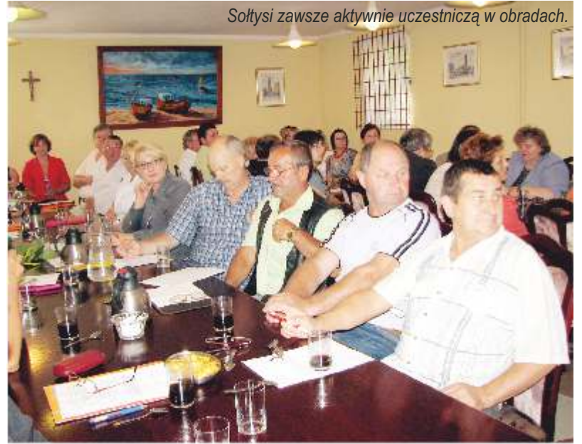
Sołtysi zawsze aktywnie uczestniczą w obradach.