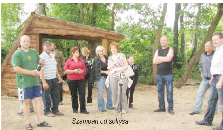
Szampa od sołtysa