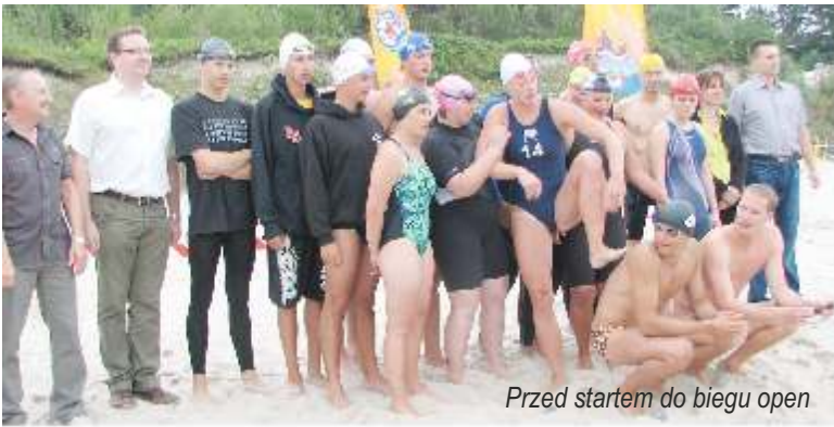
Przed startem do biegu open

Przez silnie wzburzone morze i przejście burzy nad Jarosławcem w chwili rozpoczęcia zawodów pływackich „Klif Jarosławca 2011” w dniu 21 lipca br., organizator zdecydował by przenieść zawody na dzień 27 lipca 2011 r. (środa). Tego dnia morze było spokojne, lekko falowało, tylko w oddali widać było burzowe chmury.