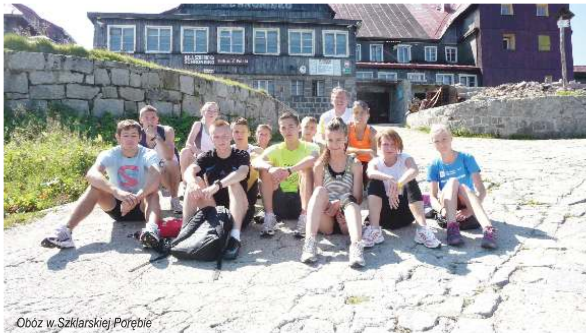
Obóz w Szklarskiej Porębie