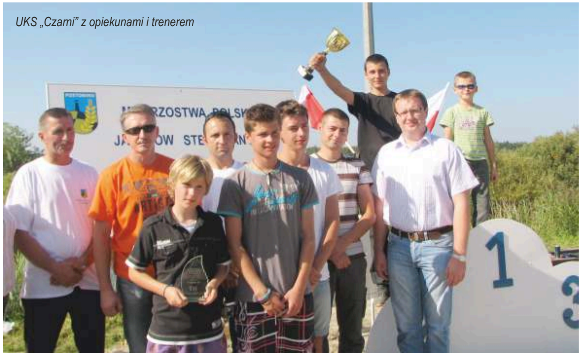
UKS „Czarni” z opiekunami i trenerem