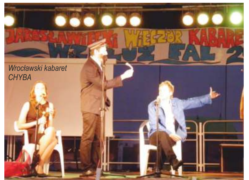
Wrocławski kabaret CHYBA