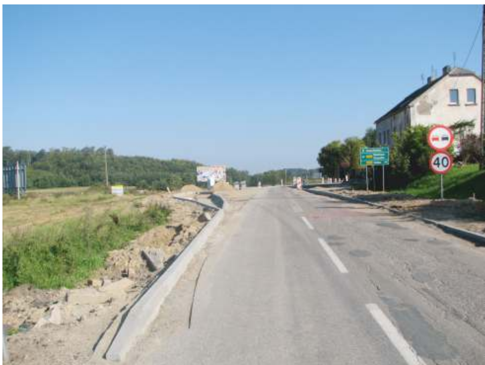
Budowa ronda w miejscowości Kanin wykonuje województwo (dofinansowanie przez gminę)