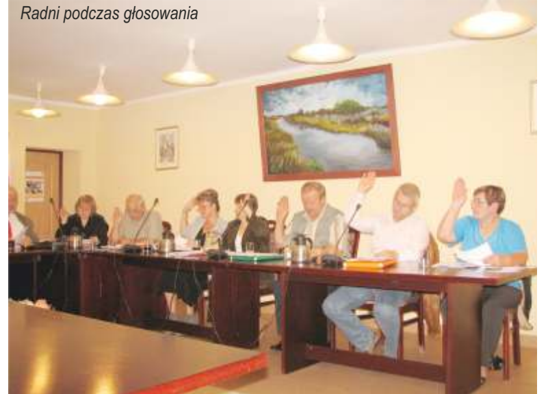
Radni podczas głosowania

chodników w ciągu drogi powiatowej nr 0538 i 0541Z zadania 174 000,00 zł. w miejscowości Staniewice” – koszt