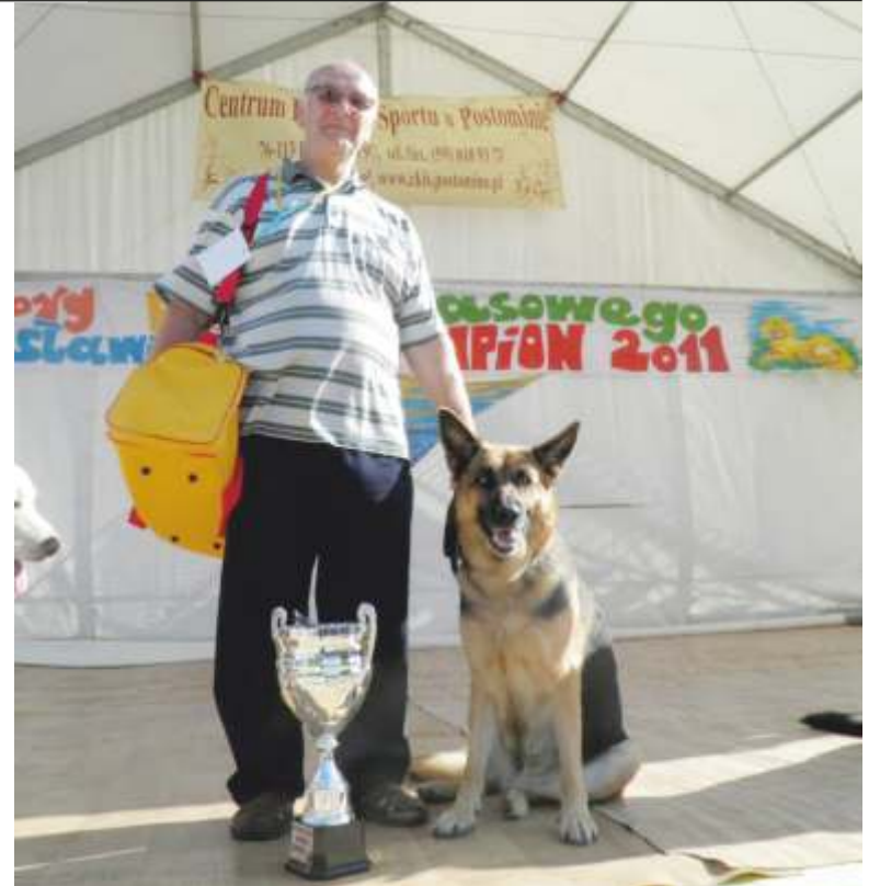
DESA ze swoim pucharem

Serdeczne podziękowania za pomoc w realizacji przedsięwzięcia