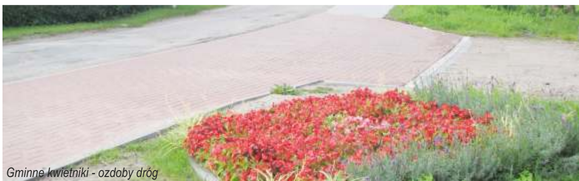
Gminne kwietniki - ozdoby dróg