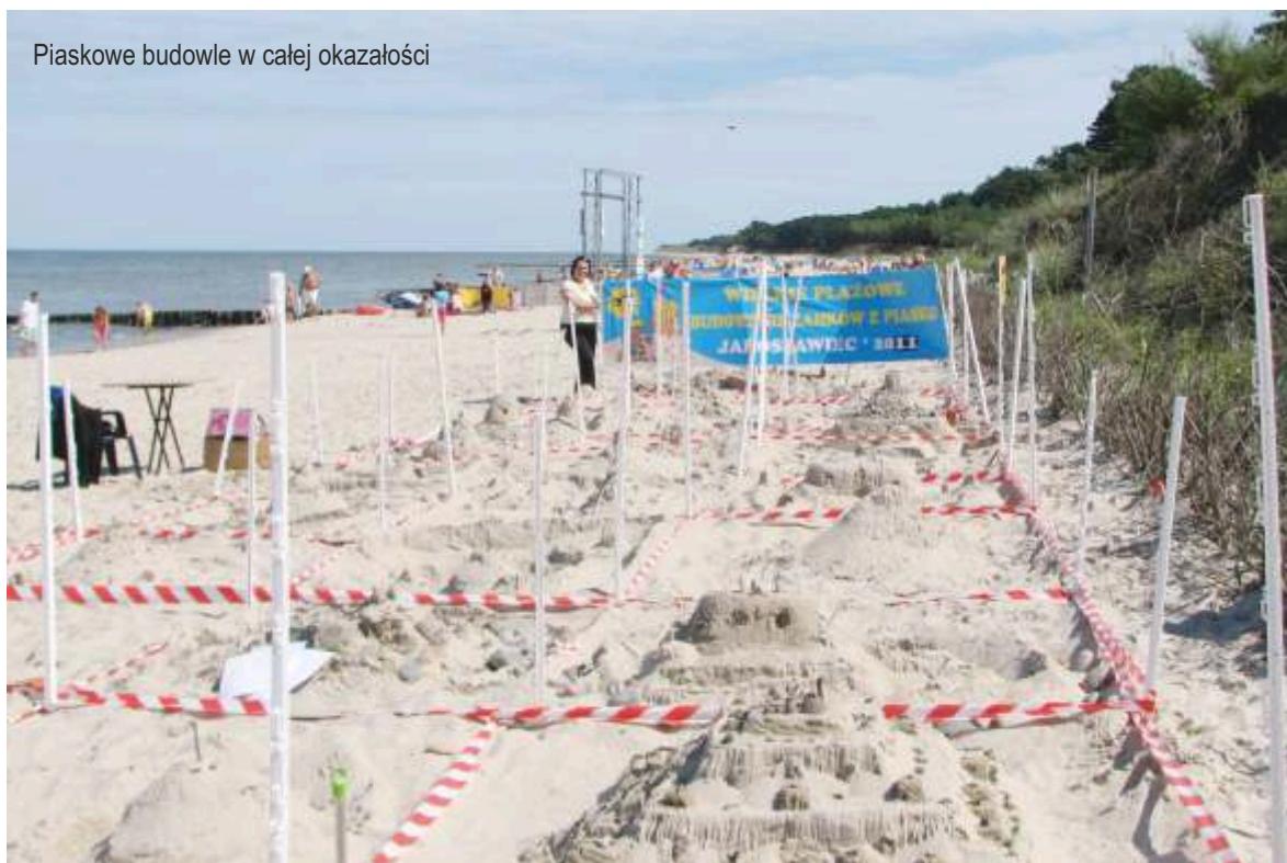
Piaskowe budowle w całej okazałości