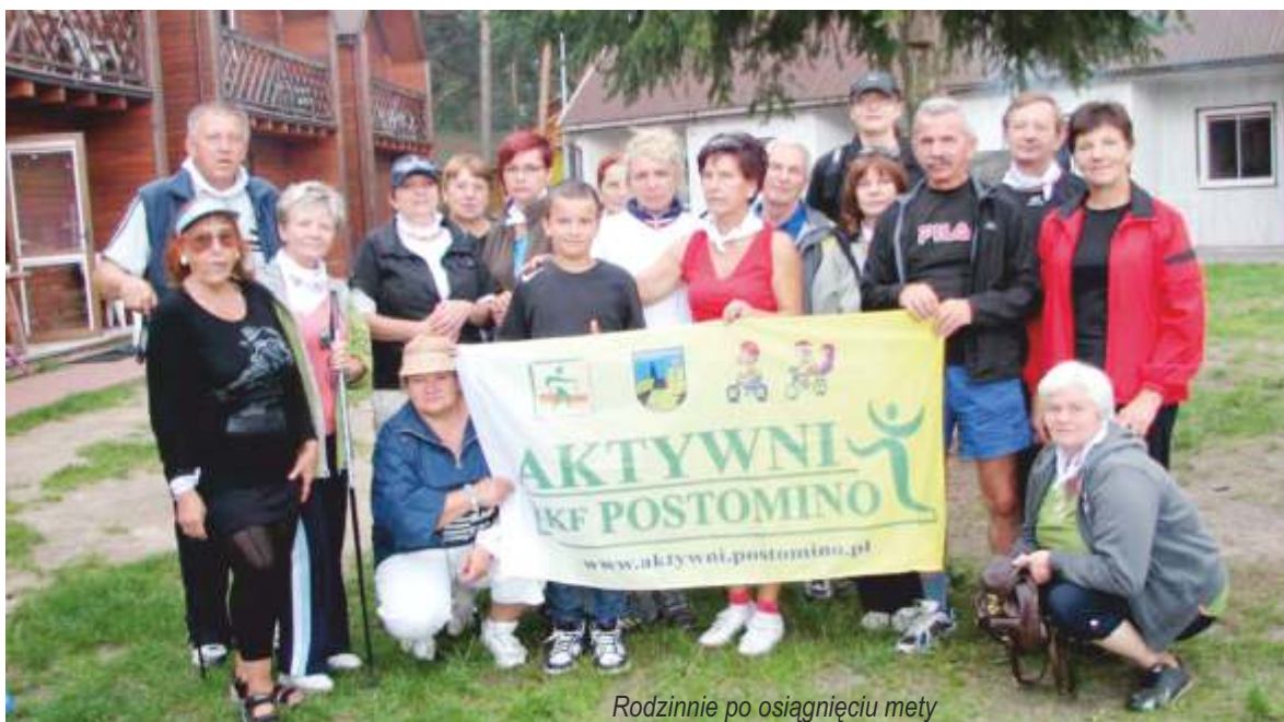
Rodzinnie po osiągnięciu mety

Inaczej niż zwykle spędzić ostatnie wakacyjne, niedzielne popołudnie zdecydowało się ponad 20 uczestników Rajdu Nordic Walking „Ekologiczne, spacerowe jodowanie sposobem na zdrowie”.