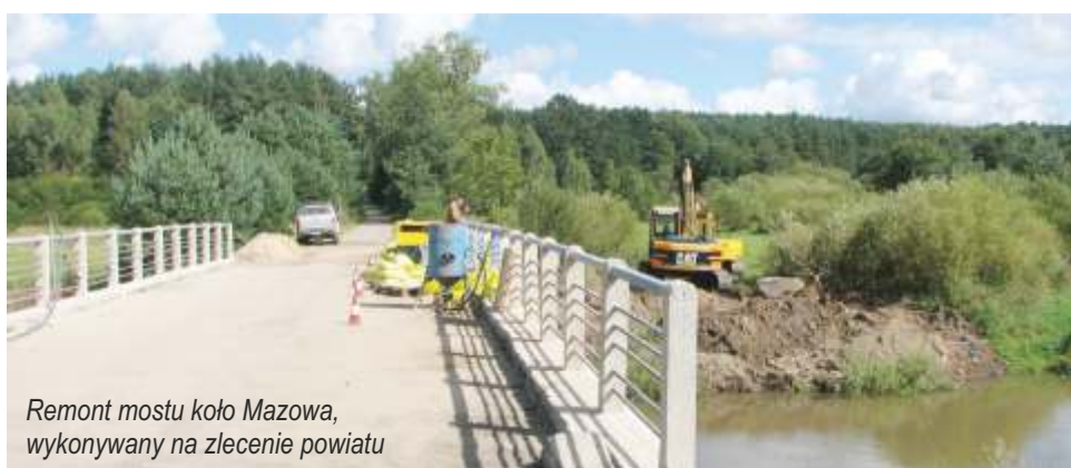
Remont mostu koło Mazowa, wykonywany na zlecenie powiatu