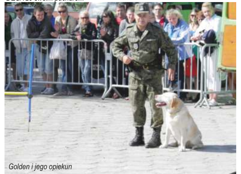
Golden i jego opiekun

kierowane są do sponsorów i współorganizatorów, a są nimi: