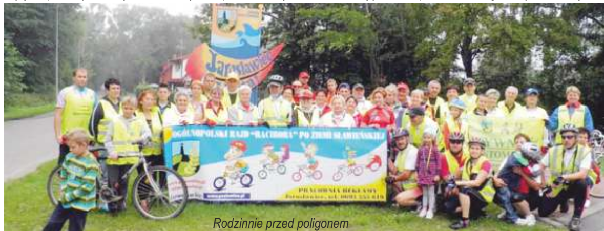
Rodzinnie przed poligonem

W Wiciu – „lody dla ochłody” i dalej duktem leśnym dotarliśmy do pasa startowego. Stąd do Pensjonatu