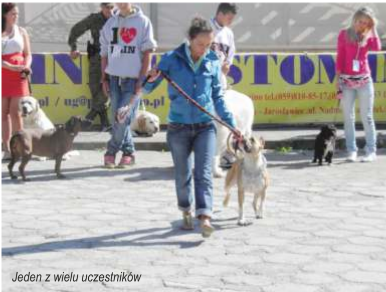
Jeden z wielu uczestników

Na parkingu jarostawieckiej skarpy brzegowego klifu w sobotę, 20 sierpnia 2011 r. w trzech kategoriach wiekowych: