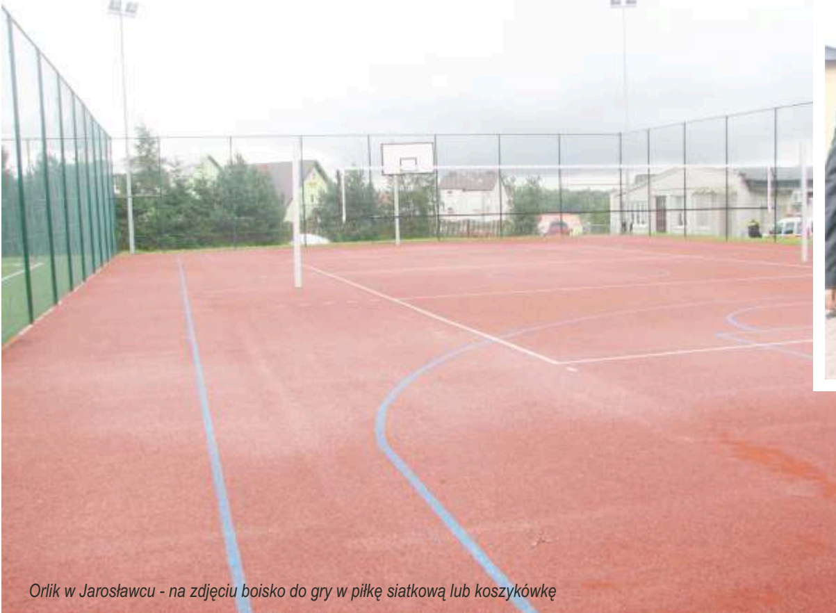
Orlik w Jarosławcu - na zdjęciu boisko do gry w piłkę siatkową lub koszykówkę