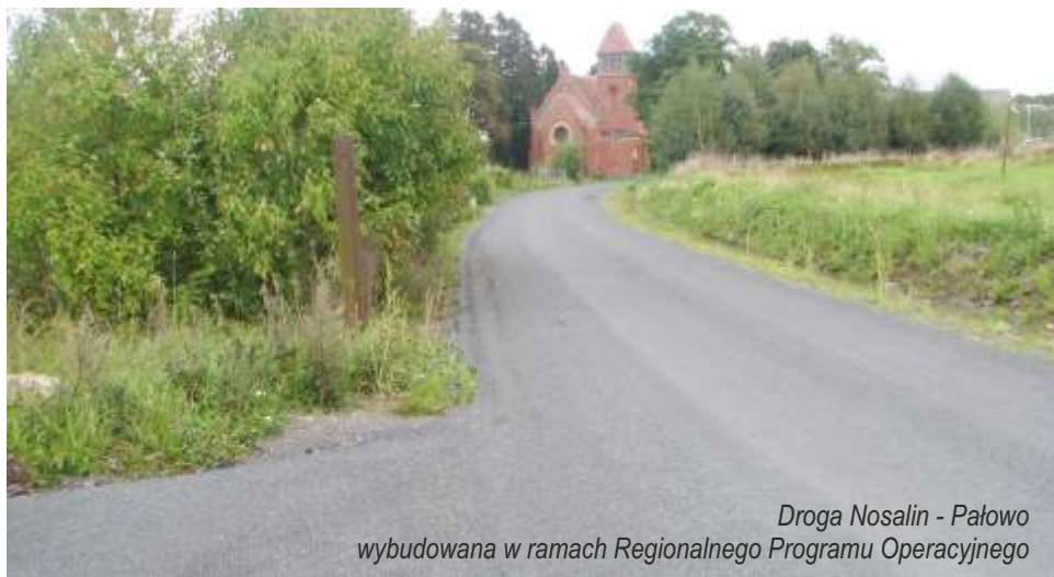
Droga Nosalin - Pałowo wybudowana w ramach Regionalnego Programu Operacyjnego