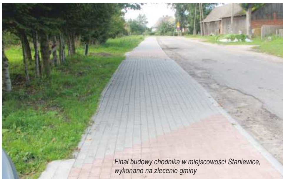
Finał budowy chodnika w miejscowości Staniewice, wykonano na zlecenie gminy