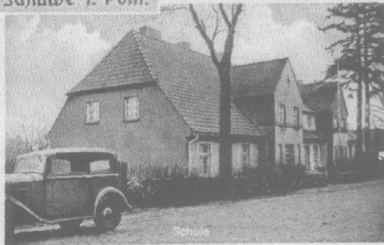
Pennekow, Krs. Schlawe i. Pom.