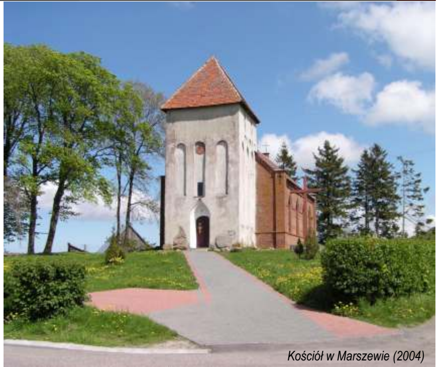
Kościół w Marszewie (2004)

Kościół w Pieńkowie znajduje się w środku wsi. Zbudowany został w XVII stuleciu - do starszej XV-