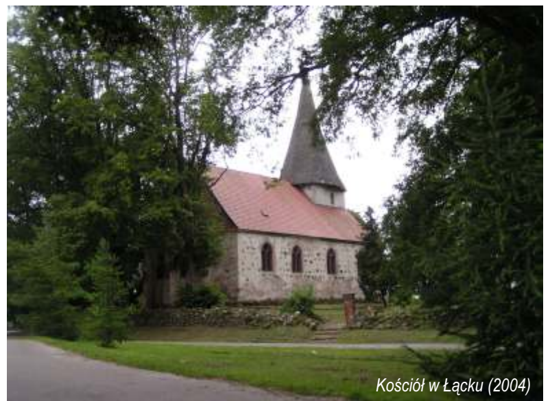
Kościół w Łącku (2004)