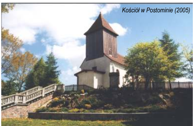
Kościół w Postominie (2005)

Pierwszy kościół w Postominie istniał już prawdopodobnie w średniowieczu. Obecny zbudowany został w XIX wieku (1882) na miejscu poprzedniego, który uległ zniszczeniu w pożarze. Kościół zbudowany jest w stylu neobarokowym bez wyodrębnienia prezbiterium. Wieża nadbudowana jest na nawie kościoła.