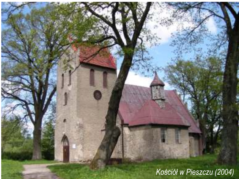
Kościół w Pieszcu (2004)

przebudowano. Na wyposażeniu kościoła przed 1945 rokiem znajdował się m. in.: stół chrzcielny z końca XVII wieku, chrzcielnica ufundowana przez Jürgena Pagela i Jacoba Schwalewa w 1684 roku, dwa cynowe świeczniki ufundowane w połowie XVII wieku przez pastora Seidendorfa, figura Marii, obraz olejny Chrystusa z początku XVIII wieku, srebrny kielich, krucyfiks z XVII wieku, świeczniki w kształcie korony z 1685 roku, dzwon z obrazem ukrzyżowanego oraz dzwon z 1776 roku odlany w Sławnie przez J. M. Meyera.