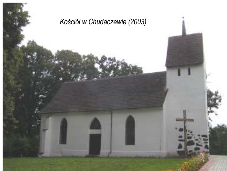
Kościół w Chudaczewie (2003)

Kościół w Marszewie zbudowany został w XIV stuleciu. Z tego okresu z pewnością pochodzi wieża. Korpus przebudowany został w 1863 roku. Świątynia usytuowana