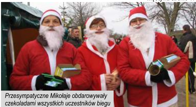
Przesympatyczne Mikołaje obdarowywały czekoladami wszystkich uczestników biegu