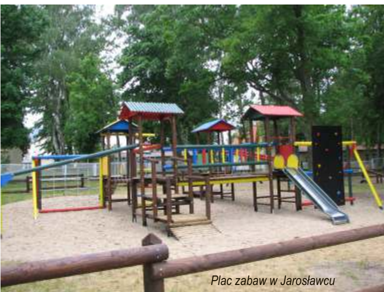
Plac zabaw w Jarosławcu

13. Zakończono budowę chodnika w m. Staniewice, co bardzo podniosło estetykę tej miejscowości, szczególnie z pięknie zagospodarowanymi klombami kwiatowymi.