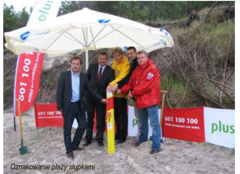
Oznakowanie plaży słupkami

10. Wyremontowano świetlicę wiejską w Masłowicach oraz zakupiono nowe wyposażenie. Remont polegał na wymianie zniszczonych okien