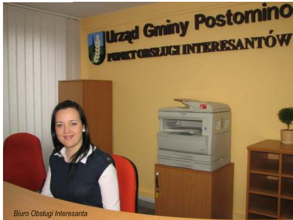
Biuro Obsługi Interesanta