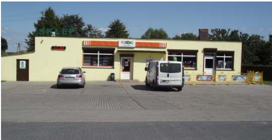
Sklep abc w Staniewicach, przy głównej trasie Postomino - Sławno.

Serdecznie zapraszamy w dniach 10-02-2012, a 04-04-2012 do wzięcia udziału w Super Konkursie „ABC STANIEWICE - Dobry Wybór” w którym do wygrania wiele atrakcyjnych nagród.