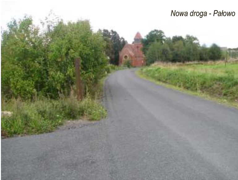
Nowa droga - Pałowo

sanitaro-szatniowym) w Postominie. Koszt realizacji: 1.069.929,94 zł.