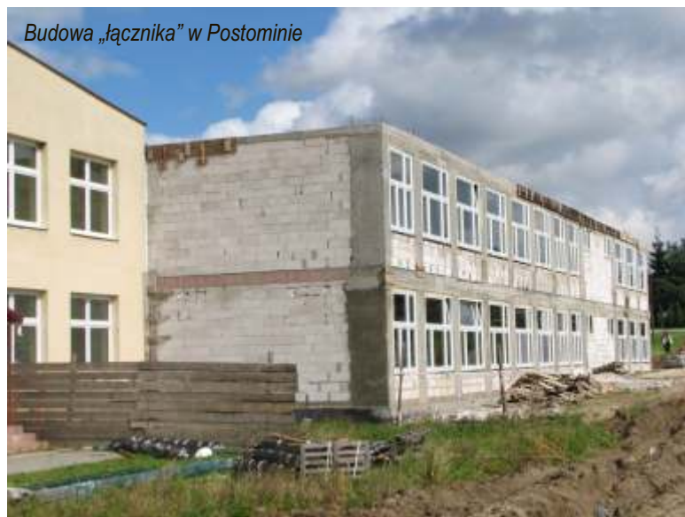
Budowa „łącznika” w Postominie

3. Usprawniono system gospodarki odpadami na terenie Gminy Postomino poprzez zakup pojazdu do transportu wyselekcjonowanych odpadów oraz pojemników do ich zbiórki. W ramach projektu zakupiono 61 pojemników do selektywnej zbiórki odpadów (pojemniki na szkło, plastik, pojemniki na odpady biodegradowalne, kontenery na odpady wielkogabarytowe, kontenery na