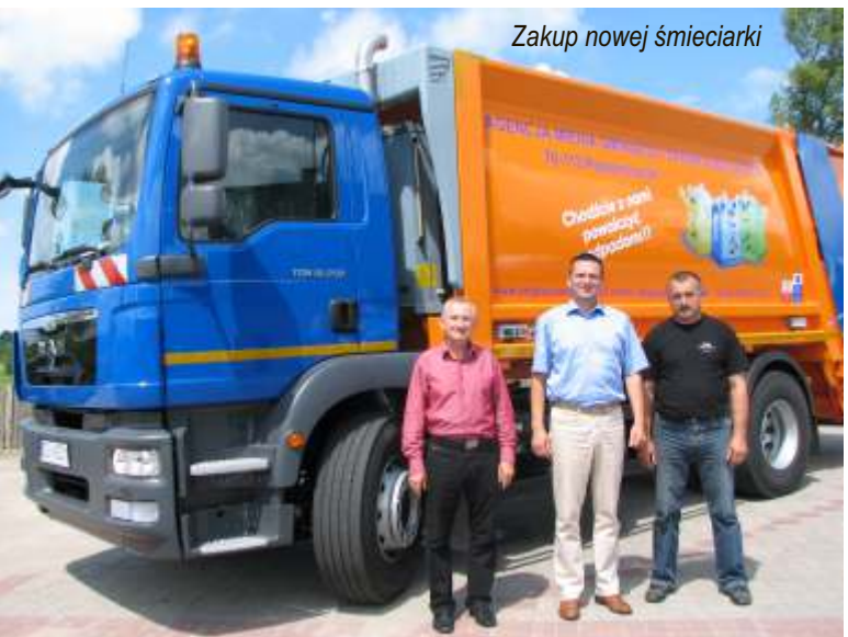
Zakup nowej śmieciarki

5. Oddano do użytkowania kompleks obiektów sportowych przy Zespole Szkół w Jarosławcu - boisko piłkarskie Orlik oraz boisko wielofunkcyjne a także zagospodarowano teren pomiędzy szkołą a boiskiem za kwotę 952.577,94 zł.