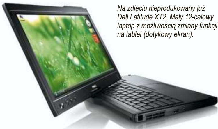
Na zdjęciu nieprodukowany już Dell Latitude XT2. Mały 12-calowy laptop z możliwością zmiany funkcji na tablet (dotykowy ekran).

Sprzedaż laptopów w ostatnim roku utrzymywała się na stabilnym poziomie. Gwałtowne wzrosty w tym segmencie zahamowało spore nasycenie rynku sprzętem. Analitycy z serwisu Ceneo.pl sprawdzili, które modele laptopów cieszą się największą popularnością wśród kupujących. W serwisie Ceneo.pl można znaleźć niemalże 3 tys. modeli laptopów. Aż 20% kupujących wybiera notebook marki Samsung.