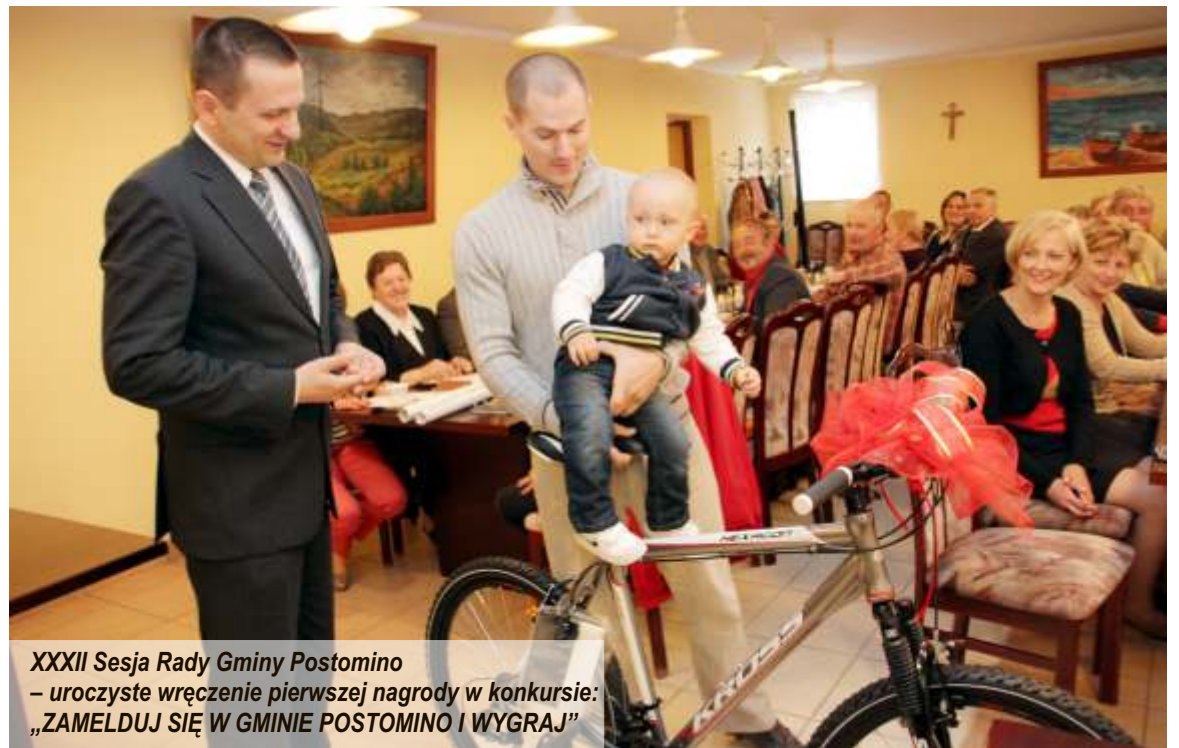
XXXII Sesja Rady Gminy Postomino – uroczyste wręczenie pierwszej nagrody w konkursie: „ZAMELNUJ SIĘ W GMINIE POSTOMINO I WYGRAJ”

Gratulujemy wygranej. Zachęcamy do wzięcia udziału w konkursie i tym samym zwiększenia liczby osób meldujących się na pobyt stały w Gminie Postomino. Do wygrania został Tablet Samsung Galaxy oraz nagroda główna Telewizor 3D LG Smart 47lm620S. Kolejne losowanie już 23 sierpnia 2013 roku.