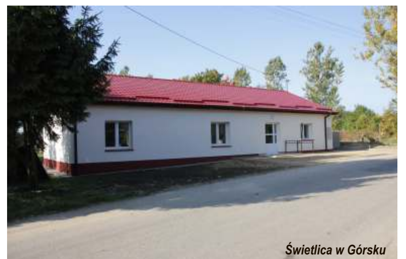
Świetlica w Górsku