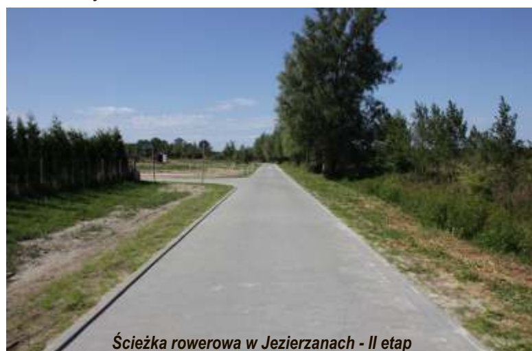
Ścieżka rowerowa w Jezierzanach - II etap

Nowo wybudowana, doskonale prezentująca się remiza OSP wraz ze świetlicą wiejską zdoła miejscowość Marszewo . Koszt robót budowlanych wraz z nadzorem inwestorskim wyniósł