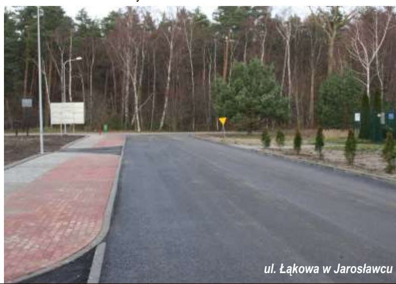
ul. Łąkowa w Jarosławcu