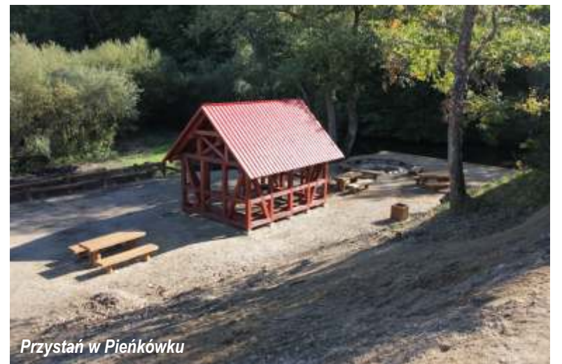
Przystań w Pieńkówku

podpisana umowa na 75 % dofinansowanie inwestycji pn. „Budowa sieci wodociągowej w miejscowości Pieszcz” . Koszt ryczałtowy budowy sieci wodociągowej wynosi 332.997,90 zł. Termin zakończenia inwestycji wyznaczono na 28 czerwca 2014 r.