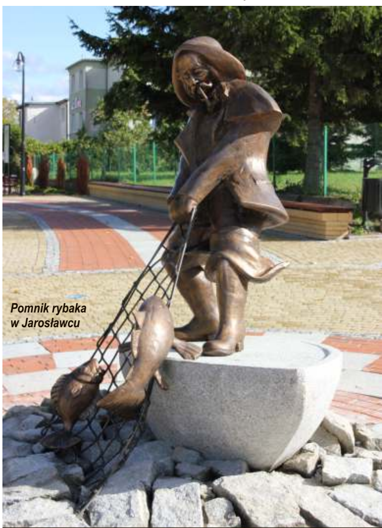
Pomnik rybaka w Jarosławcu

Działania gminy Postomino przynoszą widoczne rezultaty i wpływają na wzrost klasyfikacji naszej gminy w rankingach. W IX edycji rankingu samorządów ogłoszonym przez dziennik „Rzeczpospolita” Gmina Postomino sklasyfikowana została na 3 miejscu wśród gmin wiejskich w Województwie Zachodniopomorskim. W kraju na ponad 1500 gmin wiejskich Gmina Postomino uplasowała się na 18 miejscu, co oznacza, że jej pozycja w stosunku do roku ubiegłego wzrosła o 26 miejsc – w roku 2012 zajmowała 44 miejsce.