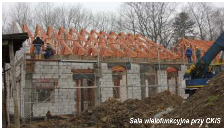
Sala wielofunkcyjna przy CKiS

Zadanie zostało dofinansowane kwotą 72.734 zł, z budżetu Fundacji Partnerstwo Dorzecze Słupi przeznaczonego na wdrażanie Lokalnej Strategii Rozwoju w ramach Programu Rozwoju Obszarów Wiejskich na lata 2007-2013 w ramach działania: „Odnowa i rozwój wsi”, natomiast całkowita wartość projektu wyniosła 112.945,17 zł.