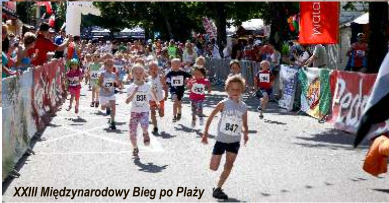
XXIII Międzynarodowy Bieg po Plaży