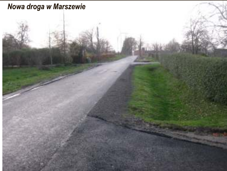
Nowa droga w Marszewie

Zrealizowano projekt pn. „ Budowa wiaty rekreacyjnej w miejscowości Postomino ” z dofinansowaniem w kwocie 24.999 zł z budżetu Fundacji Partnerstwo Dorzecze Słupi przeznaczonego na wdrażanie Lokalnej Strategii Rozwoju w ramach Programu Rozwoju Obszarów Wiejskich na lata 2007-2013 z zakresu małych projektów. Całkowita