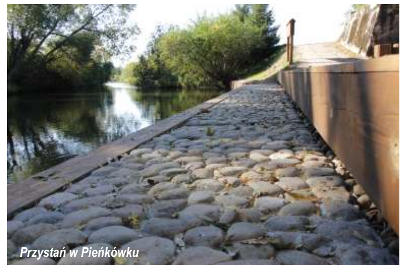
Przystań w Pieńkówku

W ramach działania 321 „Podstawowe usługi dla gospodarki i ludności wiejskiej” objętego Programem Rozwoju Obszarów Wiejskich na lata 2007-2013 w zakresie gospodarki wodno - ściekowej została