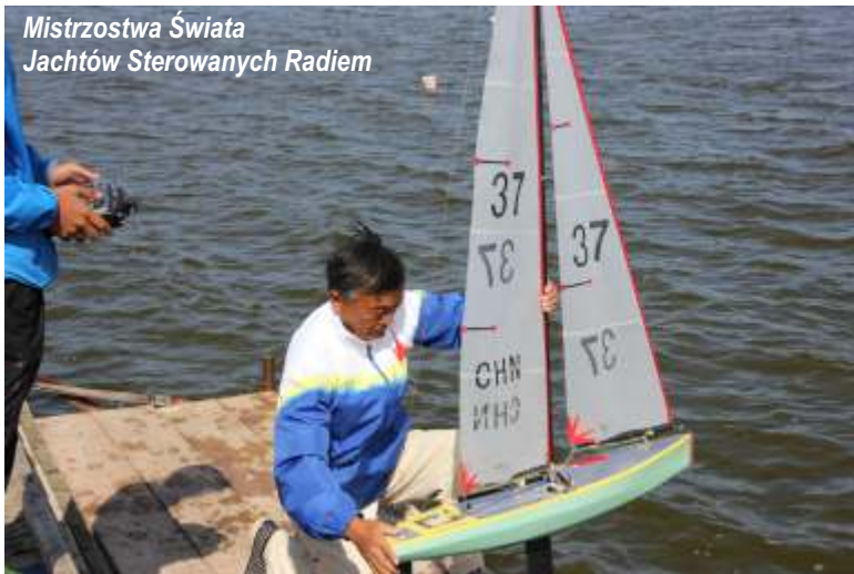
Mistrzostwa Świata Jachtów Sterowanych Radiem

Od 1 lipca 2013 r. na terenie gminy Postomino zaczął obowiązywać nowy system gospodarowania odpadami . Obecnie to gmina organizuje odbiór odpadów komunalnych od mieszkańców, którzy składają deklarację o wysokości opłaty za gospodarowanie odpadami komunalnymi z nieruchomości. Złożonych zostało ok. 2000 deklaracji, z czego aż 95% zadeklarowało selektywną zbiórkę. Do odbioru odpadów komunalnych zmieszanych i zbieranych w sposób selektywny z nieruchomości zamieszkałych, zostało wyłonione, w drodze przetargu, Gminne Przedsiębiorstwo Komunalne Sp. z o.o. w Postominie.