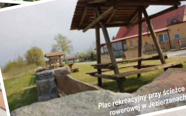
Plac rekreacyjny przy ścieżce rowerowej w Jezierzanach