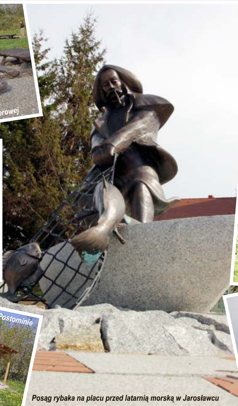
Posąg rybaka na placu przed latarnią morską w Jarosławcu