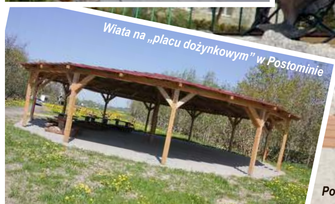
Wiata na „placu dożynkowym” w Postominie