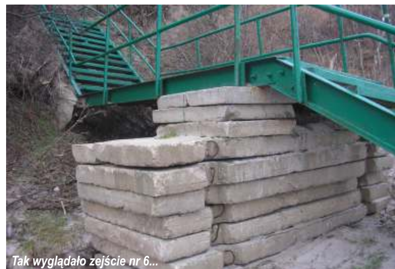
Tak wyglądało zejście nr 6...