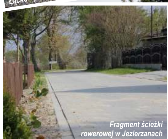
Fragment ścieżki rowerowej w Jezierzanach