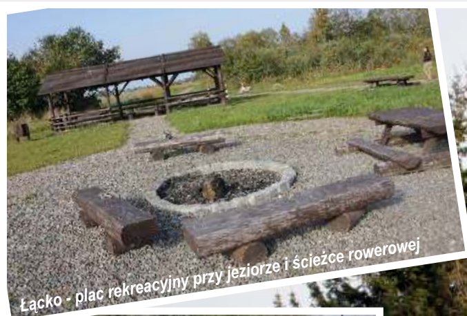
Łącko - plac rekreacyjny przy jeziorze i ścieżce rowerowej