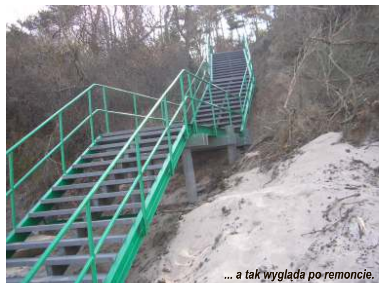
... a tak wygląda po remoncie.

W marcu br. wykonano remont zejścia na plażę nr 6 w m. Jarosławiec. Prace polegały na wzmocnieniu konstrukcji stalowej zejścia sześcioma palami z tworzyw sztucznych o nazwie Hanit oraz wymianie drewnianych stopni również na stopnie z tworzywa sztucznego.