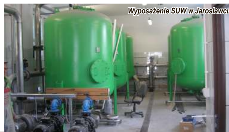
Wyposażenie SUW w Jarosławcu