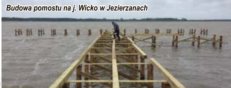
Budowa pomostu na j. Wicko w Jezierzanach

Budowę sieci wodociągowej zrealizowano na długości 446,7 mb z rur ciśnieniowych wyposażonych w zasuwę odcinającą, hydranty naziemne w zasuwami odcinającymi i studniami odcinającymi. Przyłącza wykonano z rur PE na długości ogółem – 196,1 mb.