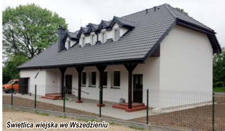
Świetlica wiejska we Wszedzieniu

W najbliższym czasie będą realizowane takie przedsięwzięcia jak: