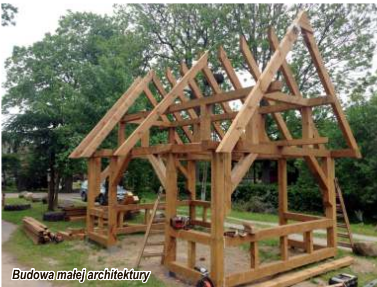
Budowa małej architektury

studni głębinowych z montażem obudów studziennych naziemnych ze studni do SUW, wymianie całej instalacji technologicznej wraz z instalacją elektryczną i sterowniczą oraz wewnętrznej instalacji wod-kan. Zmodernizowano dwa obiekty, tj. budynek SUW (stacji uzdatniania wody) i budynek techniczny (agregatorownię). Wyposażenie stacji objęło również