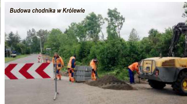
Budowa chodnika w Królewio

„Budowa obiektów małej architektury w miejscowości Postomino” oraz wykonanie nawierzchni poliuretanowej oraz trawiastej pod plac zabaw w miejscowości Jarosławiec oraz dostawa i montaż wyposażenia placu w ramach projektu pn. „Modernizacja oddziałów przedszkolnych, czyli likwidacja barier w dostępie do edukacji przedszkolnej na terenie Gminy Postomino”.