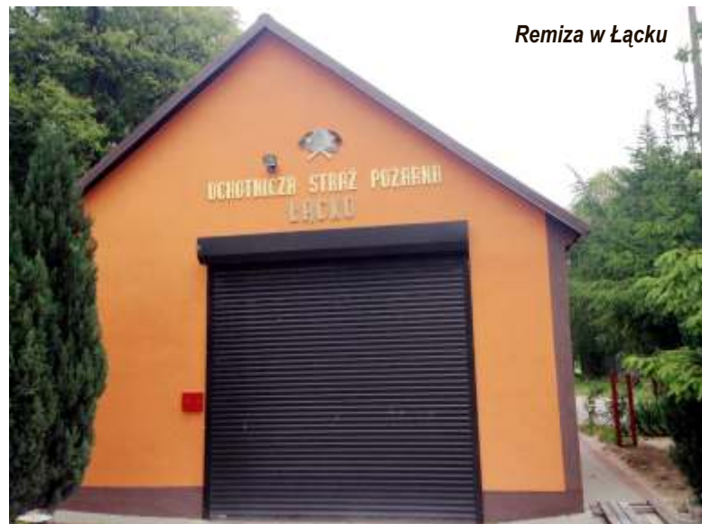
Remiza w Łącku

montaż dwóch wolnostojących, ocieplonych zbiorników retencyjnych wody czystej o pojemności 150 m 3 każdy, zapewniające zapas wody na wyrównanie zwiększonych chwilowych rozbiorów wody.