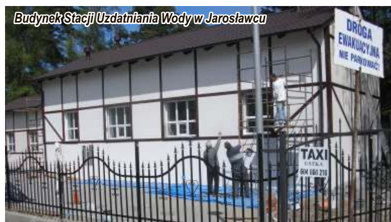
Budynek Stacji Uzdatniania Wody w Jarosławcu