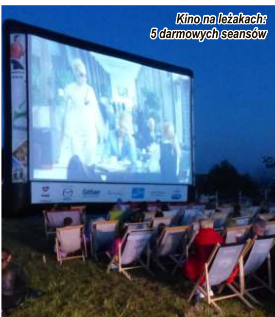
Kino na leżakach: 5 darmowych seansów