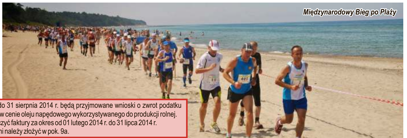
Międzynarodowy Bieg po Plaży