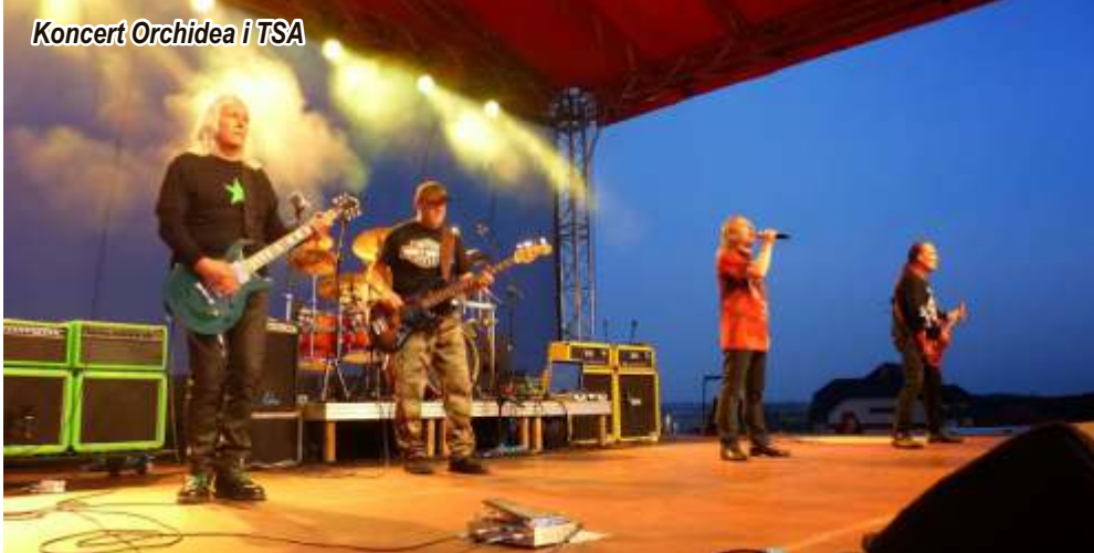
Koncert Orchidea i TSA