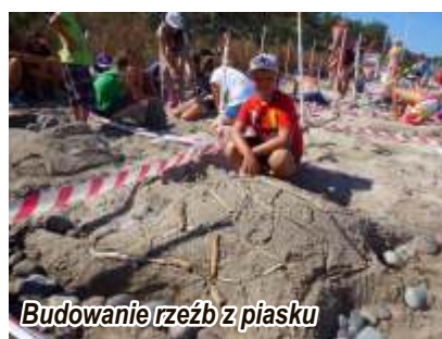
Budowanie rzeźb z piasku