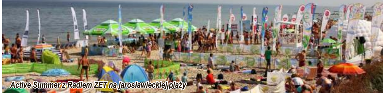
Active Summer z Radiem ZET na jarosławieckiej plaży