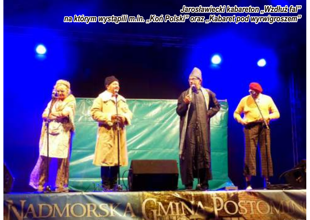
Jarosławiecki kabaret „Wzdłuż fal” na którym wystąpili m.in. „Kofii Polski” oraz „Kabaret pod wyrwigroszem”