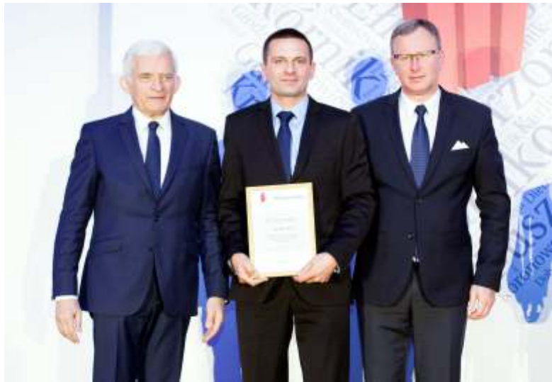
14 lipca br. w Warszawie odbyło się podsumowanie i wręczenie wyróżnień w ramach Rankingu Samorządów "Rzeczpospolitej". Gmina Postomino zajęła w tym rankingu zaszczytne VII miejsce

spośród ponad 1700 gmin wiejskich w Polsce. W zeszłym roku zajęliśmy miejsce 18, a więc przez rok awansowaliśmy aż o ponad dziesięć miejsc. W województwie zachodniopomorskim wyprzedziła nas tylko gmina Stepnica, która zajęła V miejsce. Dodatkowo w kategorii innowacyjny samorząd uplasowaliśmy się na wysokim IX miejscu.