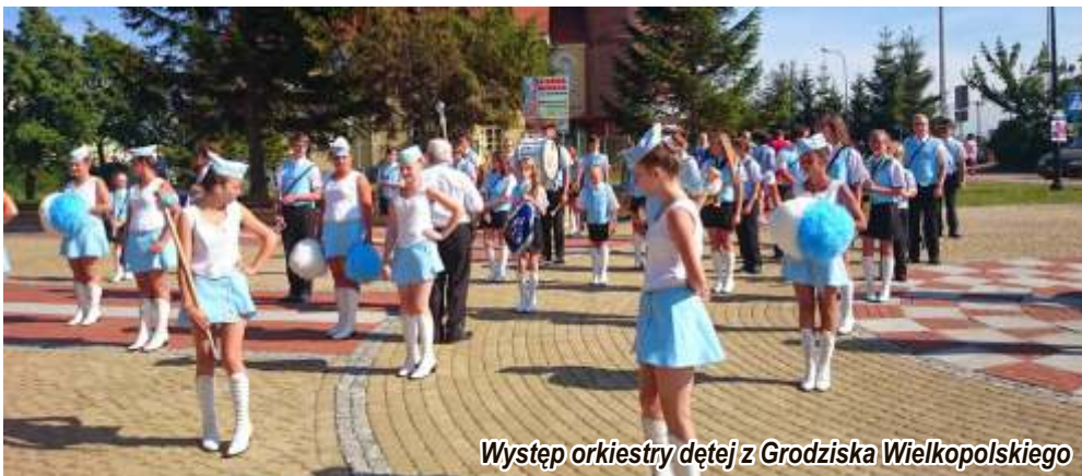
Występ orkiestry dętej z Grodziska Wielkopolskiego