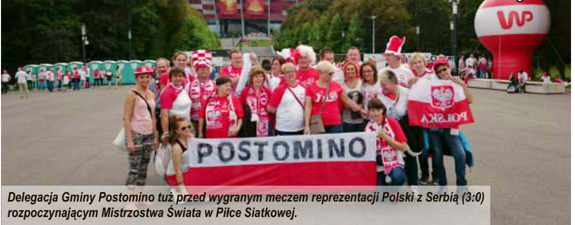
Delegacja Gminy Postomino tuż przed wygranym meczem reprezentacji Polski z Serbią (3:0) rozpoczynającym Mistrzostwa Świata w Piłce Siatkowej.