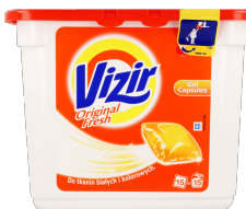
Kapsułki piorące Vizir 15 szt.