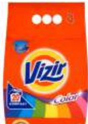
Proszek do prania Vizir 1,4 kg