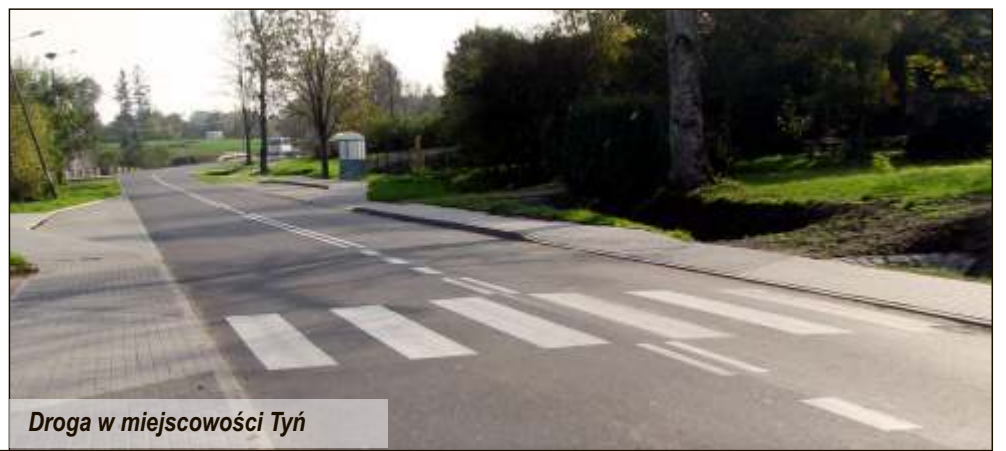
Droga w miejscowości Tyń