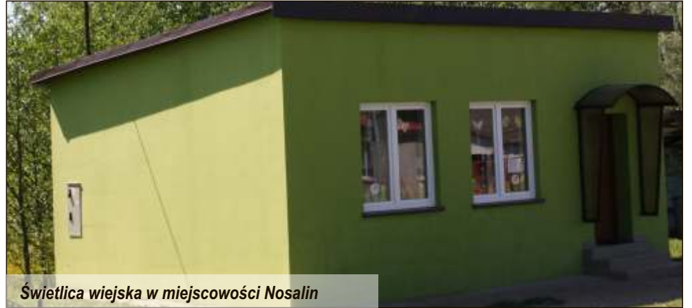
Świetlica wiejska w miejscowości Nosalin