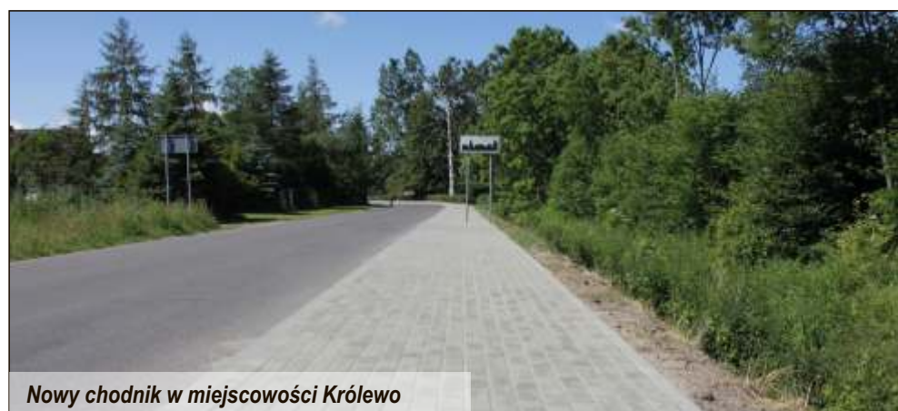
Nowy chodnik w miejscowości Królewo