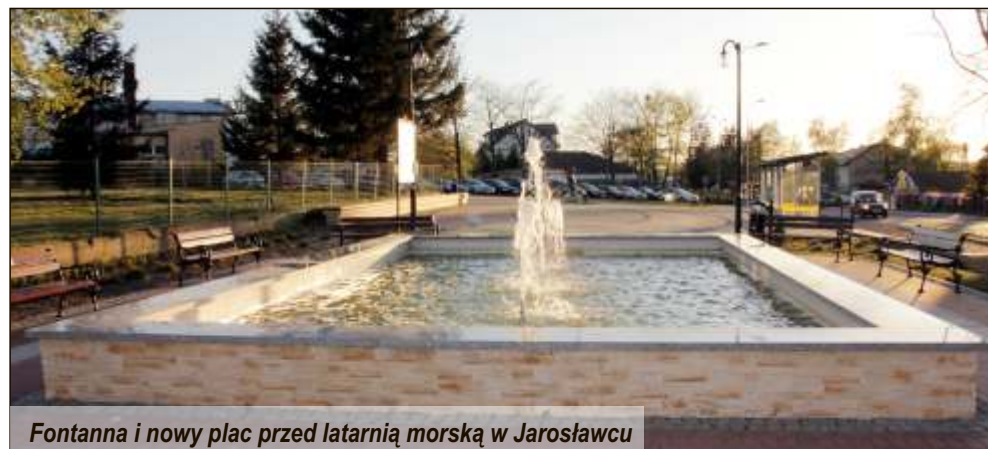
Fontanna i nowy plac przed latarnią morską w Jarosławcu