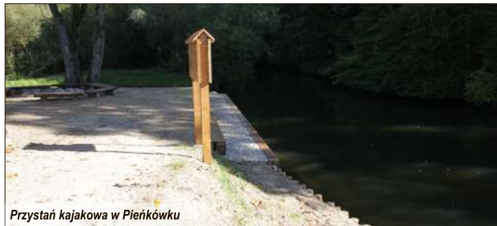
Przystań kajakowa w Pieńkówku