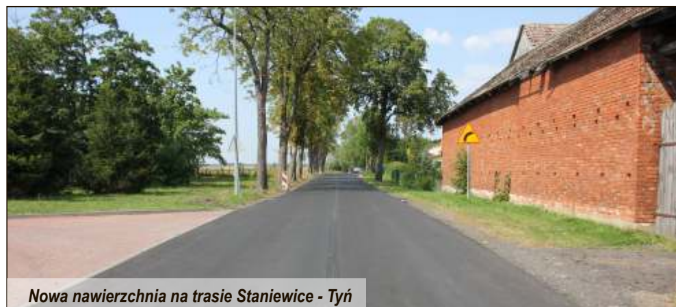
Nowa nawierzchnia na trasie Staniewice - Tyń