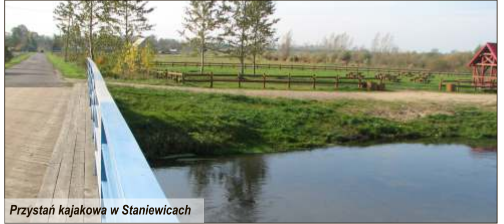
Przystań kajakowa w Staniewicach