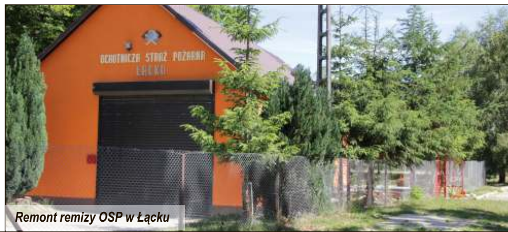
Remont remizy OSP w Łącku