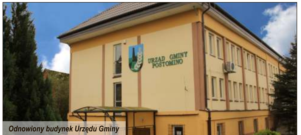
Odnowiony budynek Urzędu Gminy