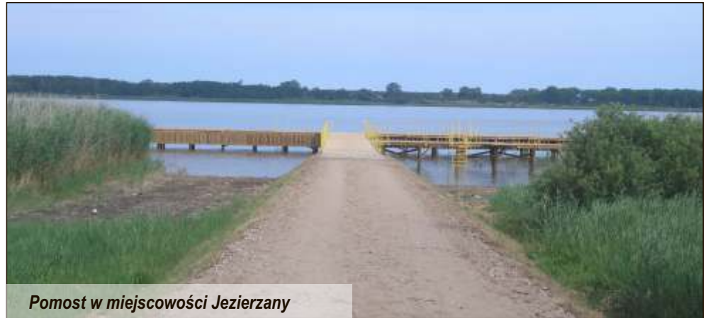
Pomost w miejscowości Jezierzany