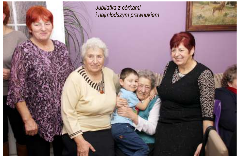
Jubilatka z córkami i najmłodszym prawnukiem