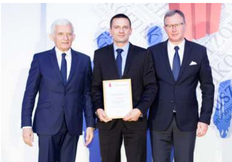
VII miejsce w Rankingu Samorządów „Rzeczpospolitej” 2014 w kategorii GMINA WIEJSKA