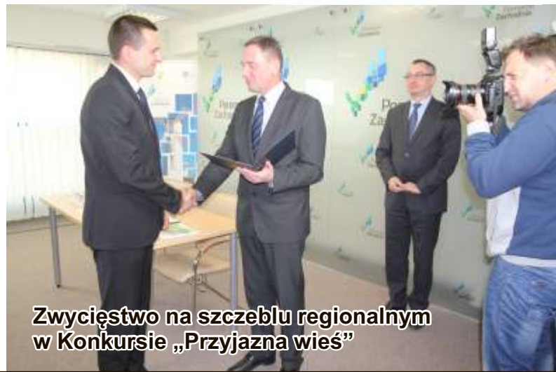
Zwycięstwo na szczeblu regionalnym w Konkursie „Przyjazna wieś”