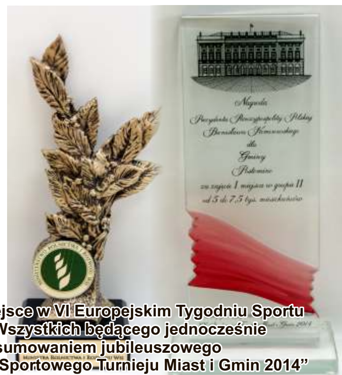
I miejsce w VI Europejskim Tygodniu Sportu dla Wszystkich będącego jednocześnie podsumowaniem jubileuszowego „XX Sportowego Turnieju Miast i Gmin 2014”