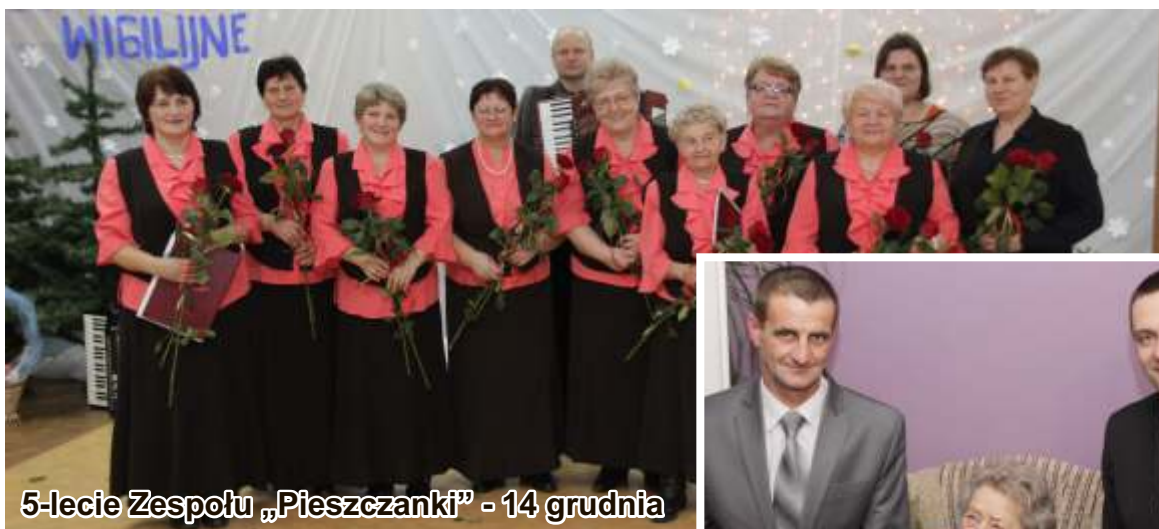
5-lecie Zespołu „Pieszczanki” - 14 grudnia