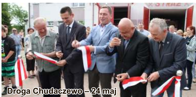
Droga Chudaczewo - 24 maj