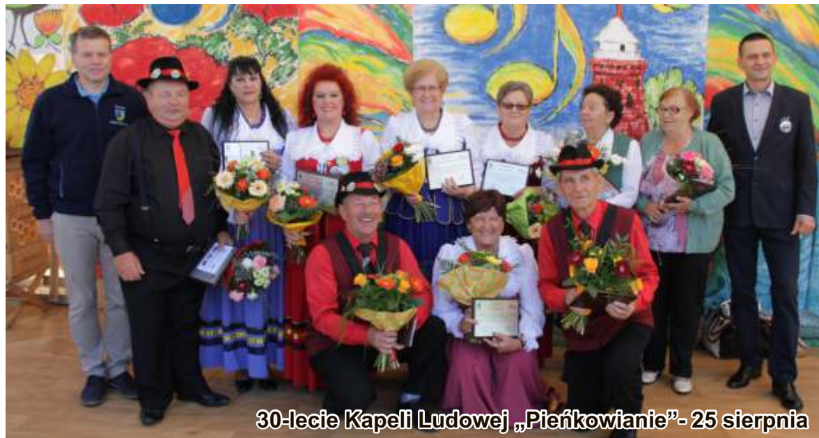
30-lecie Kapeli Ludowej „Pieńkowanie” - 25 sierpnia