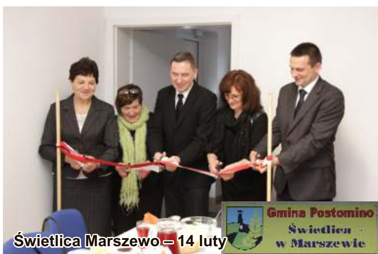
Świetlica Marszewo - 14 luty