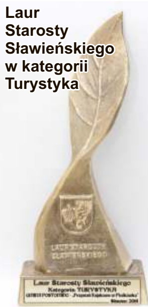
Laur Starosty Sławieńskiego w kategorii Turystyka