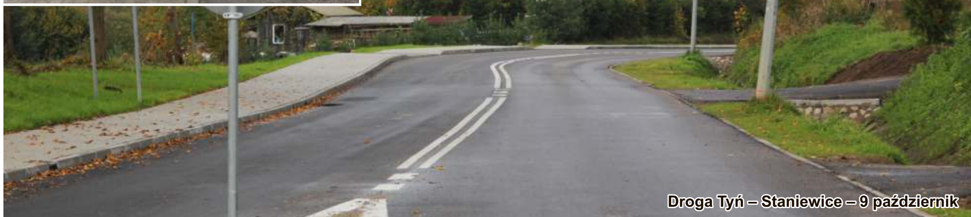
Droga Tyń - Staniewice - 9 październik