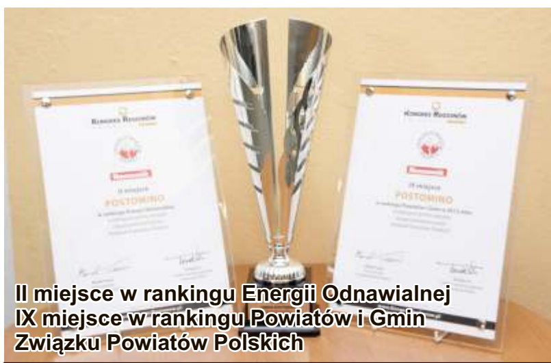
II miejsce w rankingu Energii Odnawialnej IX miejsce w rankingu Powiatów i Gmin Związku Powiatów Polskich