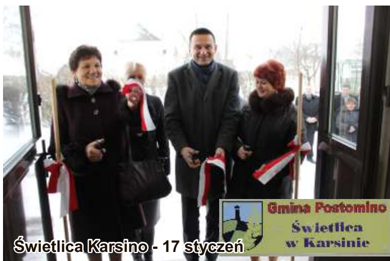
Świetlica Karsino - 17 styczeń