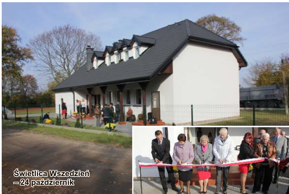
Świetlica Wszedzień - 24 październik