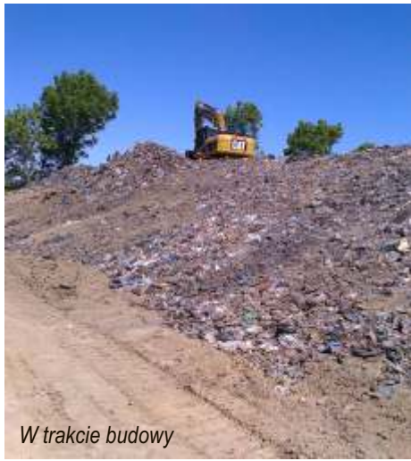
W trakcie budowy