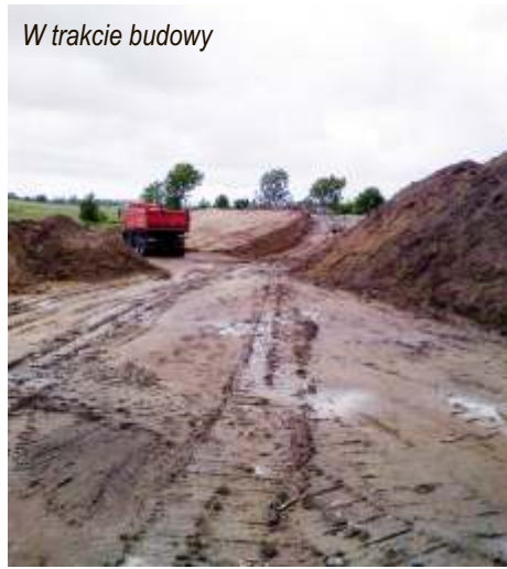
W trakcie budowy