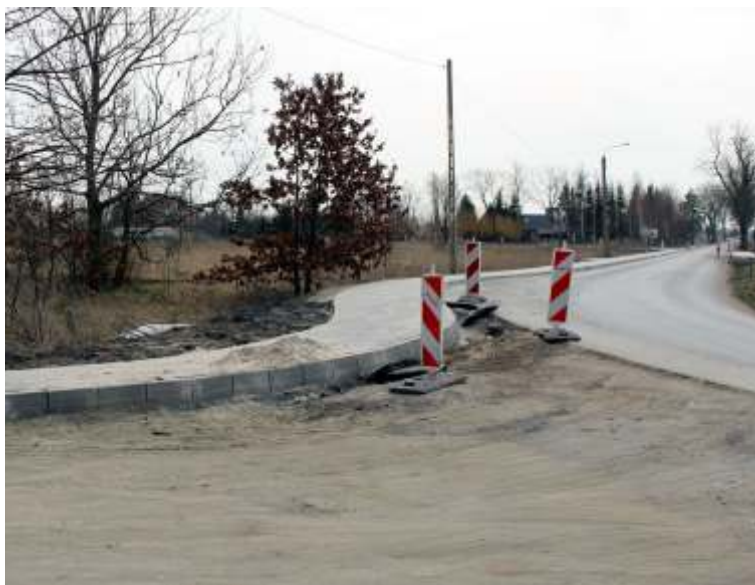
Przebudowa skrzyżowań, budowa chodnika i przystanków w centrum Jezierzan.