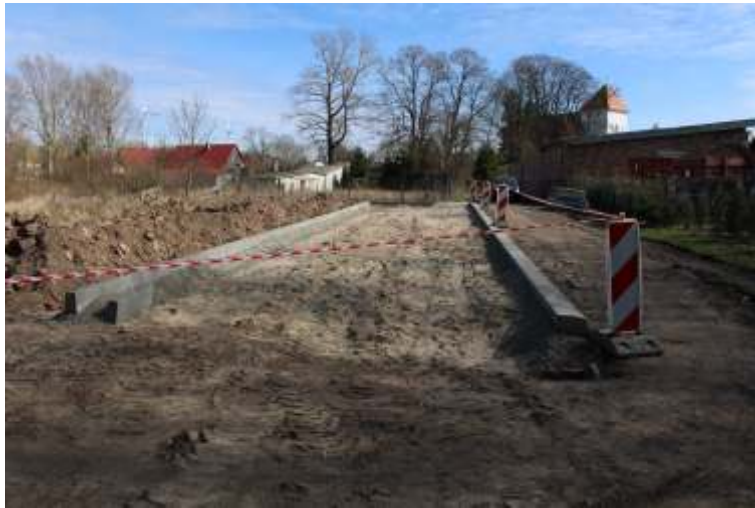
Budowa parkingu przy cmentarzu komunalnym w Marszewie.

Na zlecenie Gminy Postomino Gminne Przedsiębiorstwo Komunalne Sp. z o.o. w Postominiu przystąpiło do budowy parkingu przy cmentarzu komunalnym w Marszewie. Parking będzie wykonany z kostki brukowej betonowej na podbudowie z kruszywa łamanego na powierzchni 165 m 2 . Termin wykonania prac wyznaczono do dnia 30 kwietnia 2016 r. W następnej kolejności w/w spółka będzie realizowała budowę ciągu pieszego o łącznej długości 100 mb w miejscowości Złakowo. Chodnik będzie wykonany z kostki brukowej betonowej o gr. 6 cm. Zadeklarowany termin wykonania to 31 maj 2016 roku. Po zakończeniu tych zadań będzie realizowany także remont drogi wraz