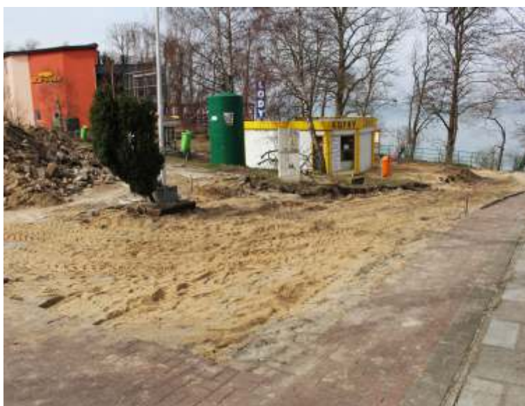
Przebudowa placu za Punktem Informacji Turystycznej w Jarosławcu.