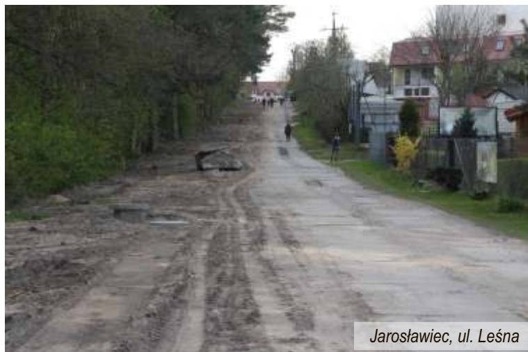
Jarosławiec, ul. Leśna

brukowej na ulicy Piaskowej oraz kończy się budowa odcinka kanalizacji deszczowej na ulicy Leśnej. Zakończenie budowy ulicy Piaskowej umożliwi prowadzenie robót na ulicy Leśnej, która będzie na okres budowy zamknięta. Trwają również intensywne prace w centrum