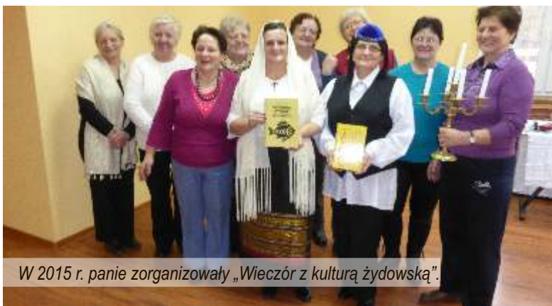
W 2015 r. panie zorganizowały „Wieczór z kulturą żydowską”.

Odkryto się kwietniowe spotkanie kobiet, które zdecydowały się na wspólne – gminne – działania. Wprawdzie frekwencja nie była zbyt wysoka, jednakże dziękujemy tym paniom, które znalazły czas i chęć do działań wspólnie z Postomińskim Stowarzyszeniem „Razem lepiej”.