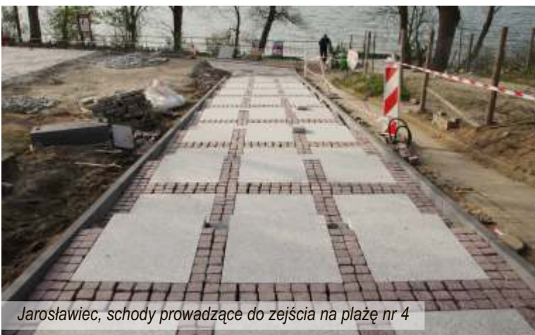
Jarosławiec, schody prowadzące do zejścia na plażę nr 4