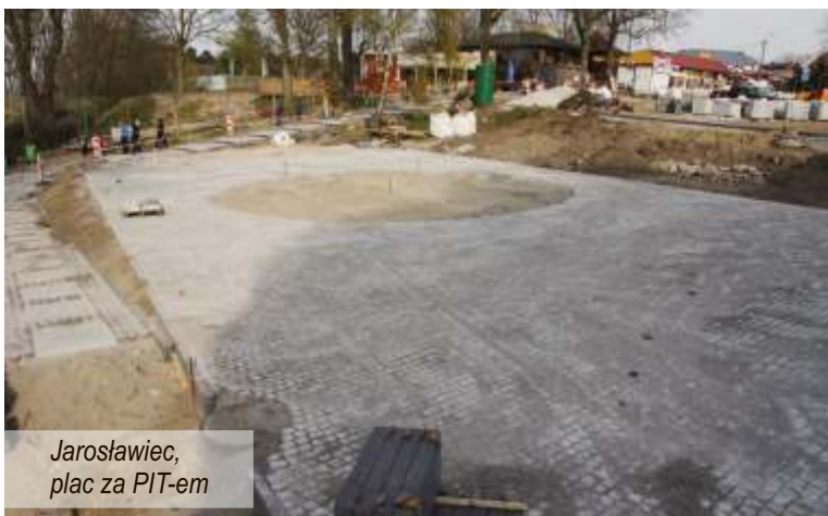
Jarosławiec, plac za PIT-em

W maju zostanie ogłoszony przetarg nieograniczony na budowę altany rekreacyjnej w konstrukcji szkieletowej drewnianej o powierzchni 38,5 m 2 z dachem dwuspadowym w miejscowości TYŃ.