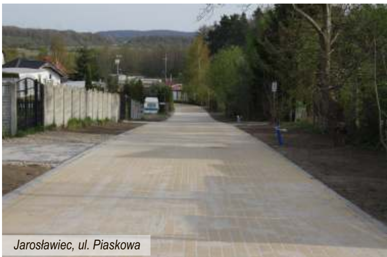
Jarosławiec, ul. Piaskowa

Firma Strabag Sp. z o.o. kontynuuje prace budowlane w Jarosławcu i Jezierzanach, pisaliśmy o nich w poprzednim numerze. Obecnie w Jezierzanach budowane jest oświetlenie drogowe. W Jarosławcu natomiast zakończona została budowa nawierzchni z kostki