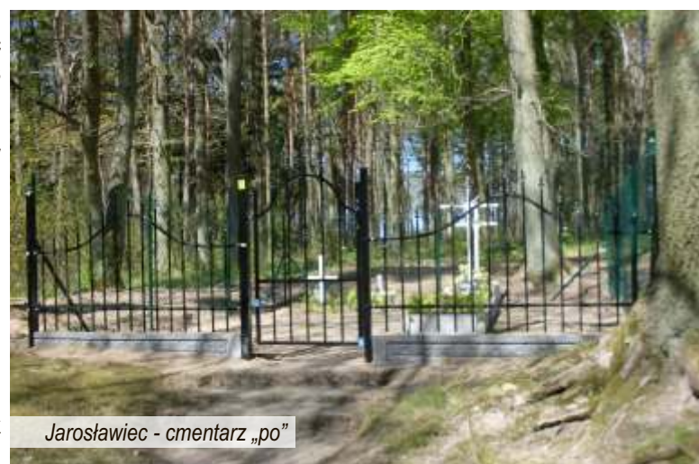
Jarosławiec - cmentarz „po”

Dzięki wykonanym pracom porządkowym udało się przywrócić szacunek zmarłym a ich mogiły ocalić od zapomnienia.