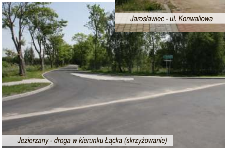
Jezierzany - droga w kierunku Łącka (skrzyżowanie)

zapleczem. W najbliższych dniach zostaną rozstrzygnięte przetargi na budowę altany w miejscowości Tyń, zagospodarowanie terenu pod mały plac zabaw w Postominie oraz na prace projektowe pod zagospodarowanie terenu w miejscowościach Pałowo, Pałwoko i Rusinowo, a także na budowę remizy OSP w Pieszczu.