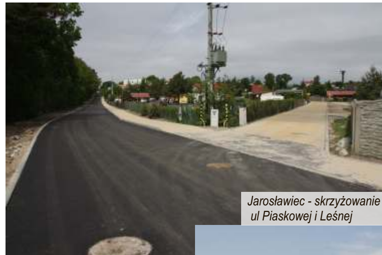
Jarosławiec - skrzyżowanie ul. Piaskowej i Leśnej

Zgodnie z zawartymi umowami zakończono opracowywanie projektów przy przebudowie dróg gminnych wraz z budową ścieżki rowerowej w technologii z betonu asfaltowego z oświetleniem w miejscowości Pieńkówko, ciągu pieszo-jezdnego w m. Korlino oraz przebudowę drogi gminnej z niezbędną infrastrukturą i oświetleniem drogowym w m. Postomino (droga za Urzędem Gminy równoległa do drogi wojewódzkiej nr 203, na odcinku od drogi powiatowej prowadzącej do Marszewa do drogi wojewódzkiej przy siedzibie Gminnego Przedsiębiorstwa Komunalnego). Wykonano także projekt rozbudowy budynku Informacji Turystycznej w Jarosławcu poprzez zaprojektowanie dodatkowej kondygnacji z przeznaczeniem na salę wystawową z niezbędnym mini