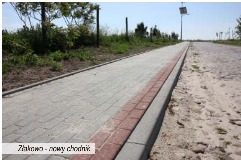
Złakowo - nowy chodnik