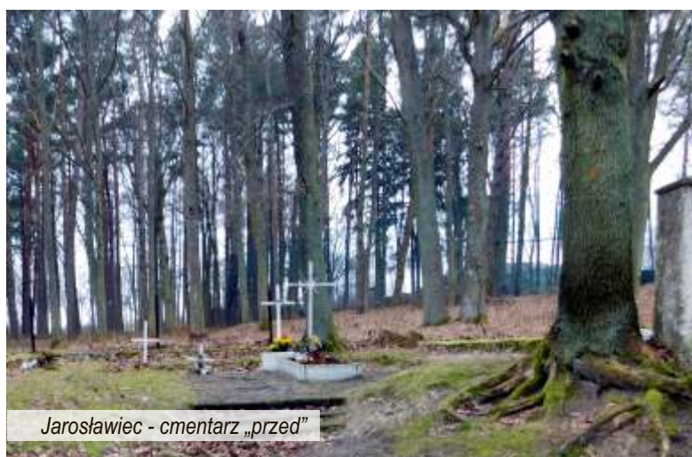
Jarosławiec - cmentarz „przed”

Jarosławiec to miejscowość zmieniająca się dynamicznie, lecz czas zatrzymuje się i tu. Historia jest niewątpliwie nieodłączną częścią naszego życia, świadczy o tym niewielki cmentarzyk na ulicy Bałtyckiej, na którym spoczywają bezimienni.