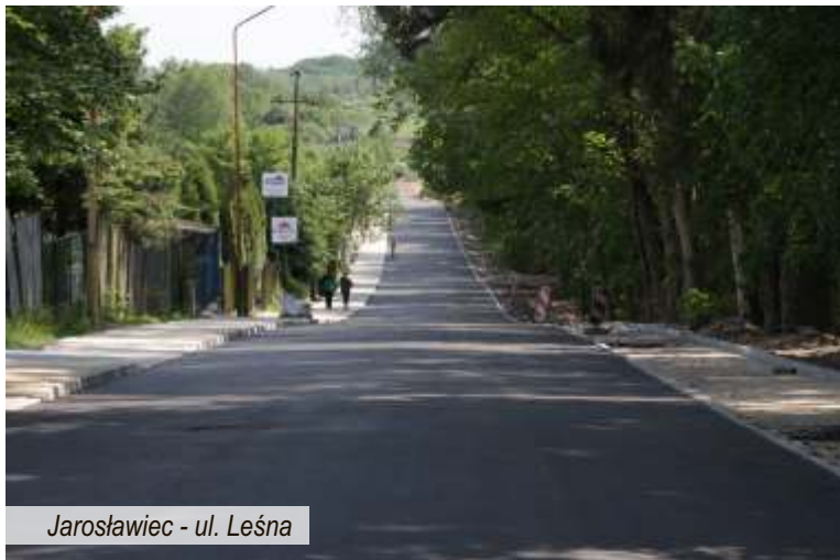
Jarosławiec - ul. Leśna

Zgodnie z harmonogramem firma Strabag Sp. z o.o. zakończyła prace drogowe związane z przebudową odcinka drogi powiatowej w Jezierzanach. Do zakończenia zadania pozostało ustawienie wiat przystankowych oraz montaż lamp oświetleniowych. Jednocześnie ww. firma kontynuuje prace przy przebudowie ul. Leśnej w Jarosławcu, gdzie wykonano już chodnik z kostki betonowej oraz trwają prace przygotowawcze do wylania betonu asfaltowego jezdni oraz ścieżki rowerowej. Po zakończeniu robót na ulicach Piaskowej i Leśnej wykonawca zintensyfikuje prace na ulicach: Różanej, Fiołkowej, Konwaliowej i Chabrowej na Osiedlu Południe w Jarosławcu. Trwają również prace wykończeniowe terenu oraz budowa sanitariatów za Punktem Informacji Turystycznej przy ulicy Nadmorskiej.