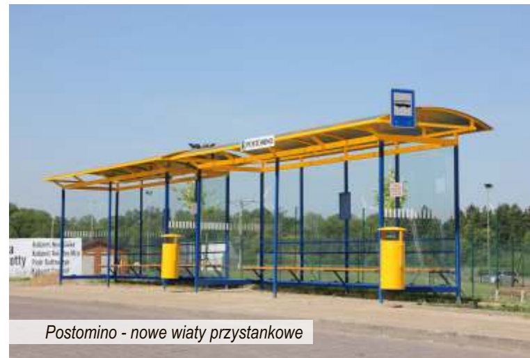
Postomino - nowe wiaty przystankowe