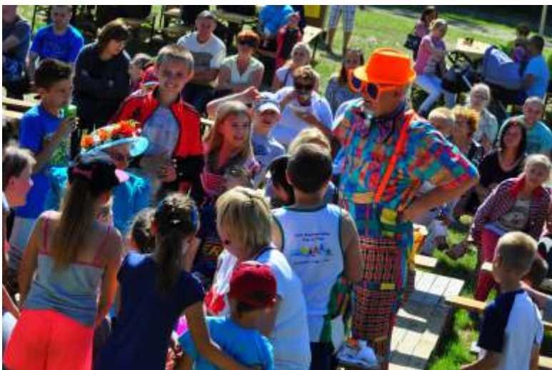
taneczne „Iskra” i „Iskierka” z Centrum Kultury i Sportu w Postominie. Można