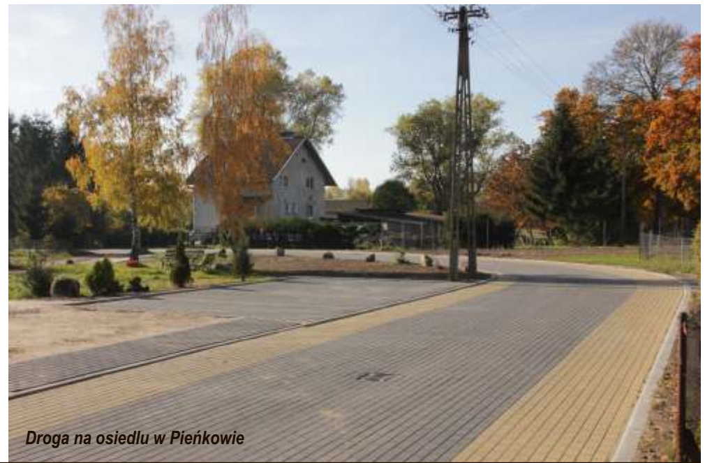
Droga na osiedlu w Pieńkowie