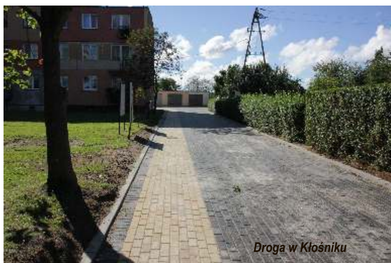
Droga w Kłośniku

Pod koniec roku wypełniona została 3 kwatery aż 180.000 m 3 piasku, dzięki czemu w Jarosławcu powstała 3-hektarowa piękna plaża. Efektem prowadzonych prac jest nie tylko zabezpieczenie brzegu morskiego w Jarosławcu, ale też powstanie niewątpliwie wyjątkowej atrakcji turystycznej- jedynej w Polsce tego typu budowli hydrotechnicznej!