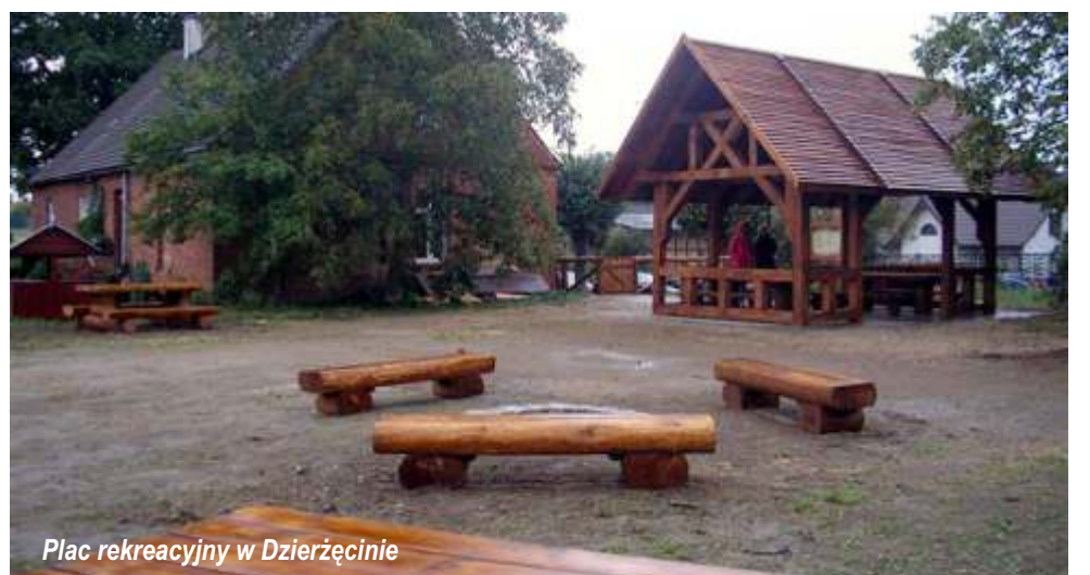
Plac rekreacyjny w Dzierżęcinie