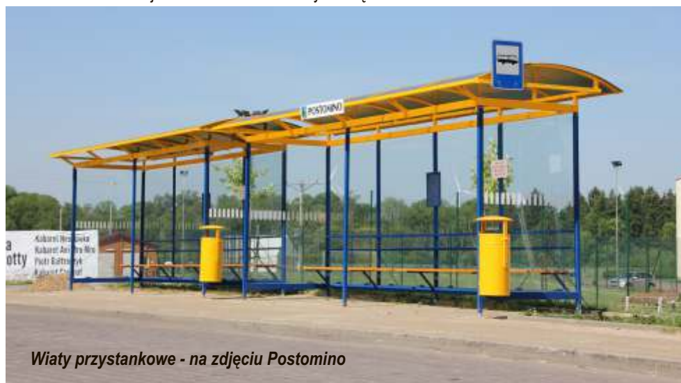
Wiaty przystankowe - na zdjęciu Postomino