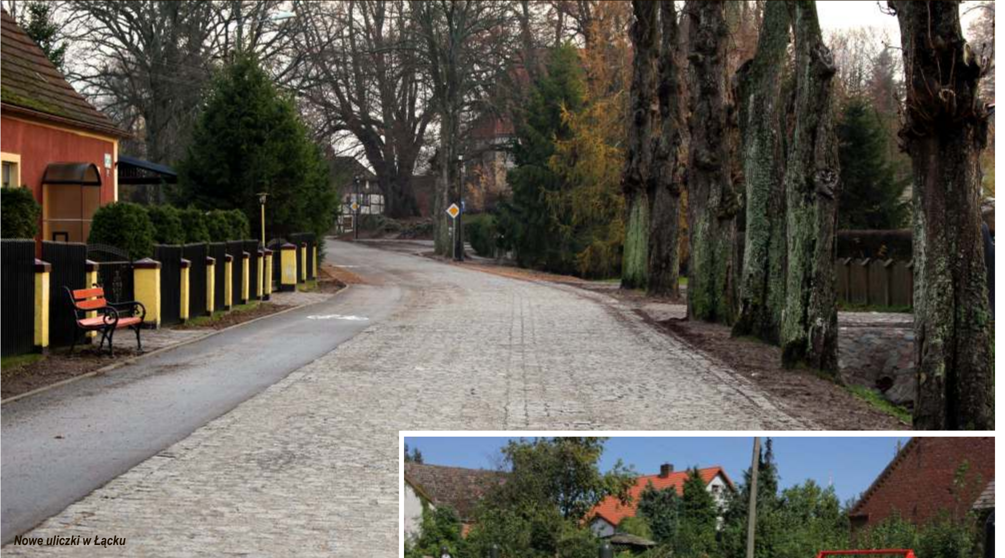
Nowe uliczki w Łącku

stojak na rowery, palenisko z kostki granitowej. Cały teren jest ogrodzony i oświetlony.