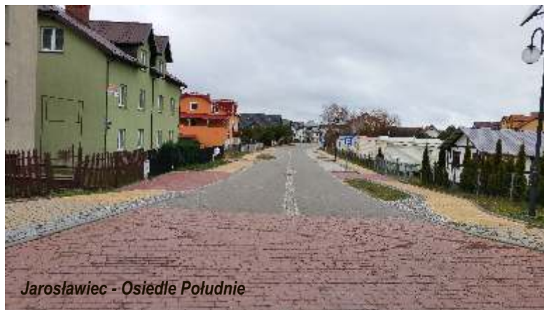
Jarosławiec - Osiedle Południe

Przebudowano ulicę Nadmorską od skrzyżowania z ul. Bałtycką do skrzyżowania z ul. Rybacką w Jarosławcu, plac za Punktem Informacji Turystycznej oraz zamontowano stalową konstrukcję schodów przy zejściu na plażę nr 4. Podesty i stopnie schodów wykonane są z konglomeratów odpornych na warunki atmosferyczne tj. drewna syntetycznego będącego substytutem drewna naturalnego wytworzonego w całości z wtórnych tworzyw sztucznych uzyskanych w wyniku