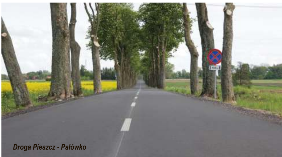
Droga Pieszcz - Pałówko

W Dzierżęcinie wyremontowano pomieszczenia świetlicy wiejskiej oraz zagospodarowano teren pod rekreację wraz z elementami małej architektury. Tym samym w miejscowości powstało estetyczne miejsce spotkań mieszkańców wraz z placem zabaw przy świetlicy wiejskiej, wiatą rekreacyjną wyposażoną w ławostoly,