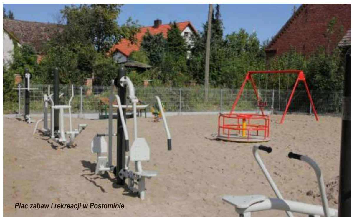
Plac zabaw i rekreacji w Postominie

Powstało 20 nowych wiat przystankowych. Wiaty wyposażone są w drewnianą ławkę, tablicę z nazwą