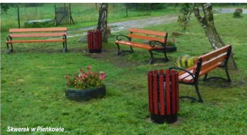
Skwerek w Pieńkowie