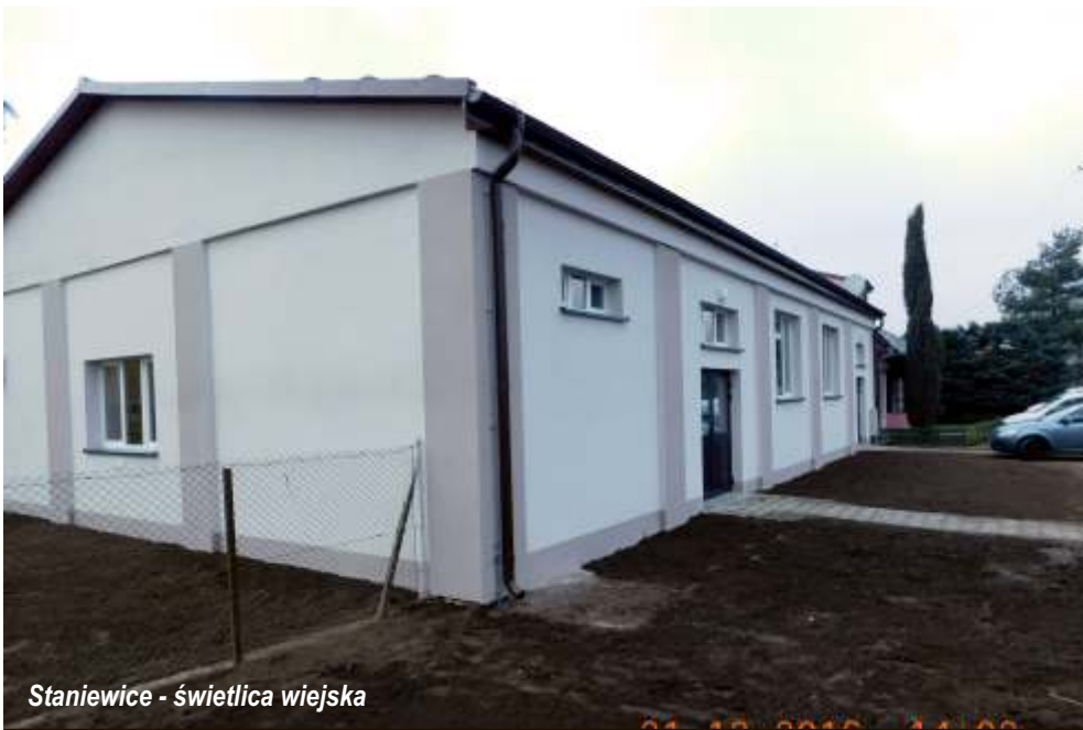
Staniewice - świetlica wiejska

W miejscowości Królewo wykonano chodnik z kostki brukowej z wjazdami do poszczególnych posesji oraz zatokę autobusową z wiatą przystankową. Chodnik zabezpieczono