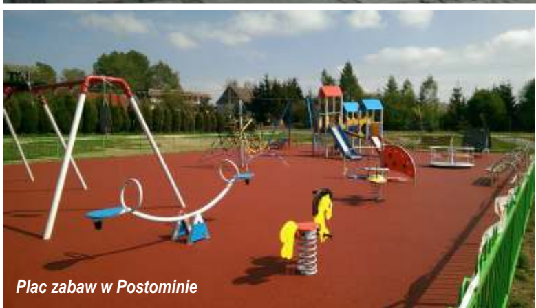
Plac zabaw w Postominie

barierkami ochronnymi oraz niezbędnym oznakowaniem. Dodatkowo w Królewie przebudowano drogę gminną.