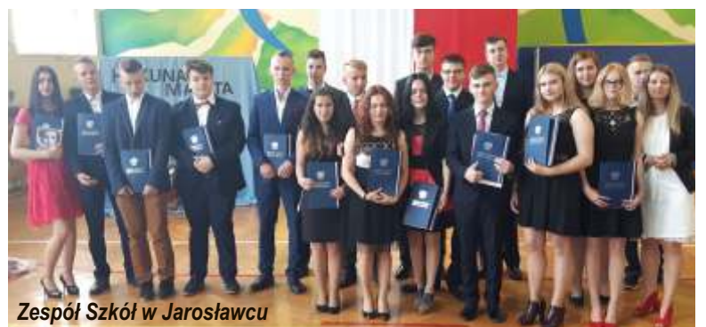
Zespół Szkół w Jarosławcu