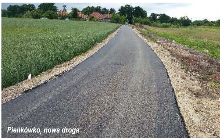
Pieńkówko, nowa droga

Rozpoczęły się również prace przy przebudowie dróg gminnych