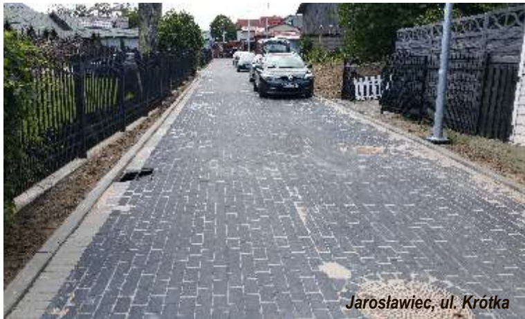
Jarosławiec, ul. Krótka

sąsiedni zabezpieczyć, ścianę elewacyjną ocieplić, a teren po rozebrany budynku uporządkować. Roboty zostały wykonane przez Zakład Ogólnobudowlany Mirosław Wardak z siedzibą w Sławnie, a całkowity koszt robót wyniósł 100 000,00 zł brutto.