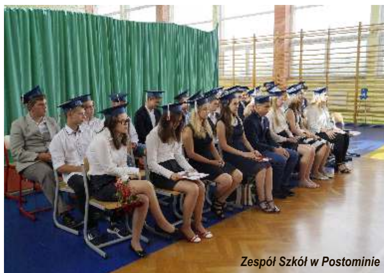
Zespół Szkół w Postominie

Drodzy Uczniowie i Rodzice, Szanowni Państwo Dyrektorzy, Nauczyciele i Wychowawcy, z okazji zakończenia roku szkolnego 2016/2017 składam Państwu serdeczne podziękowania. Dyrektorom szkół i nauczycielom oraz wszystkim pracownikom oświaty serdecznie dziękuję za rzetelność i wytrwałość, za serce i zaangażowanie, za solidną, sumienną pracę.