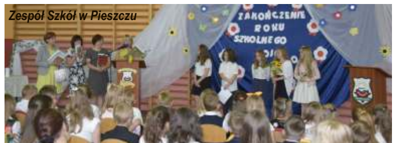
Zespół Szkół w Pleszewie