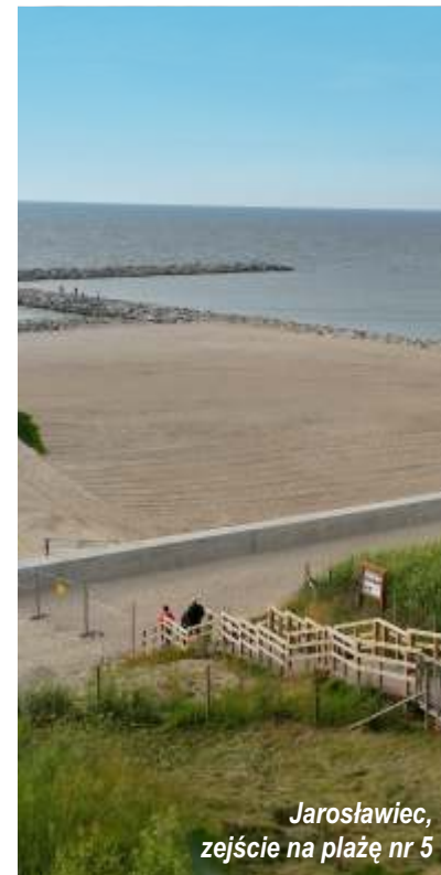
Jarosławiec, zejście na plażę nr 5

7 lipca 2017 r. otwarto nowo usypaną plażę w Jarosławcu. Schody znajdujące się na zejściu na plażę numer 5 prowadzą bezpośrednio na nową strefę wypoczynku.