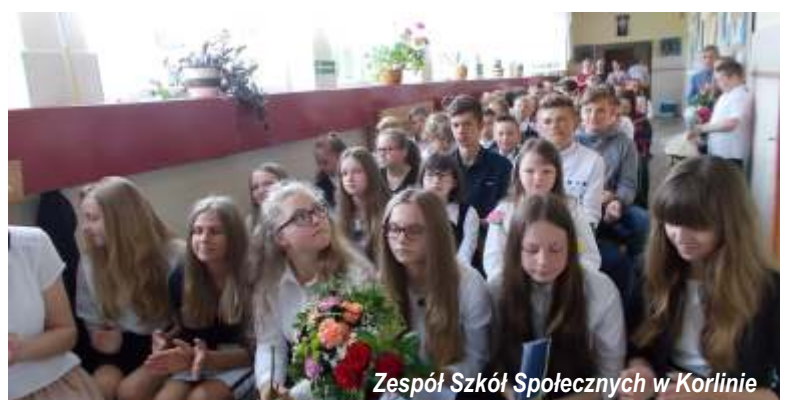
Zespół Szkół Społecznych w Korlinie