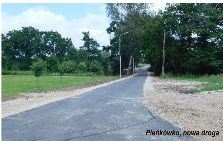
Pieńkówko, nowa droga