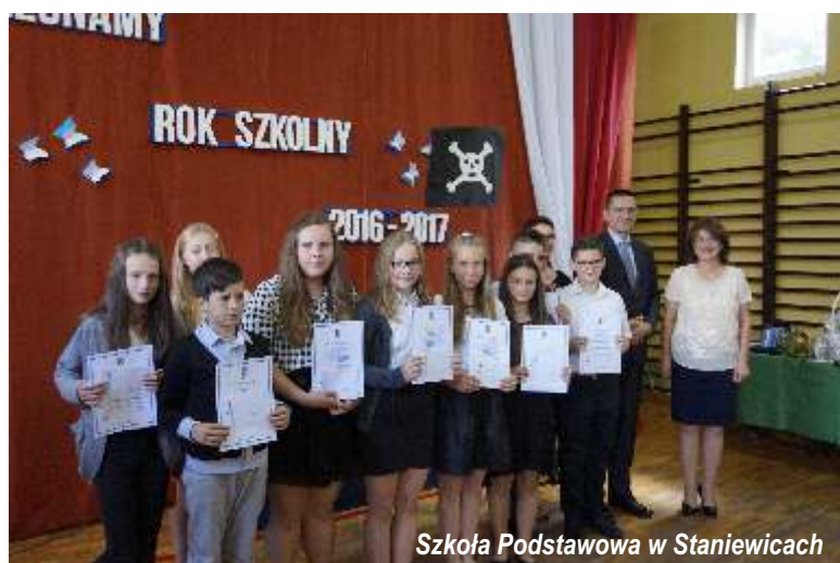
Szkoła Podstawowa w Staniewicach