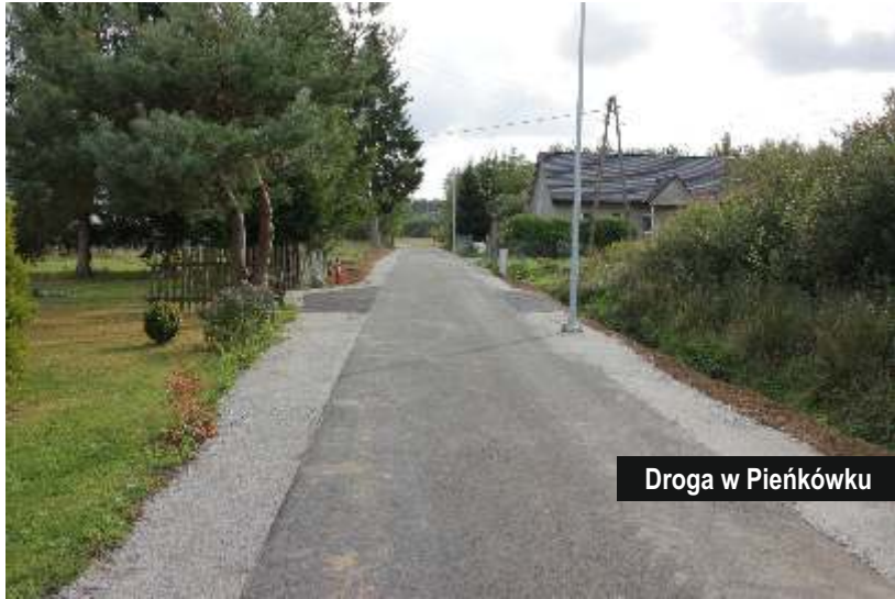
Droga w Pieńkówku

W październiku dokonano odbioru przebudowy drogi gminnej wraz z oświetleniem drogowym w miejscowości Pieńkówko. W ramach robót budowlanych przebudowano 1,18 km drogi gminnej o nawierzchni z betonu asfaltowego, zamontowano 33 punkty świetlne oświetlenia drogowego z oprawami typu LED,