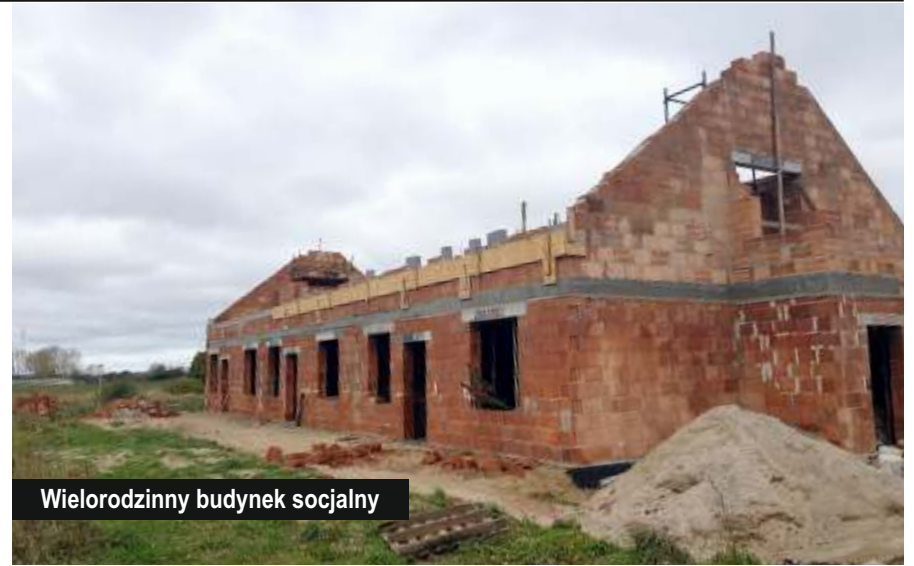
Wielorodzinny budynek socjalny

W październiku dokonano odbioru przebudowy drogi gminnej wraz z oświetleniem drogowym w miejscowości Pieńkówko. W ramach robót budowlanych przebudowano 1,18 km drogi gminnej o nawierzchni z betonu asfaltowego, zamontowano 33 punkty świetlne oświetlenia drogowego z oprawami typu LED,