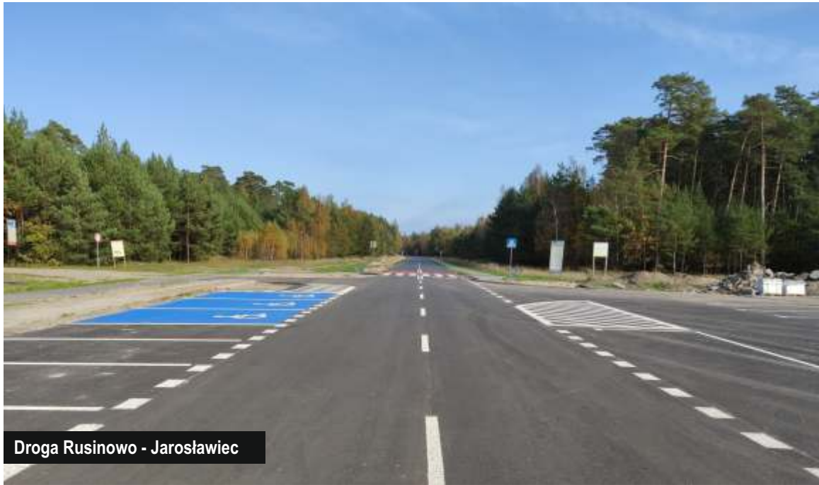
Droga Rusinowo - Jarosławiec

Z końcem października odebrane zostały prace związane z montażem pięciu mikroinstalacji fotowoltaicznych na terenie obiektów szkolnych w Korlinie, Pieszczu, Staniewicach, Jarosławcu i Postominie zrealizowanych w ramach zadania inwestycyjnego pn. „Termomodernizacja budynków szkolnych w miejscowościach Postomino, Pieszcz, Staniewice,