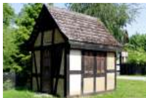
Domek z szachulca