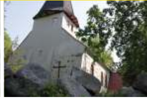
Kościół - strona zachodnia