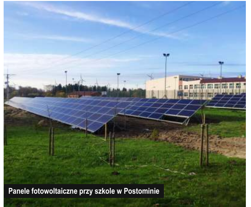
Panele fotowoltaiczne przy szkole w Postominie

W Jarosławcu zakończono prace związane z budową konstrukcji dachu budynku stołówki, żłobka i przedszkola. Wykonawca przystąpił obecnie do robót dekarских. Trwa również murowanie ścian działowych oraz montaż wewnętrznych instalacji elektrycznych i sanitarnych.