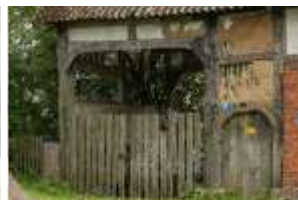
Brama z 1767 roku