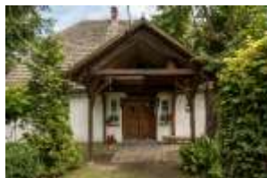
Chata Bogusława X