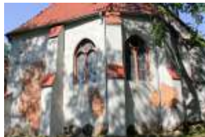
Kościół - strona wschodnia