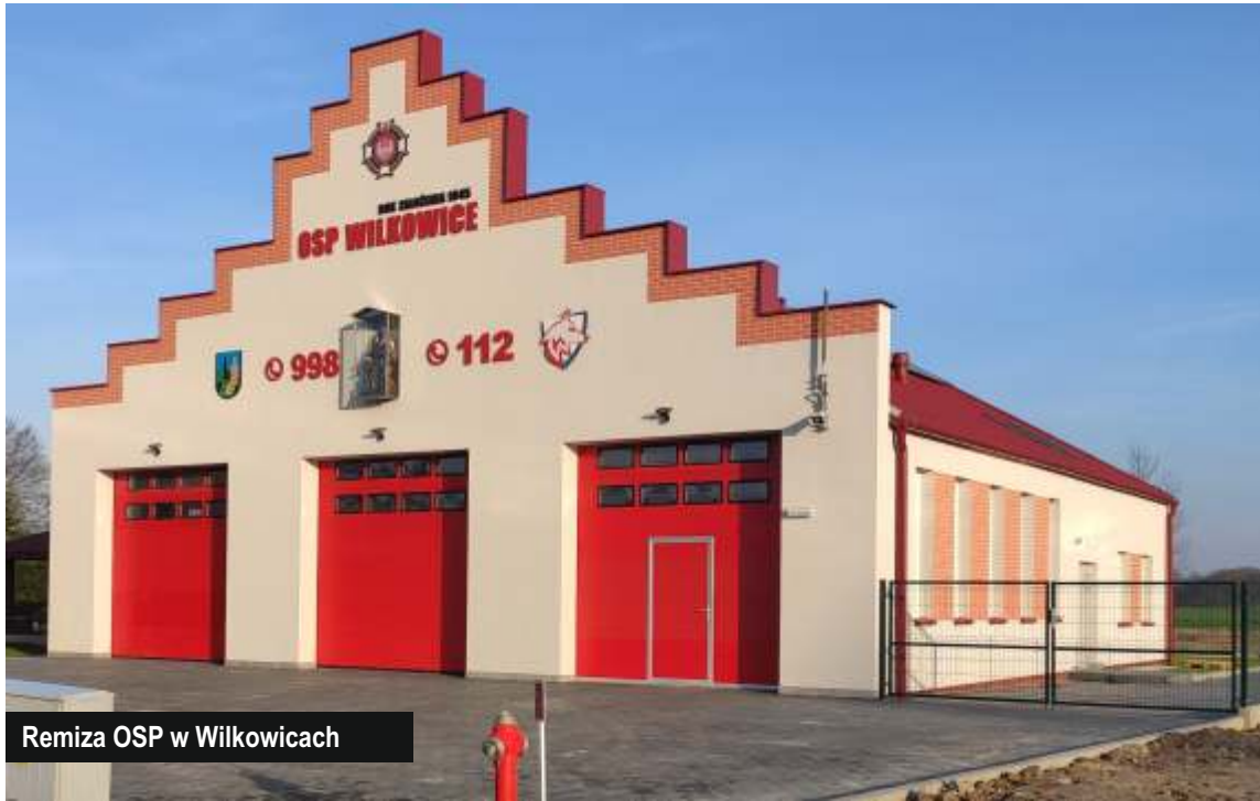
Remiza OSP w Wilkowicach

Koniec roku kalendarzowego to okres kiedy finiszują zadania inwestycyjne zaplanowane na bieżący rok. Rok 2020, choć w cieniu epidemii, był bardzo intensywny pod względem inwestycyjnym. Efekty są zauważalne na każdym kroku.