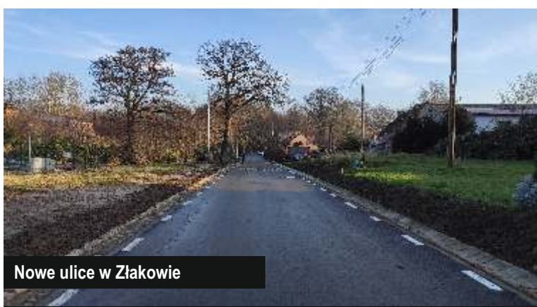
Nowe ulice w Złakowie