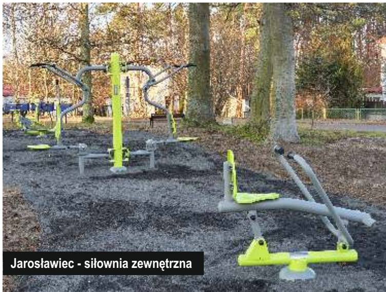
Jarosławiec - siłownia zewnętrzna

wyposażenia nie gwarantowałby właściwego funkcjonowania jednostki OSP, dlatego budynek remizy jest doposażony. Montowany jest zbiornik na gaz, który będzie ogrzewał remizę i świetlicę. Ekologiczne źródło ciepła wspólnie z panelami fotowoltaicznymi czynią ten budynek jednym z bardziej ekologicznych obiektów użyteczności publicznej na terenie naszej gminy. Ponadto sam budynek remizy doposażony jest m. in. w szafki na nomexy. W prace montażowe włączyli się sami strażacy.