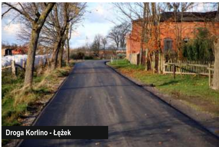
Droga Korlino - Łężek