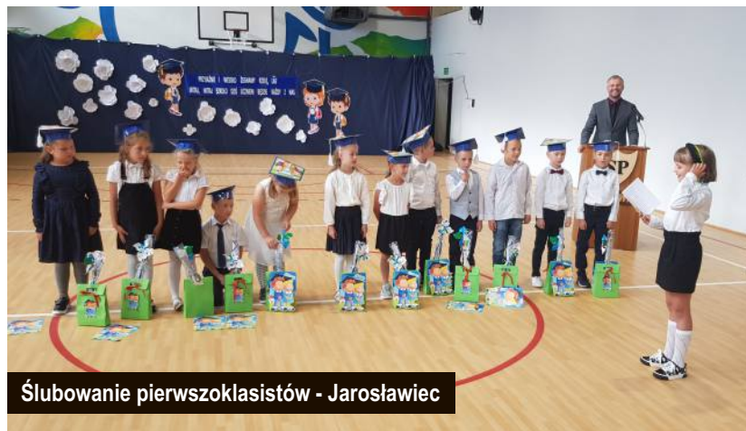
Ślubowanie pierwszoklasistów - Jarosławiec

W roku szkolnym 2022/2023 naukę na poziomie szkoły podstawowej rozpoczęło 553 uczniów. 246 dzieci korzystać będzie z wychowania przedszkolnego, w tym