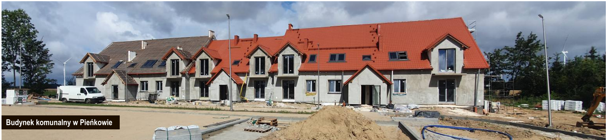
Budynek komunalny w Pieńkowie