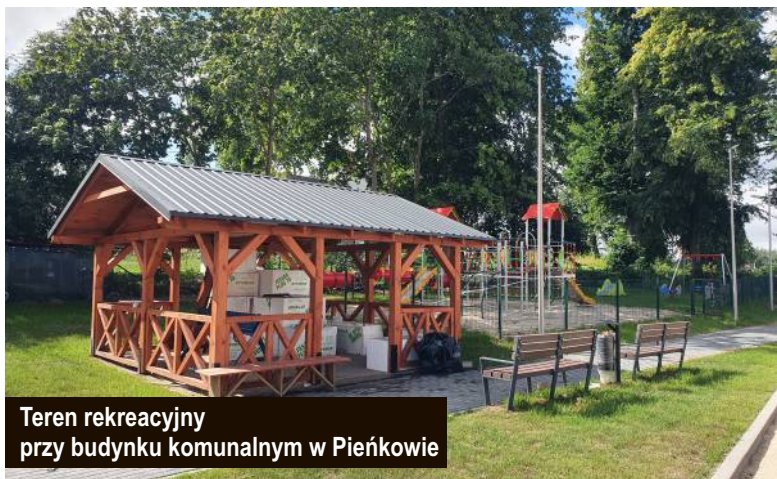
Teren rekreacyjny przy budynku komunalnym w Pieńkowie