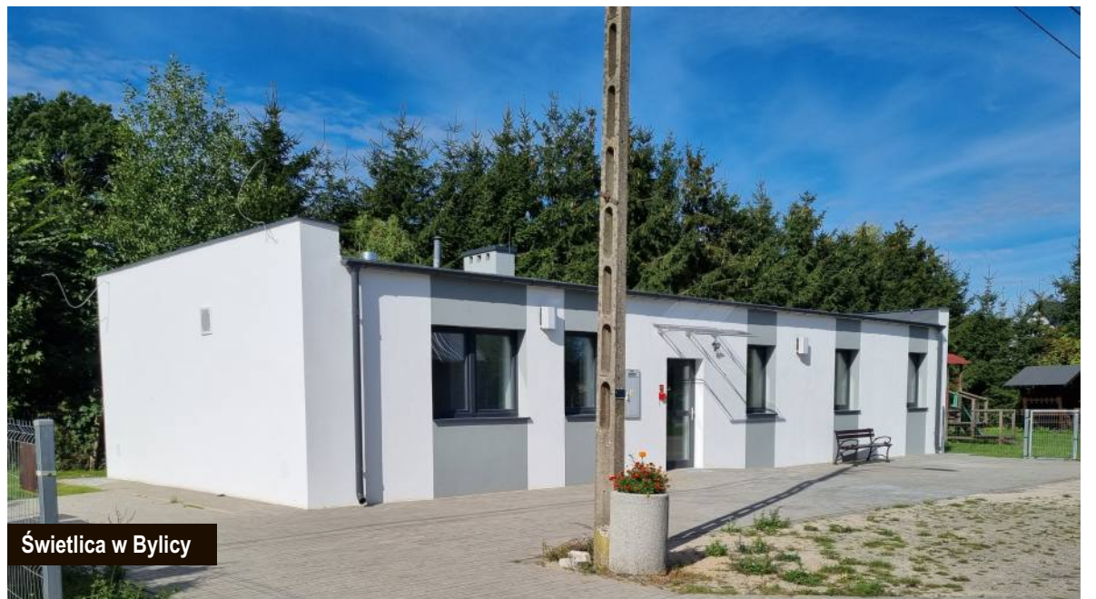
Świetlica w Bylicy

Obecnie prowadzone są prace na drodze w m. Postomino. Następnie zostanie przebudowana droga wiejska w m. Królowo oraz kolejny odcinek drogi wiejskiej w m. Postomino.