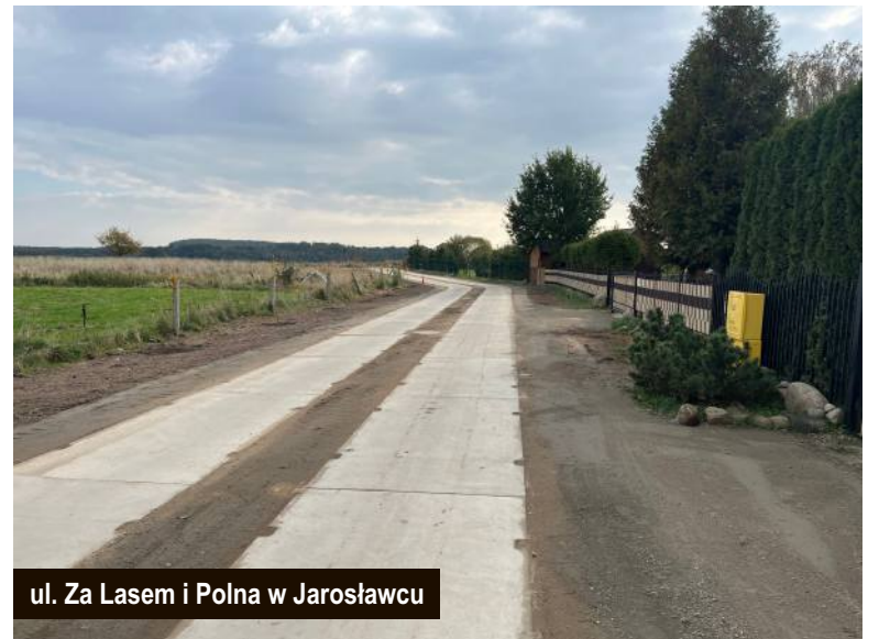
ul. Za Lasem i Polna w Jarosławcu

Jednocześnie z kończeniem tegorocznych zadań inwestycyjnych, trwają intensywne prace związane z przygotowaniem realizacji zadań na rok 2023. Prowadzone są postępowania przetargowe na przebudowę ul. Bazyliuszka w m. Rusinowo oraz modernizację budynku OSP w Chudaczewie.