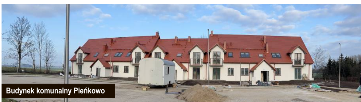
Budynek komunalny Pieńkowie