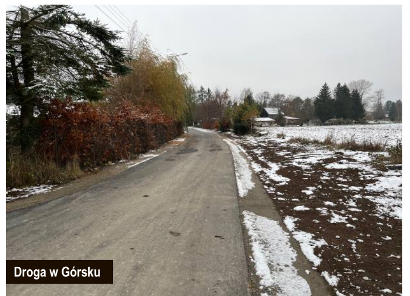
Droga w Górsku