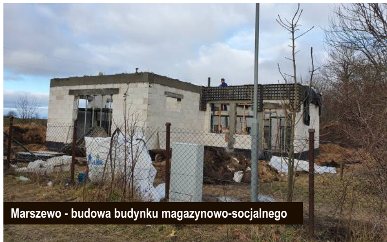
Marszewo - budowa budynku magazynowo-socjalnego