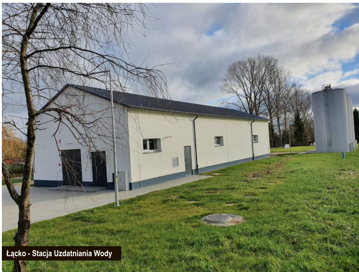
Łącko - Stacja Uzdatniania Wody