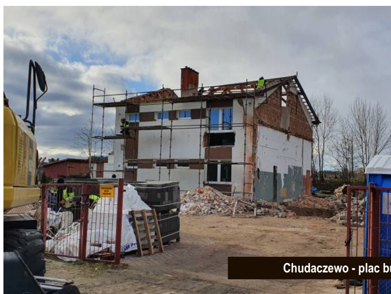
Chudaczewo - plac budowy świetlicy i remizy OSP