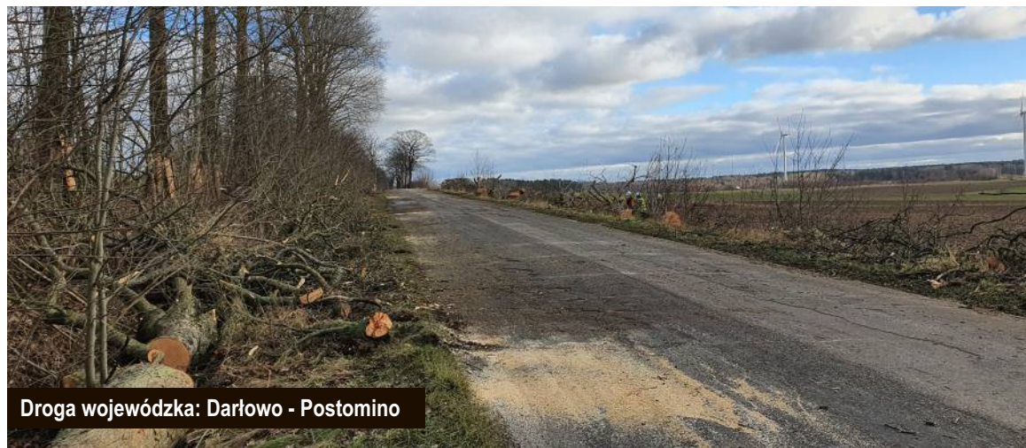
Droga wojewódzka: Darłowo - Postomino