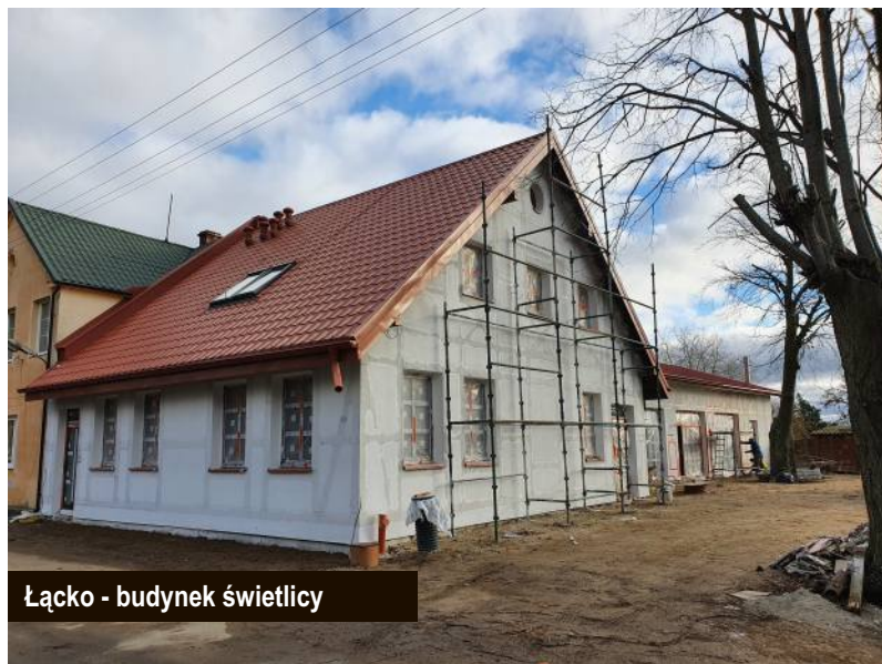
Łącko - budynek świetlicy