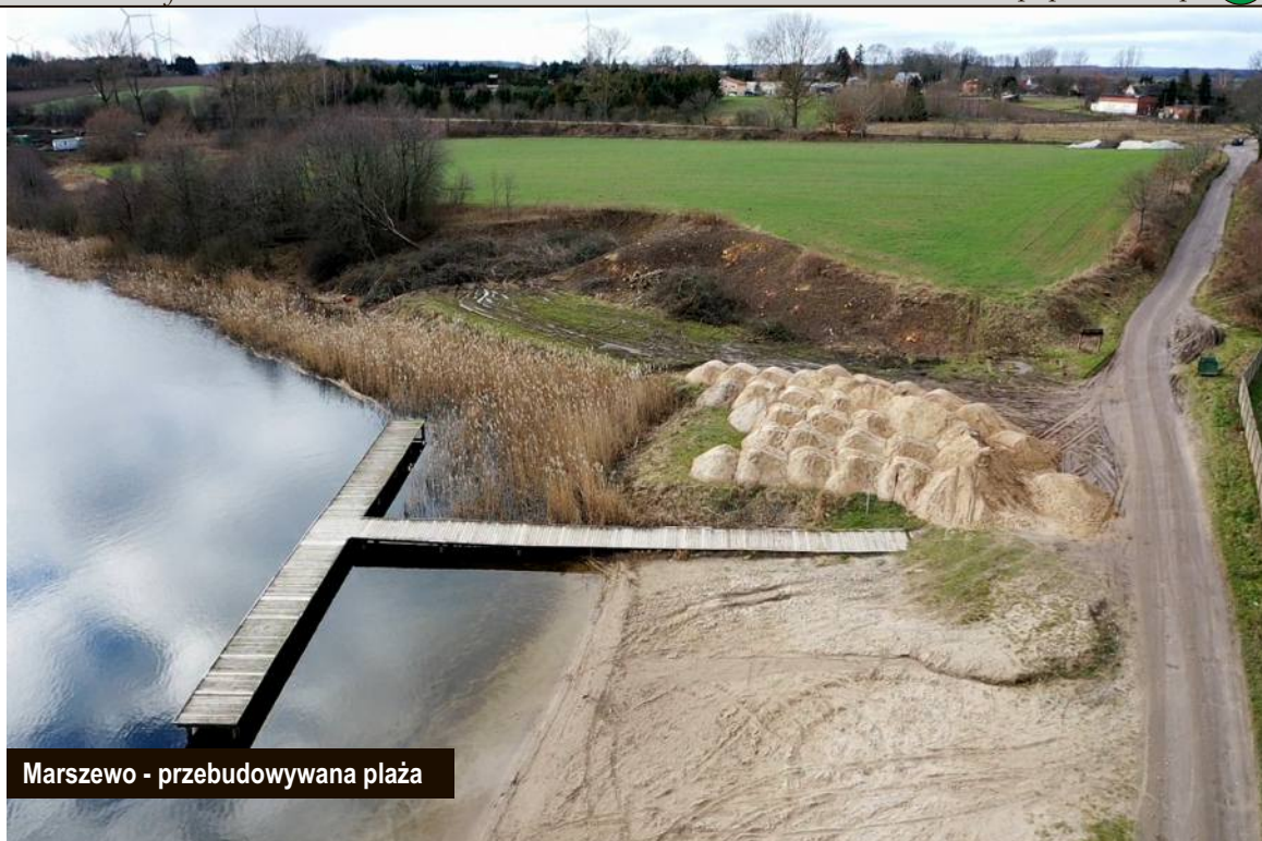
Marszewo - przebudowywana plaża

Dodatkowo wykonawca rozbudowy drogi wojewódzkiej 203 przystąpił do wycinki drzew kolidujących z inwestycją.