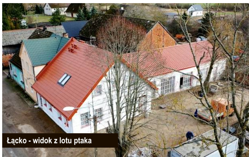
Łącko - widok z lotu ptaka