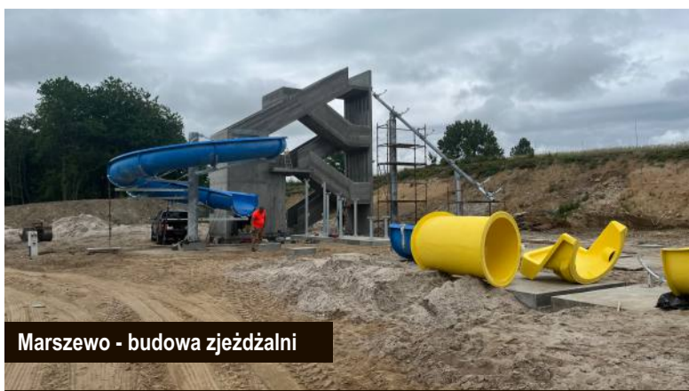
Marszewo - budowa zjeżdżalni