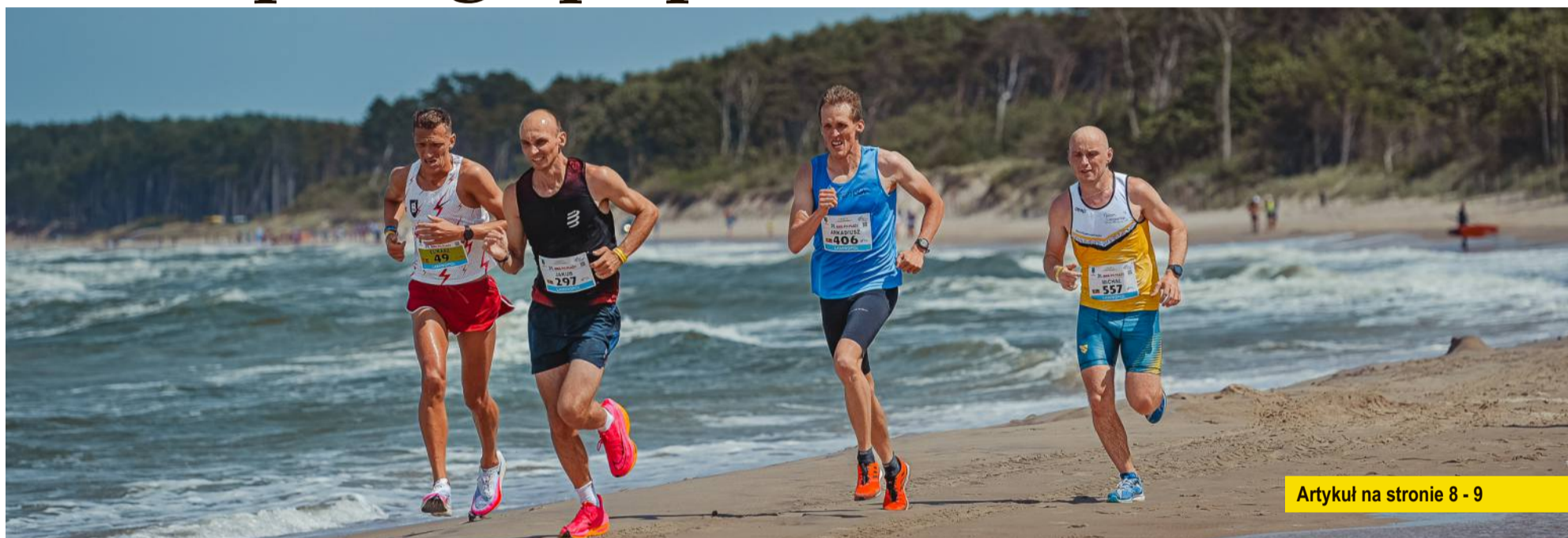
Artykuł na stronie 8 - 9