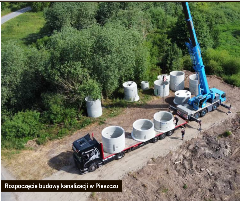
Rozpoczęcie budowy kanalizacji w Pieszczu

Wykonawca rozbudowy drogi wojewódzkiej 203 realizuje roboty ziemne na poszczególnych odcinkach w miejscach wprowadzonego ruchu wahadłowego.