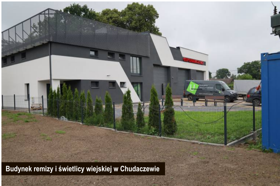
Budynek remizy i świetlicy wiejskiej w Chudaczewie

Wraz z początkiem wakacji kluczowe dla mieszkańców gminy inwestycje zbliżają się do końca.