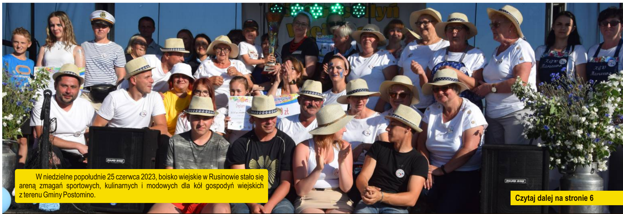
W niedzielne popołudnie 25 czerwca 2023, boisko wiejskie w Rusinowie stało się areną zmagani sportowych, kulinarnych i modowych dla kół gospodyń wiejskich z terenu Gminy Postomino.