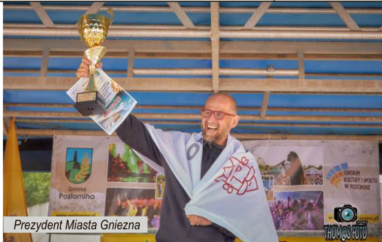
Prezydent Miasta Gniezna