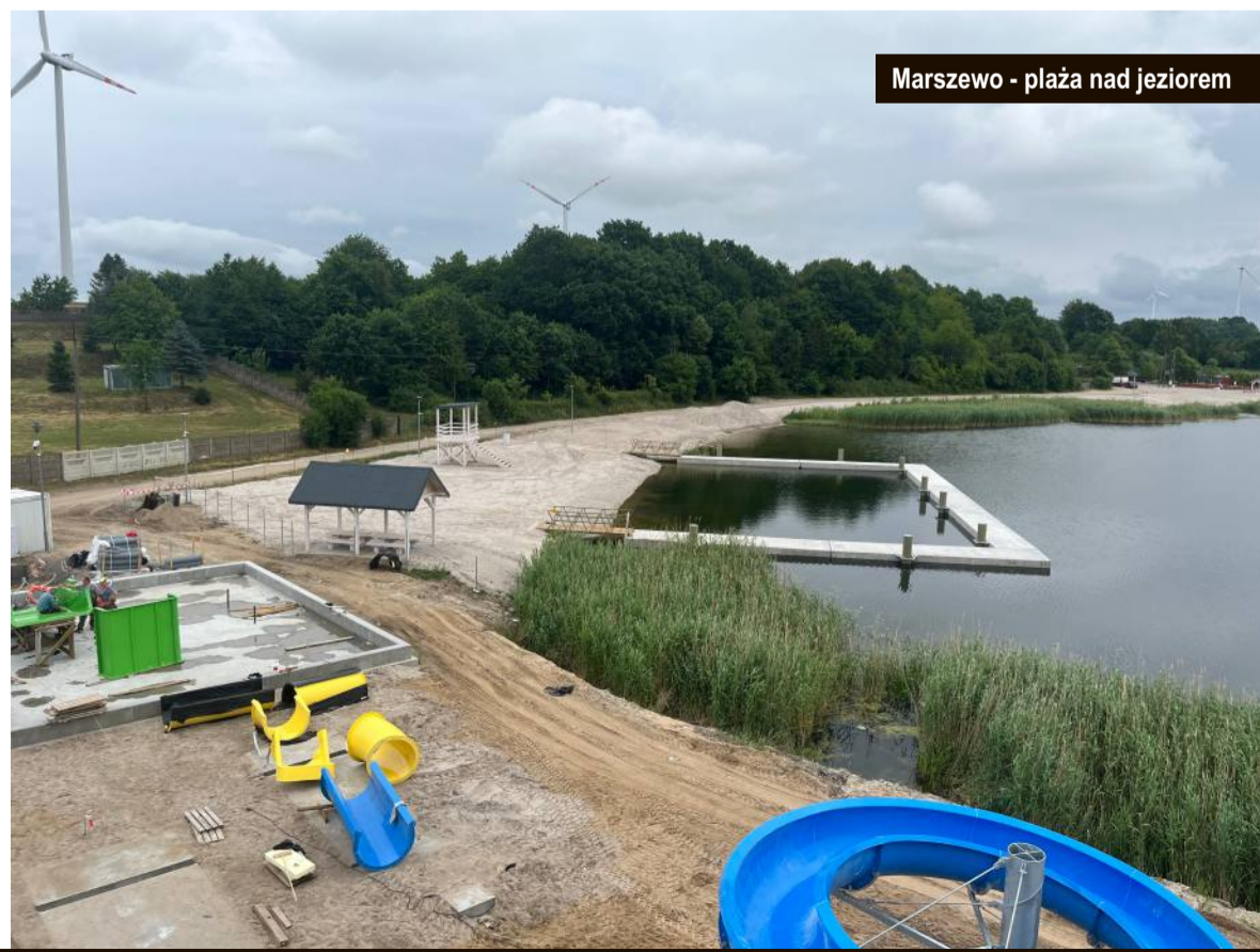
Marszewo - plaża nad jeziorem