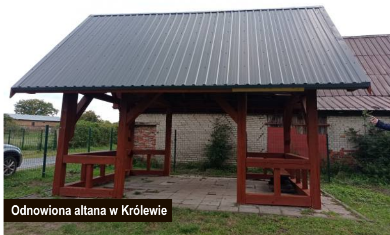
Odnowiona altana w Królewie

PAO to szansa dla mieszkańców Gminy Postomino, którzy sami mogą decydować na co mają być przeznaczone środki finansowe dedykowane ich sołectwu. Warto