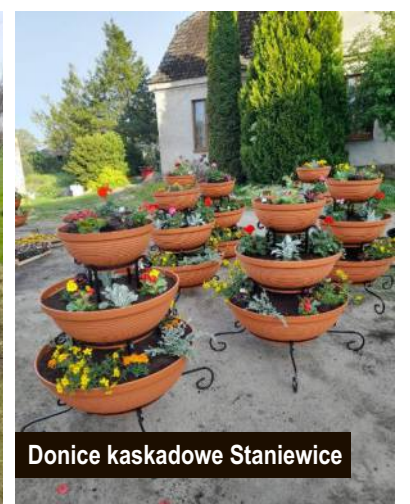
Donice kaskadowe Staniewice