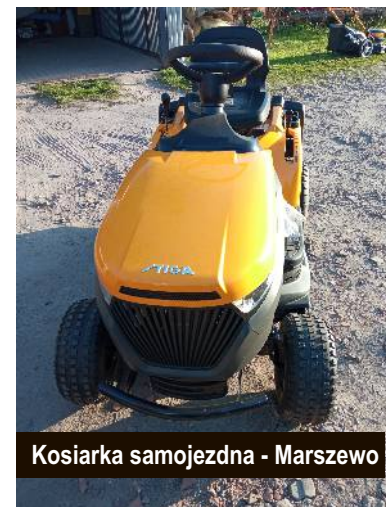
Kosiarka samojezdna - Marszewo