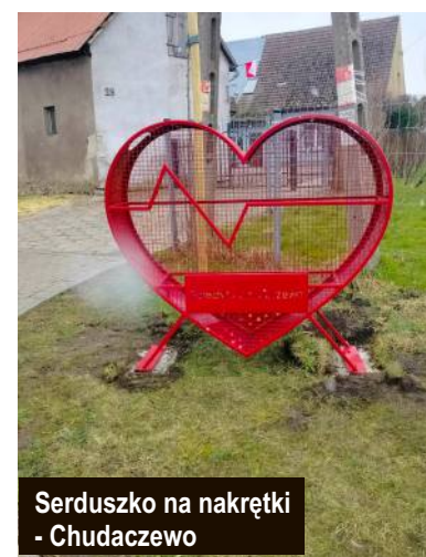
Serduszko na zakrętki - Chudaczewo