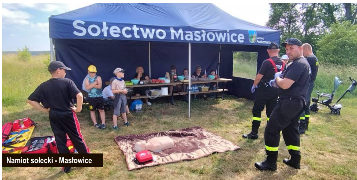
Namiot sołecki - Masłowice

Kolejnym udanym pomysłem było wybudowanie przez mieszkańców Górsko altany rekreacyjnej, gdzie koszt materiałów wyniósł 11 410,00 zł. Do tej pory zakupiliśmy mnóstwo nowych donic, w których posadzone kwiaty pięknie się prezentują. Zorganizowano wiele festynów, pikników, wyjazdów, doposażono świetlice wiejskie. Zakupiono ławki, grille, metalowe serduszka na zakrętki, elementy placu zabaw, namioty sołeckie, zestawy biesiadne, bramki do piłki nożnej, zestawy do siatkówki, kosiarki, elementy ogrodzenia, stojaki na rowery, stoły do tenisa stołowego, piłkarzyki, kuchenki gazowe, witrinę chłodniczą, gastronomiczną patelnię elektryczną, warki, urządzenia do waty cukrowej, odnowiono altany w Dzierżęcinie i Królewie.