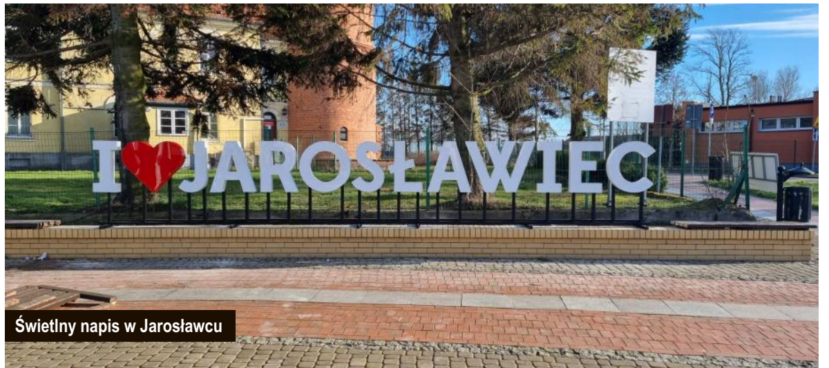
Świetlny napis w Jarosławcu

Grupa I (do 150 mieszkańców) - sołectwa: Bylica, Dzierżęcin, Górsko, Kanin, Karsino, Masłowice, Mazów, Pałowo,