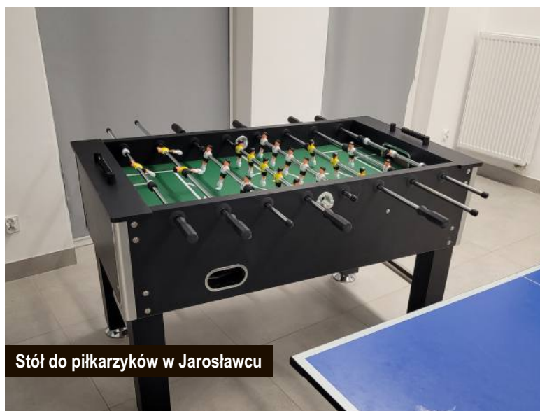
Stół do piłkarzyków w Jarosławcu

Kolejnym udanym pomysłem było wybudowanie przez mieszkańców Górsko altany rekreacyjnej, gdzie koszt materiałów wyniósł 11 410,00 zł. Do tej pory zakupiliśmy mnóstwo nowych donic, w których posadzone kwiaty pięknie się prezentują. Zorganizowano wiele festynów, pikników, wyjazdów, doposażono świetlice wiejskie. Zakupiono ławki, grille, metalowe serduszka na zakrętki, elementy placu zabaw, namioty sołeckie, zestawy biesiadne, bramki do piłki nożnej, zestawy do siatkówki, kosiarki, elementy ogrodzenia, stojaki na rowery, stoły do tenisa stołowego, piłkarzyki, kuchenki gazowe, witrinę chłodniczą, gastronomiczną patelnię elektryczną, warki, urządzenia do waty cukrowej, odnowiono altany w Dzierżęcinie i Królewie.