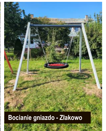
Bocianie gniazdo - Złakowo