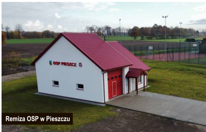
Remiza OSP w Pieszczy

Ponadto w miejscowości Pieńkowo prowadzone są roboty przy przebudowie drogi gminnej w kierunku Pieńkówka. Niestety warunki pogodowe utrudniają realizację zadania. Koszt przebudowy wyniesie ok. 2 000 000,00 zł., zadanie to zostało dofinansowane ze środków Unii Europejskiej w ramach Programu Rozwoju Obszarów Wiejskich Województwa Zachodniopomorskiego