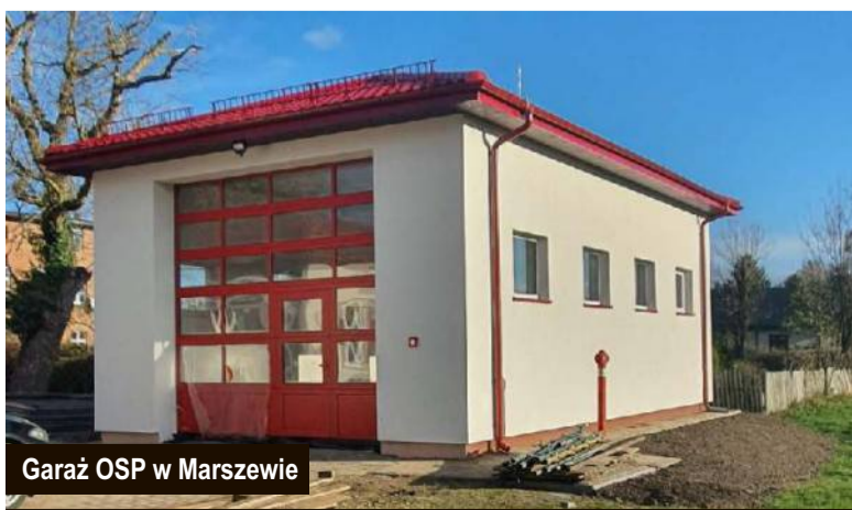
Garaż OSP w Marszewie

zakładał budowę samej oczyszczalni oraz część sieci obejmującej teren budynków wielorodzinnych. W ostatnim czasie otrzymaliśmy dobrą informację o uzyskaniu dofinansowania na kolejny- drugi etap budowy kanalizacji sanitarnej. Zakłada on rozbudowę sieci kanalizacji w miejscu największej koncentracji budynków mieszkalnych. Trwają prace związane w przygotowaniem dokumentacji przetargowej na realizację kolejnej części tego dużego zadania.