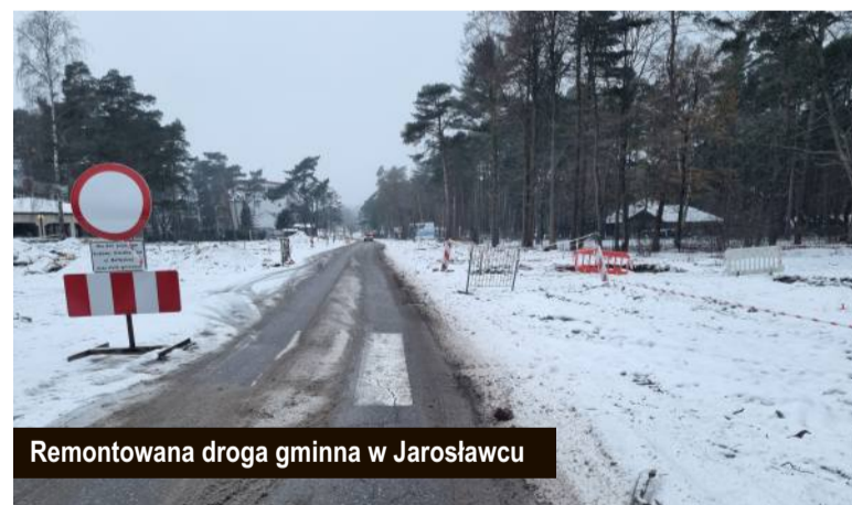
Remontowana droga gminna w Jarosławcu