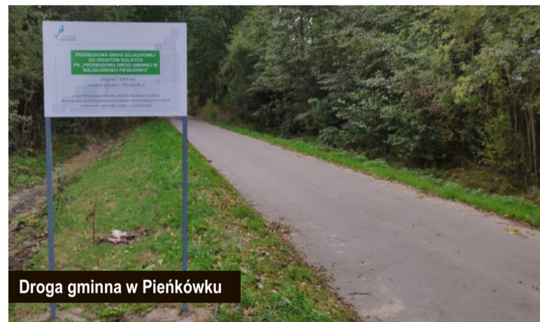
Droga gminna w Pieńkówku

W miejscowości Ronino trwa budowa altany rekreacyjnej, obok której zostaną zamontowane elementy siłowni zewnętrznej oraz elementy rekreacyjno-edukacyjne w postaci m. in. tzw. „głuchego telefonu”, a także powstanie miejsce na ognisko. Na realizację zadania Gmina otrzymała wsparcie środków unijnych w ramach poddziałania 19.2 „Wsparcie na wdrażanie operacji w ramach strategii rozwoju lokalnego kierowanego przez społeczność”, objętego Programem Rozwoju Obszarów Wiejskich Województwa Zachodniopomorskiego