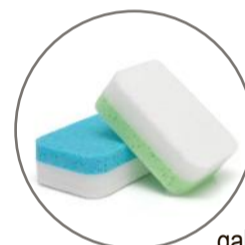
gąbka kosmetyczna do ciała