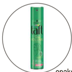
opakowanie po lakierze do włosów