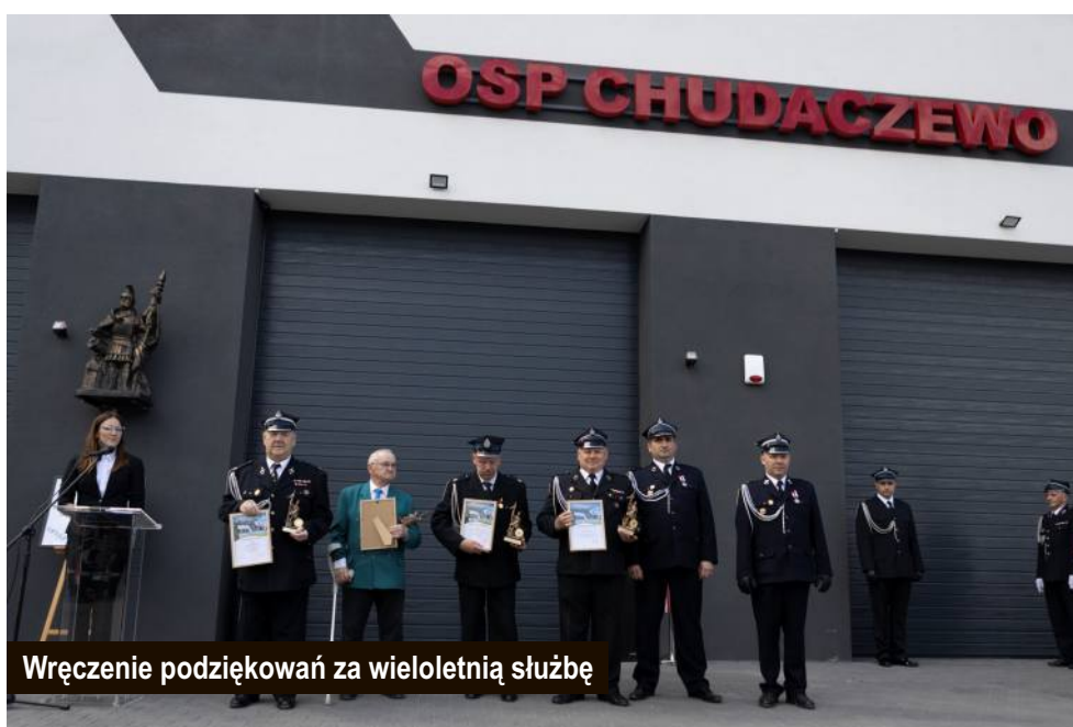
Wręczenie podziękowań za wieloletnią służbę