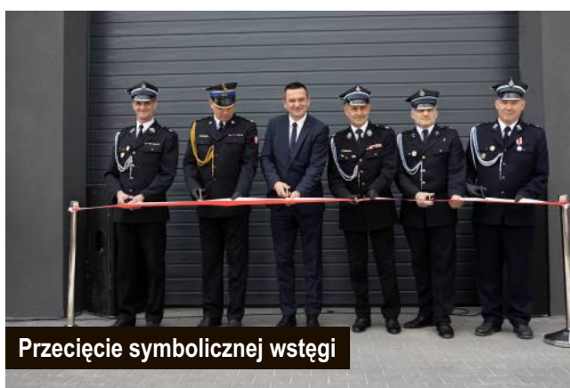
Przecięcie symbolicznej wstęgi