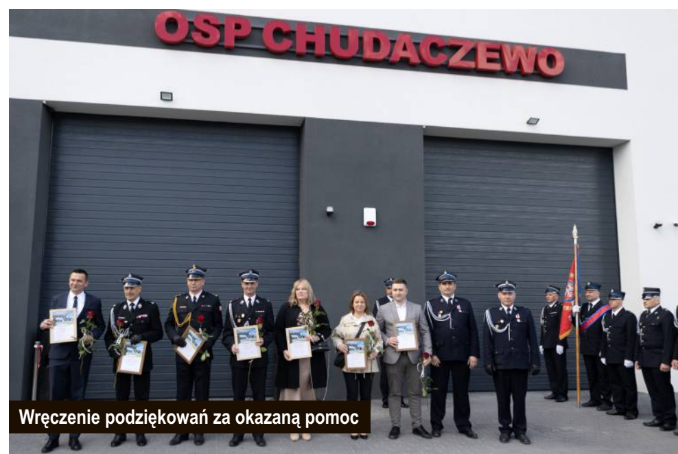
Wręczenie podziękowań za okazaną pomoc