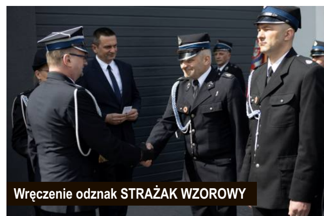
Wręczenie odznak STRAŻAK WZOROWY