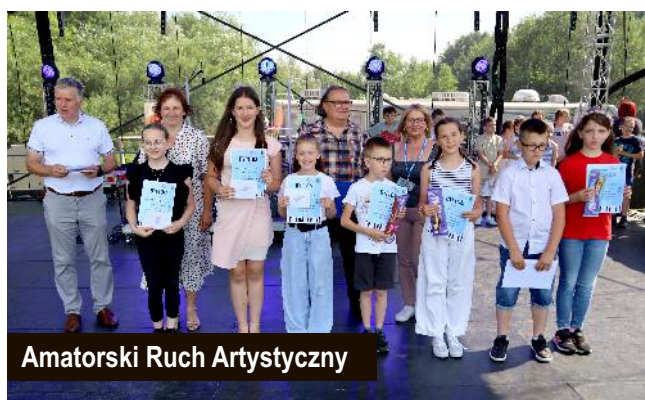
Amatorski Ruch Artystyczny