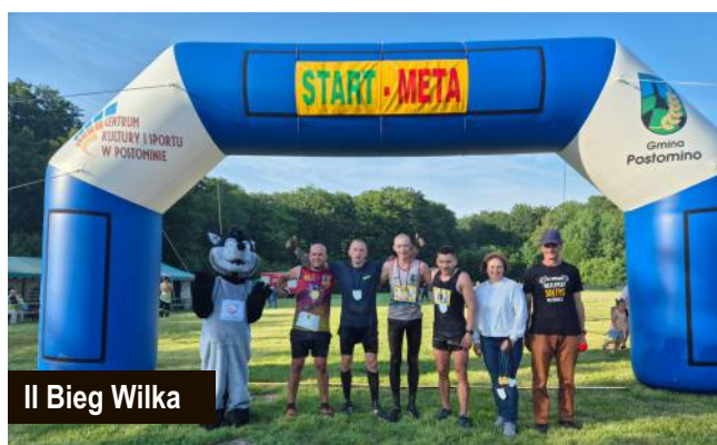
II Bieg Wilka