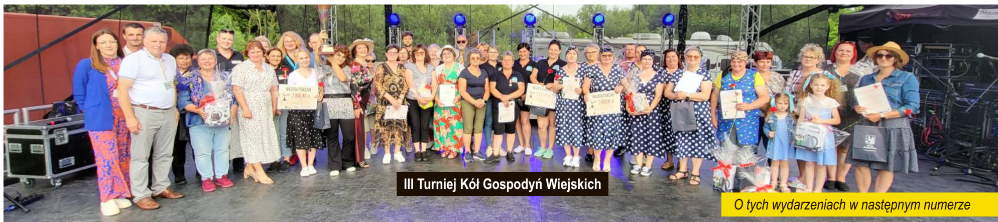
III Turniej Kół Gospodyń Wiejskich