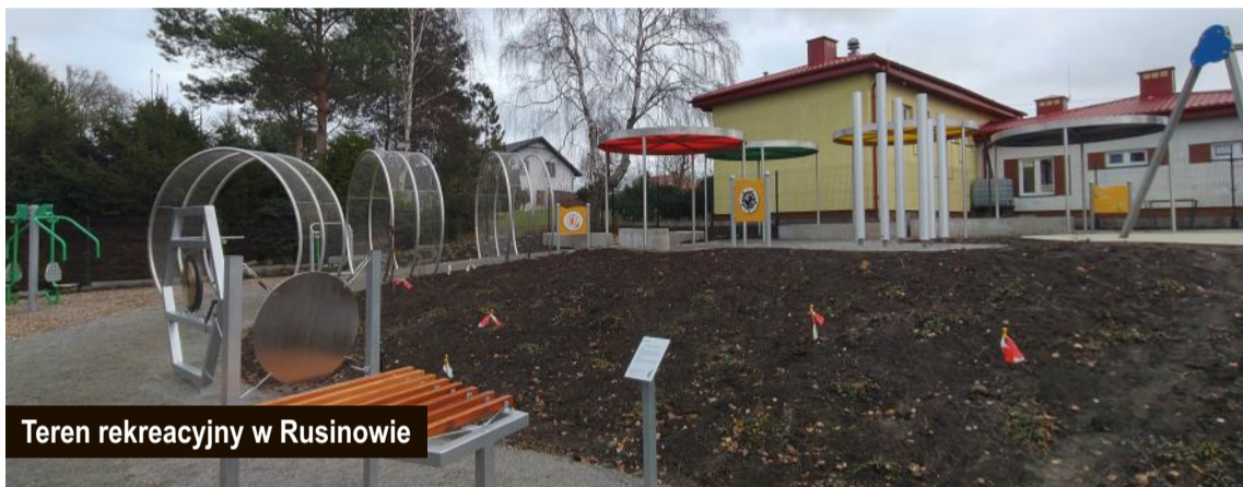
Teren rekreacyjny w Rusinowie