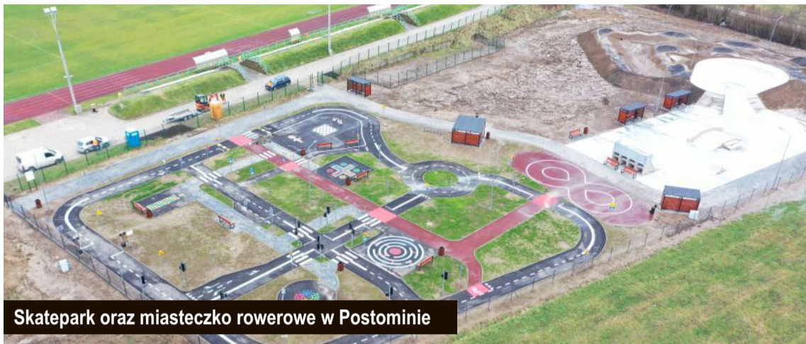
Skatepark oraz miasteczko rowerowe w Postominie