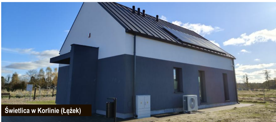
Świetlica w Korlinie (Łężek)