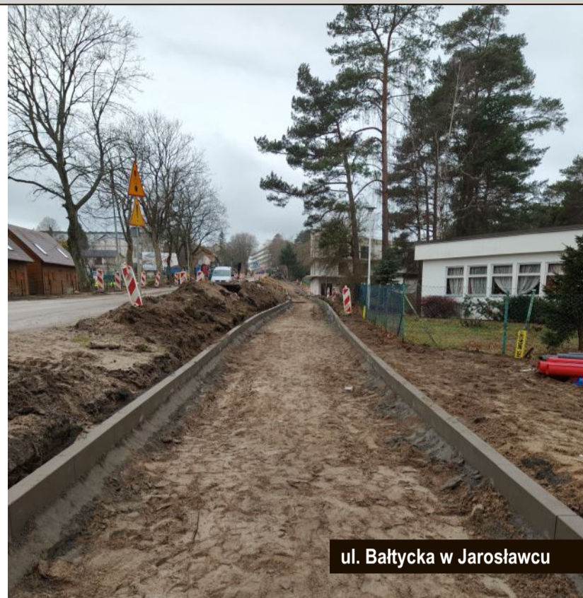
ul. Bałtycka w Jarosławcu

Gmina Postomino na realizację przedmiotowego zakresu uzyskała dofinansowanie w ramach Rządowego Funduszu Rozwoju Dróg.