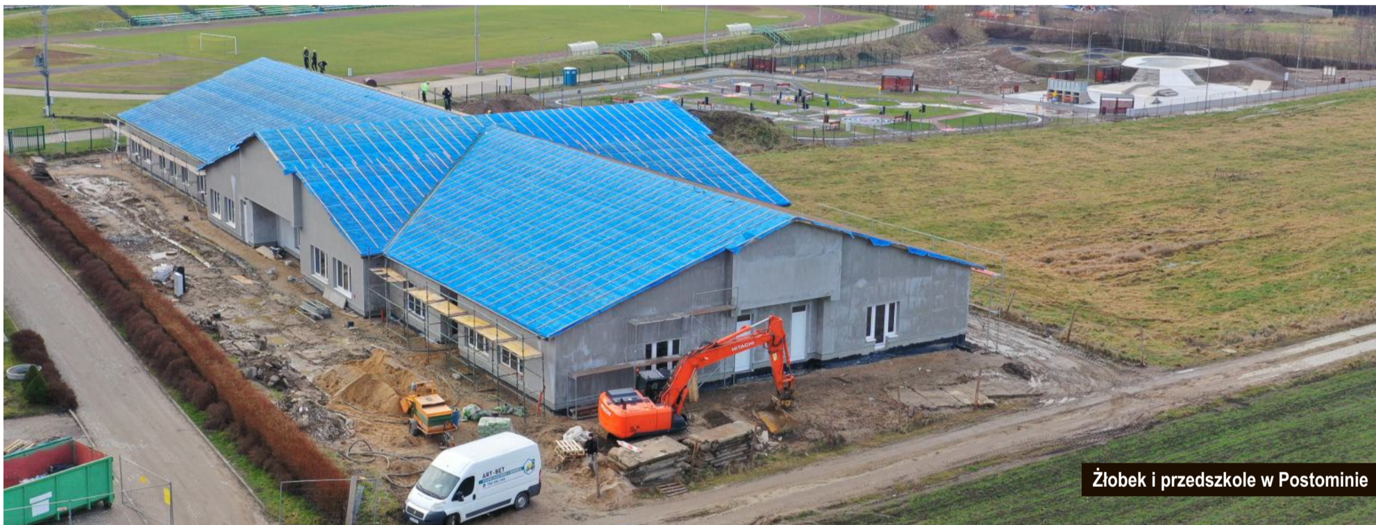
Żłobek i przedszkole w Postominie